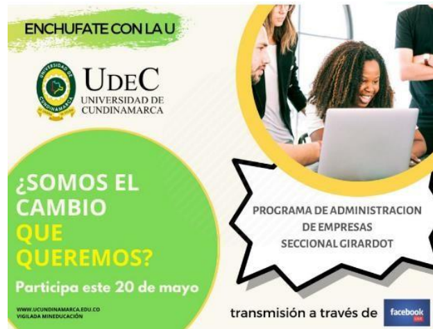
Ilustración 11 Socialización Medit Facebook Live