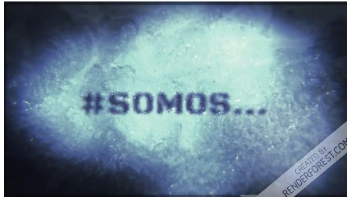
Ilustración 4 Expectativa 3