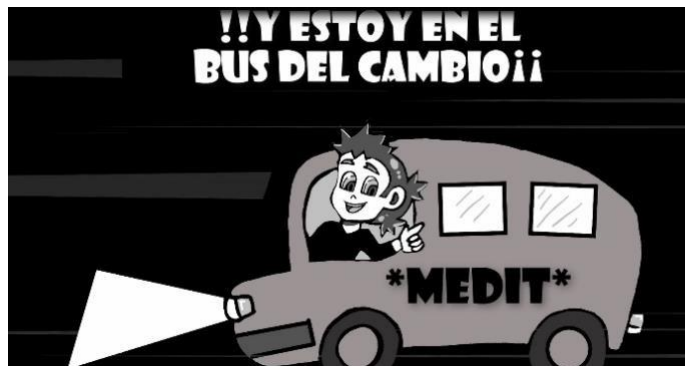
Ilustración 10 Max