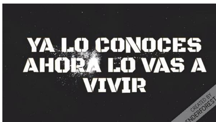
Ilustración 3 Expectativa 2