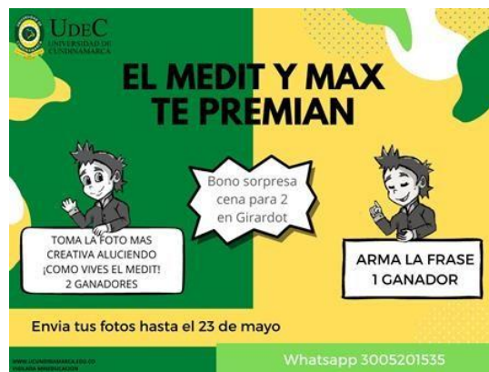
Ilustración 7 Publicidad de Incentivo 2