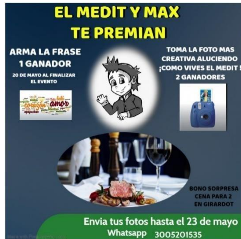
Ilustración 6 Publicidad de Incentivo 1