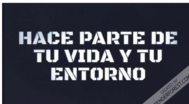
Ilustración 2 Expectativa 1