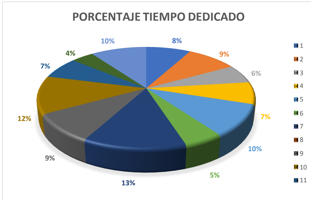
GRAFICA 1 Tiempo Invertido por Objetivos

Análisis del gráfico: El objetivo que más demanda tiempo es el de Coadyuvar en la realización de las actividades definidas en el cuadro SharePoint de autoevaluación para el proceso curricular y registro calificado teniendo en cuenta 12% de tiempo dedicado a cumplir con diferentes actividades encaminadas en este objetivo.