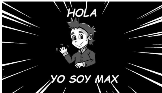
Ilustración 9 Lanzamiento

4. Hace un clip de video donde se muestre la historia que se quiere contar, construyendo a Max y fusionar escenas correctas para su respectiva presentación. (20 horas)