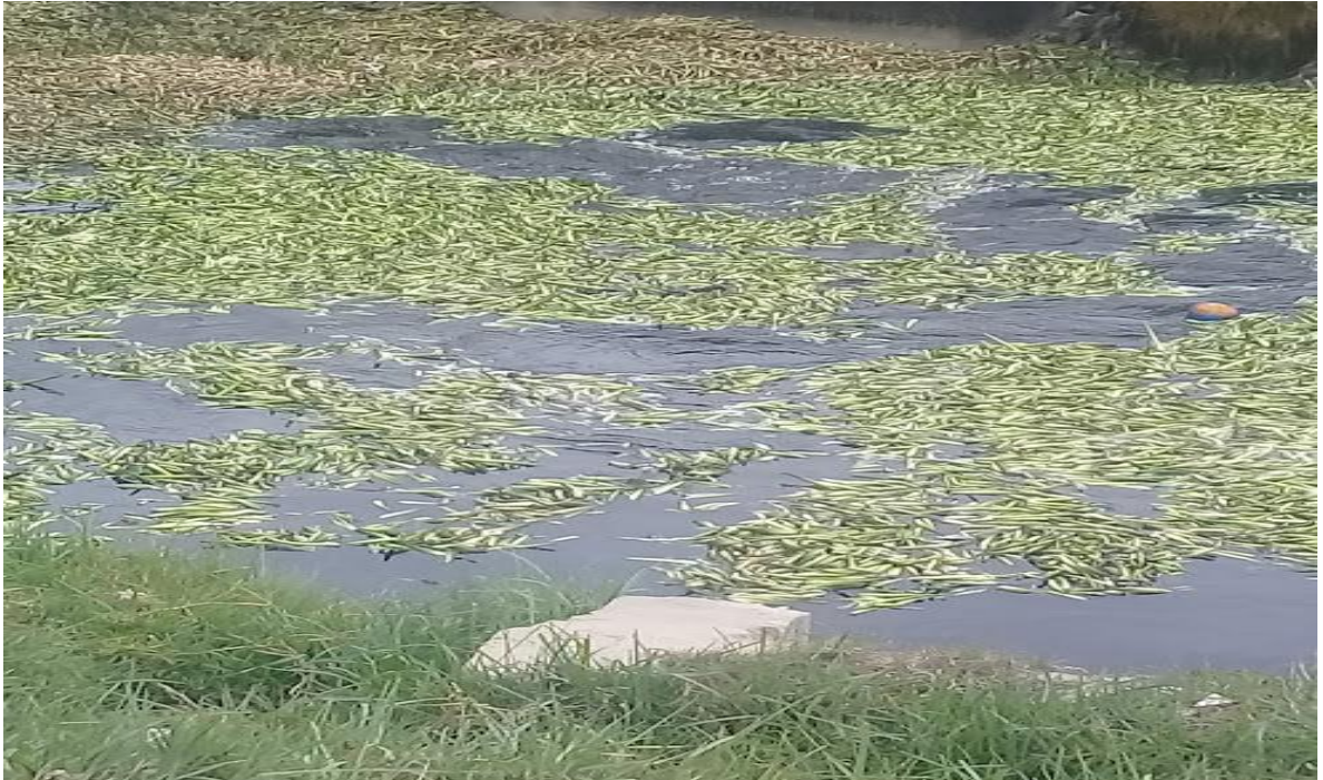
Ilustración 8 Contaminación cuenca río botello