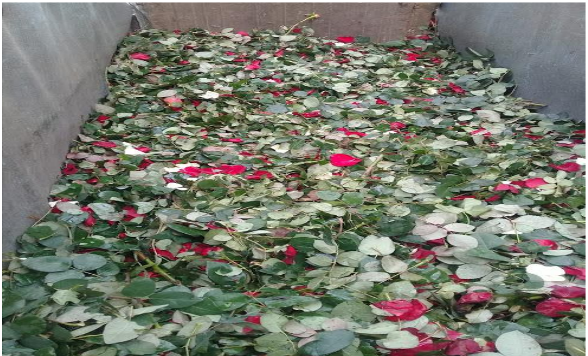
Ilustración 7 Compostaje a base de flor

Por otro lado, los residuos sólidos resultante del proceso productivo en el área de postcosecha en el corte del tallo de la flor según requerimientos de cada cliente, ocasionan desechos ya contaminados con todos los químicos utilizados durante el transcurso de su crecimiento, aunque estos residuos sólidos son tratados y convertidos en compostaje, lo cual se realiza en huecos que hacen en la tierra para su respectivo tratamiento algunos son arrojados a afluentes hídricas de la zona perjudicando aún más la calidad del agua debido a la gran cantidad de contaminantes no orgánicos.