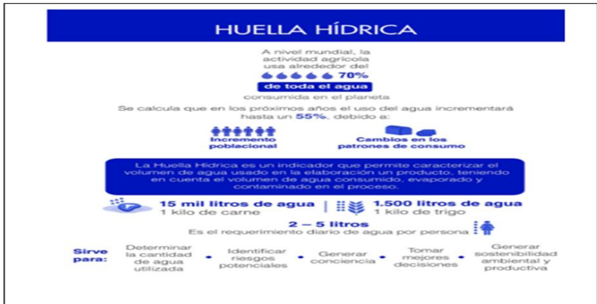
Ilustración 2 Indicador huella hídrica

productos químicos contaminantes que de una u otra manera repercuten en este preciado líquido.