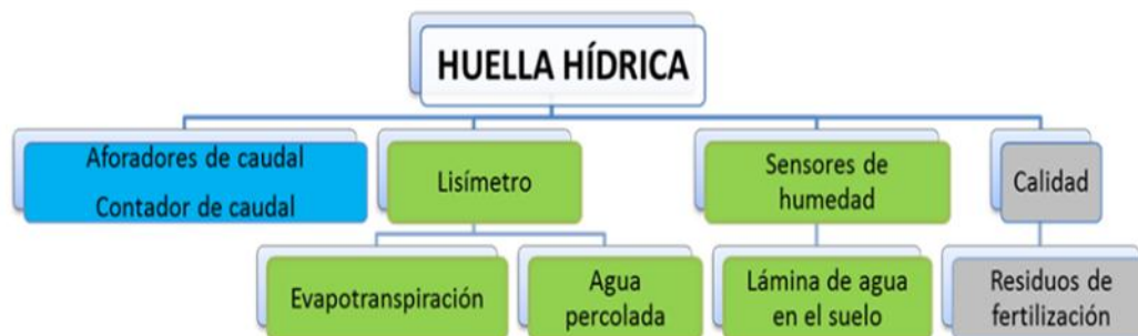
Ilustración 1 Componentes Huella Hídrica