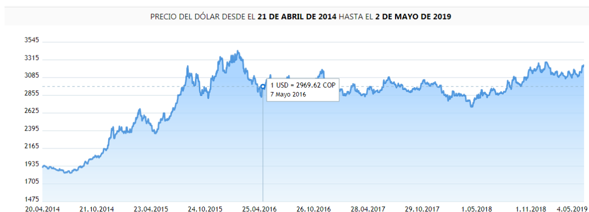
Gráfica del precio del dólar