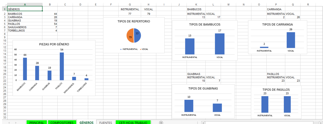
Imagen 3 Estadísticas piezas por género y tipos de repertorio