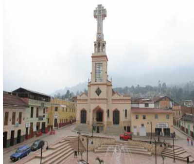
Ilustración 1. Templo parroquial de San Bernardo Cundinamarca

San Bernardo es un municipio de Cundinamarca (Colombia), ubicado en la provincia del Sumapaz; este municipio se encuentra ubicado a 99 km de la ciudad de Bogotá caracterizado por ser despensa agrícola en su región debido a la fertilidad de sus suelos y variedad de climas. San Bernardo nace de una extensa cantidad de terrenos montañosos colonizados desde finales del siglo XIX, el 22 de julio de 1910 en las horas de la mañana, el padre Francisco Antonio Mazo párroco