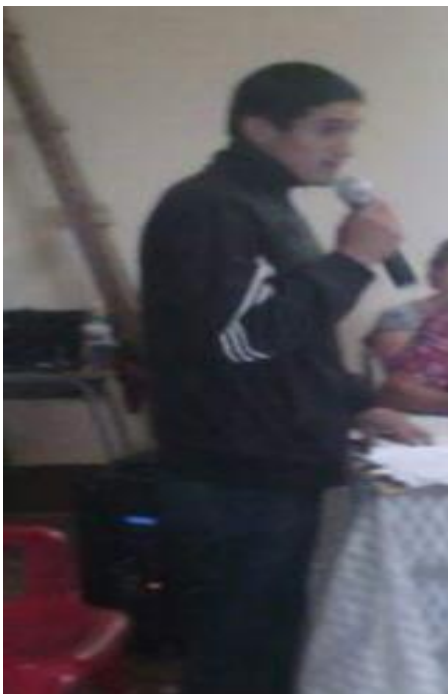
Ilustración 3. Líder Campesino