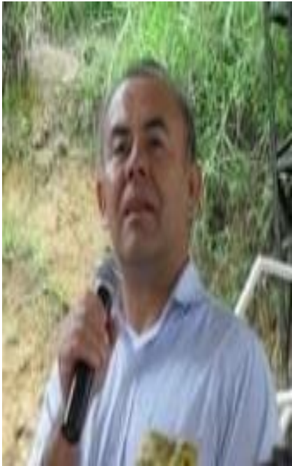
Ilustración 2. Rector de la Institución Educativa Escuela Normal Superior