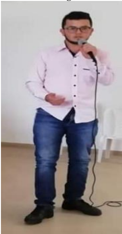
Ilustración 5. Egresado de la Institución Educativa Escuela Normal Superior