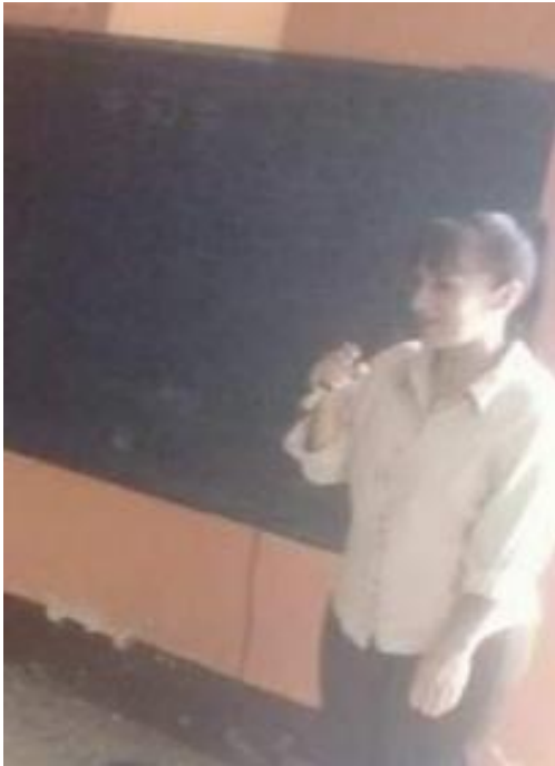
Ilustración 4. Líder Comunal