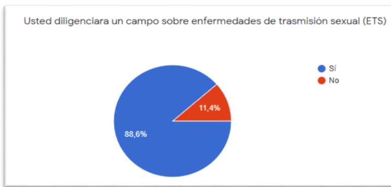
Ilustración 2. Diligenciaría un campo de ETS.

En el desarrollo de la fase cero se realizó el levantamiento de información con preguntas puntuales a cada una de las necesidades, como también hasta donde los usuarios permitieron mostrar sus antecedentes médicos personales, para esta fase se evaluaron diferentes aspectos y antecedentes que se van a mostrar en la aplicación entre ellos se preguntó sobre si estaría dispuesto a hacer uso de la aplicación a lo cual casi su totalidad respondieron de manera afirmativa como se puede ver en la ilustración 1 expuesta anteriormente, otros aspectos que se preguntaron cómo, ¿permitiría que la aplicación mostrase si sufría de alguna enfermedad o enfermedades de transmisión sexual? Donde también se recibió una respuesta de aprobación como lo podemos ver en las ilustraciones 2 y 3 respectivamente.