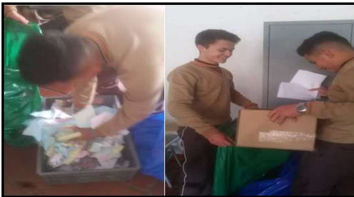
Ilustración 5. Evidencia recolección de reciclaje.