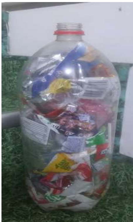
Ilustración 7. Ejemplo Ecoladrillo.