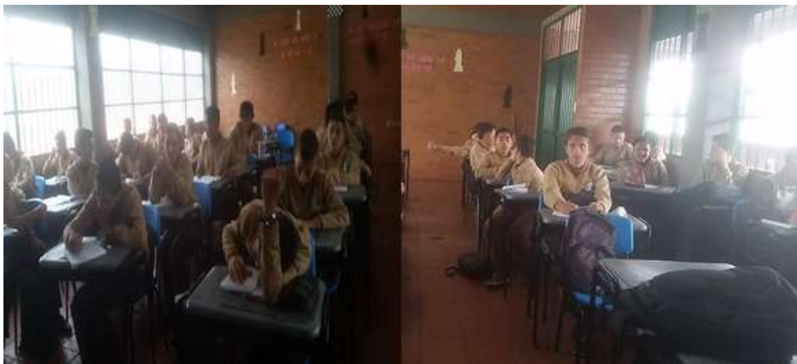
Ilustración 4. Evidencia charlas de capacitación.

Aplicación: Se consigue realizar la charla de capacitación a 3 cursos de la jornada mañana y tarde abarcando un total de 98 estudiantes con su docente y se deja programada la capacitación a 3 cursos de la jornada tarde que abarcan a 92 estudiantes para un total de 190 alumnos como se relaciona en la tabla 7 y como se evidencia en el anexo 1 y 2