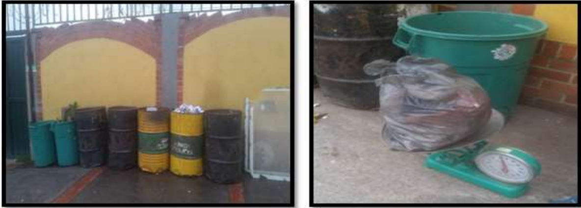
Ilustración 2. Evidencia de la cuantificación y cuarteo de residuos sólidos.

8.3. Etapa 3. Estructuración y aplicación del plan de manejo de residuos sólidos en la Institución Educativa Municipal Arboleda sede Juan Pablo II.