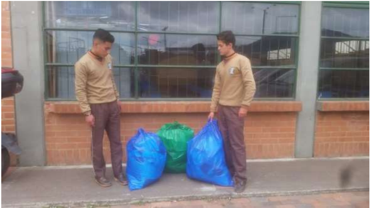
Ilustración 6. Evidencia residuos pesados.