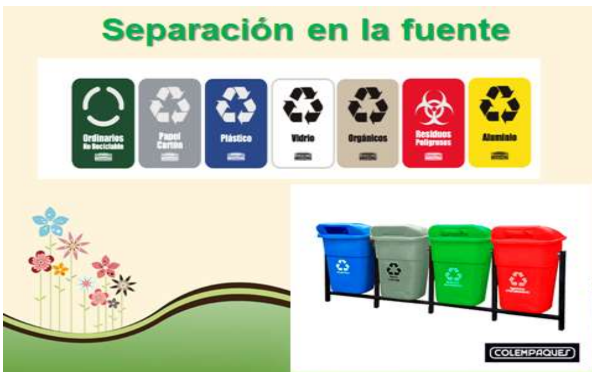
Ilustración 3. Evidencia presentación charla de capacitación.

Descripción: Mediante el presente programa se busca que a través de la capacitación en el tema de residuos sólidos se introduzca en la institución y así en cada uno de los hogares el hábito de su correcto manejo y aprovechamiento. Así como el uso adecuado de los puntos ecológicos que se ubicaran en el plantel en el presente año