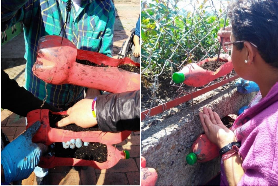
Figura 9. Incisión en la tierra para disposición de semillas

Luego de realizar los hoyos se da paso a la siembra de las semillas la cual se puede evidenciar en la Figura 10, las cuales fueron entregadas a cada uno de los integrantes para que todos sean partícipes de este proceso.