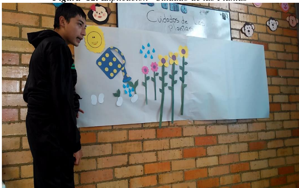
Figura 12. Explicación "Cuidado de las Plantas"

Como resultado de esta actividad se obtuvo el promover actitudes de cuidado y respeto hacia el medio ambiente y como tal hacia el huerto que cada uno de ellos sembró y que se le fue otorgado, adicionalmente se fomenta la responsabilidad hacia la tarea y se favorece el trabajo autónomo.