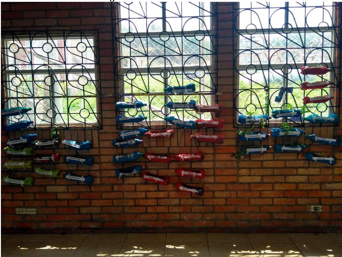
Figura 11. Huerta Vertical del CDM

Adicionalmente la población objeto de estudio identifico la importancia de cultivar plantas para el consumo humano, puesto que en primer lugar se le da un valor a los espacios subutilizados como lo es el CDM y, por otra parte, son hortalizas y aromáticas naturales que no requieren agroquímicos durante el desarrollo lo cual es bueno para la salud de las personas y del ambiente.