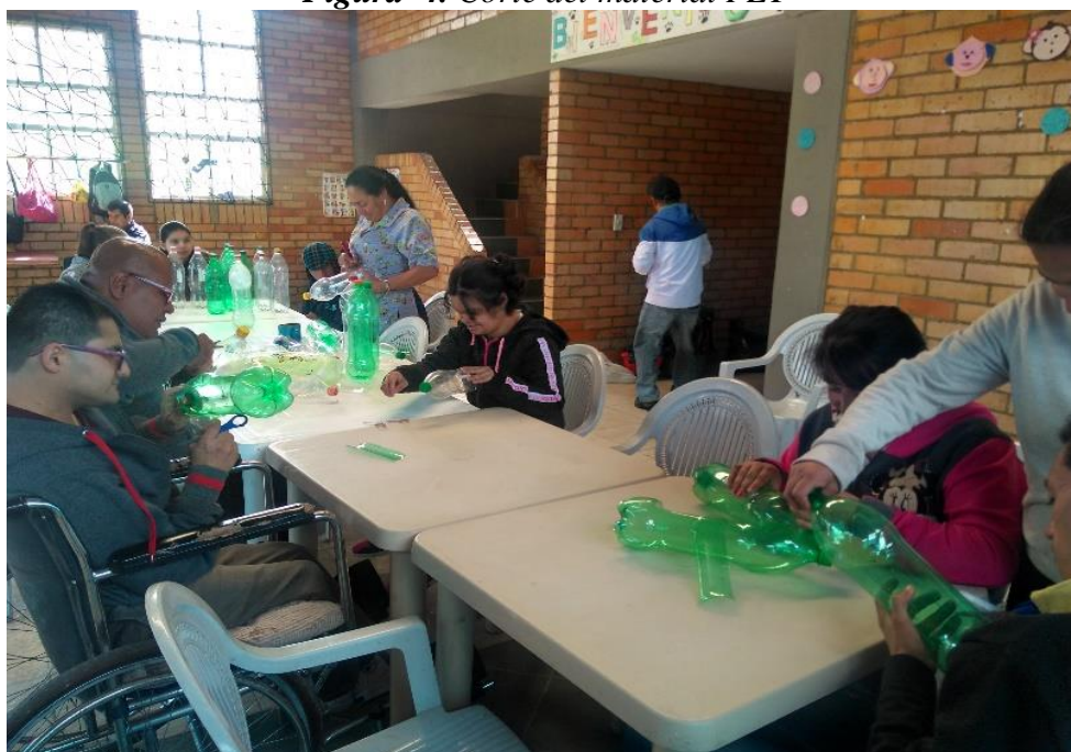
Figura 4. Corte del material PET

Como segundo paso se procedió a pintar las botellas (ver Figura 5) de modo que el espacio donde se dispondrán las materas se vea más armonioso y llamativo.