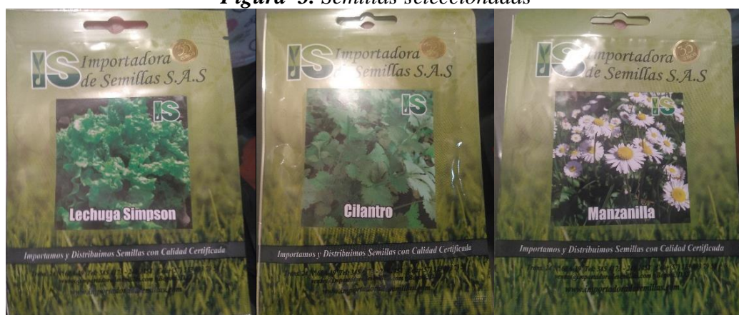
Figura 3. Semillas seleccionadas

Posteriormente se conversó con la encargada del CDM y los integrantes de esta comunidad teniendo en cuenta que ellos son parte fundamental para el desarrollo de las actividades propuestas y que si bien presentan diferentes condiciones especiales deben ser integrados en la toma de decisiones como lo es la selección de semillas a sembrar teniendo en cuenta las condiciones climáticas, de espacio disponible, de tiempo de germinación y facilidad en cuanto a cuidados se llegó a la selección de semillas de Cilantro, Lechuga y Manzanilla (ver Figura 3).