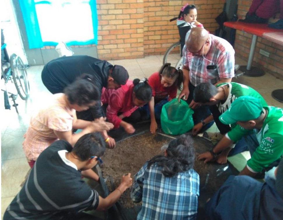
Figura 7. Preparación del Sustrato (Tierra)

Como resultado de esta actividad es el desarrollo de la capacidad cognitiva a través de la observación, exploración y manipulación del entorno del huerto (tierra), reconociendo las características como el tamaño, el color, la textura y la forma a partir de las acciones que se pueden desarrollar con esta.