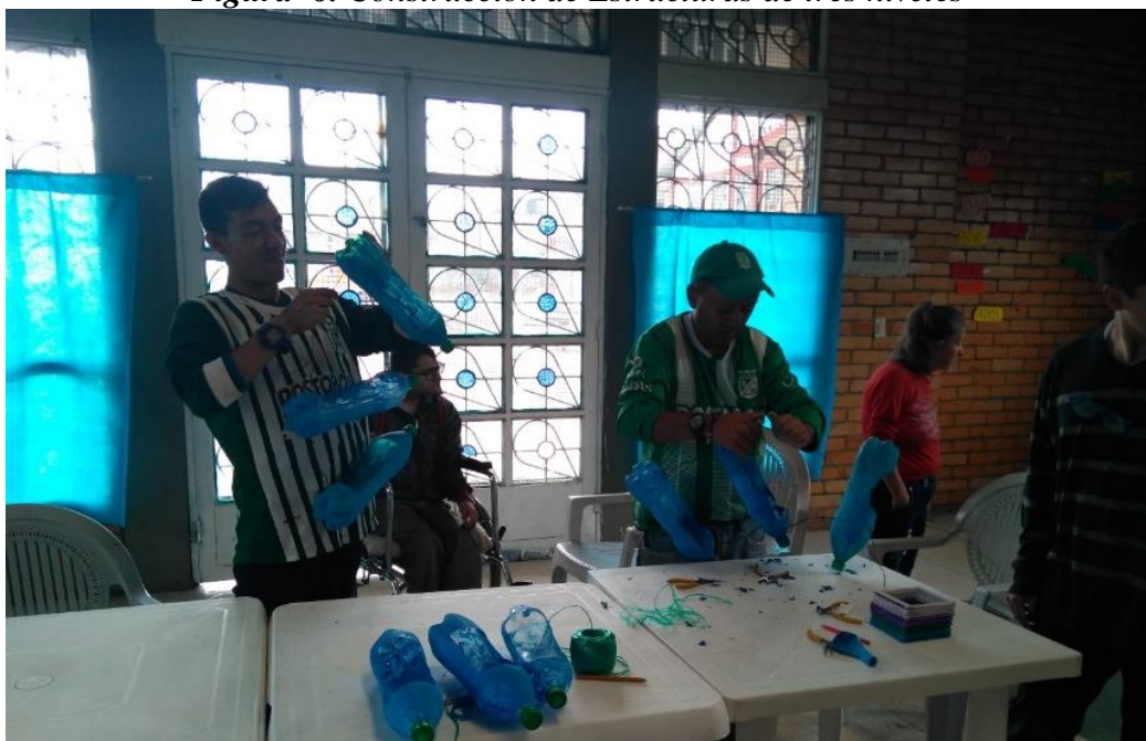
Figura 6. Construcción de Estructuras de tres niveles

Luego de la preparación del material PET se empiezan a construir las estructuras de tres niveles para las huertas verticales usando alambre dulce, lo que facilitara la manipulación por parte de los integrantes al momento de armar dichas estructuras como se visualiza en la Figura 6.