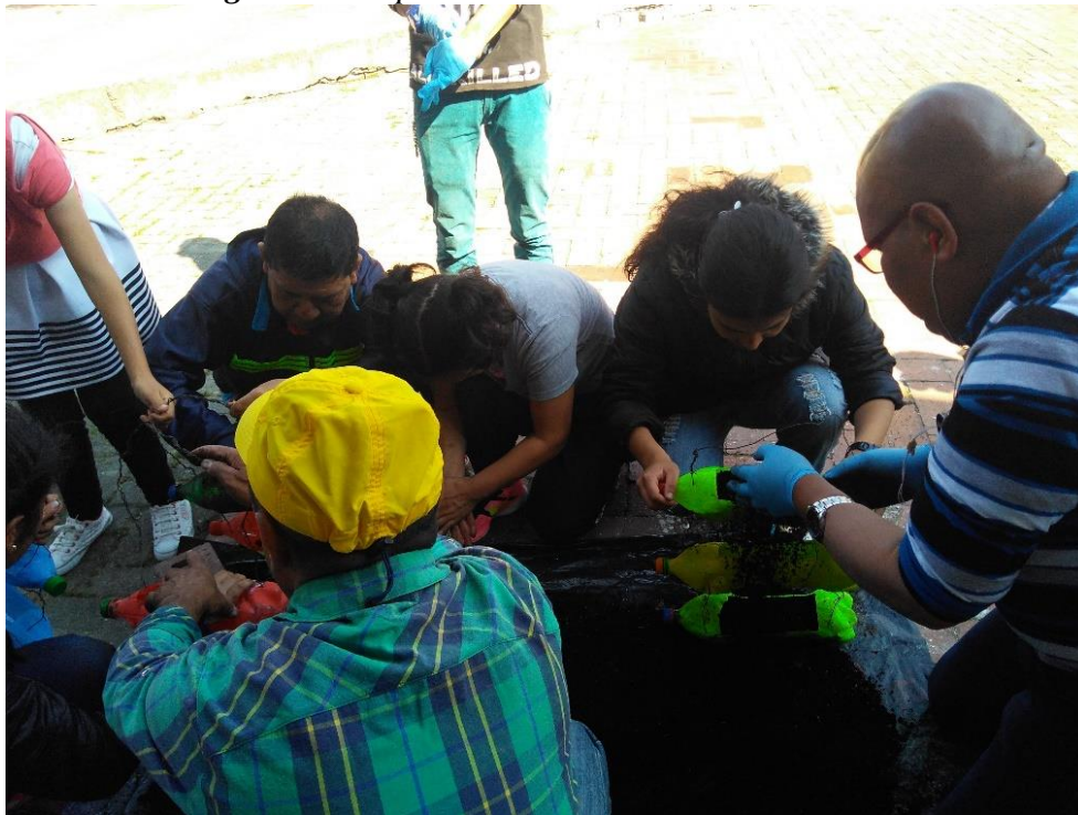
Figura 8. Disposición de la tierra en las materas

De esta manera se dio inicio a la siembra de semillas, explicando a cada uno de los integrantes como debía realizarse dicho proceso.