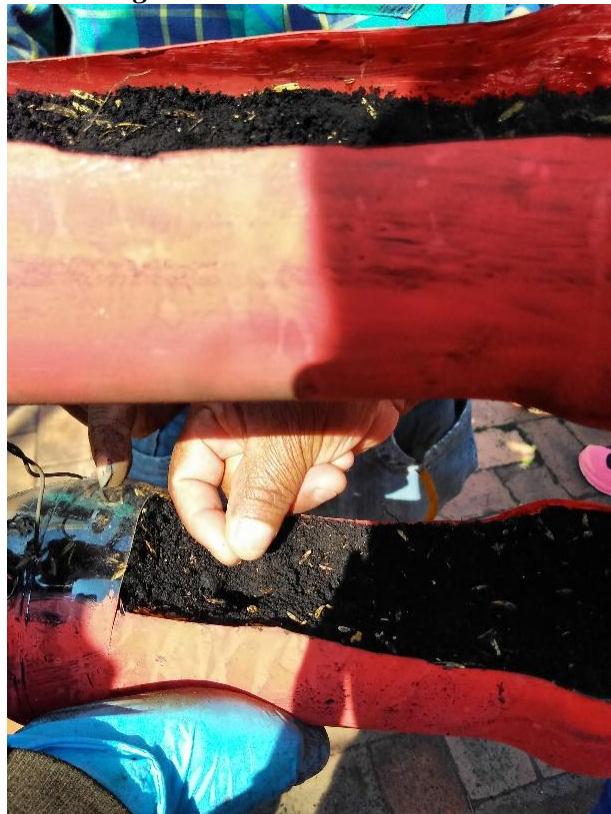
Figura 10. Siembra de Semillas

Luego de realizar los hoyos se da paso a la siembra de las semillas la cual se puede evidenciar en la Figura 10, las cuales fueron entregadas a cada uno de los integrantes para que todos sean partícipes de este proceso.