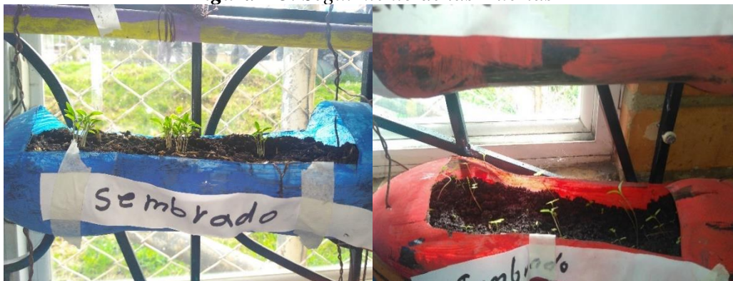
Figura 13. Seguimiento de las Huertas

Teniendo como resultado que un gran porcentaje de las semillas sembradas se desarrolló de manera adecuada basados en los conocimientos aportados durante este proyecto. Es evidente para ellos que la luz solar influye en el crecimiento de la planta puesto que algunas de ellas que no quedaron expuestas al sol presentan un menor tamaño con respecto a las que quedaron con mayor exposición, por otra parte, es claro que estas necesitan raciones de agua apropiadas puesto que si le ponen menor o mayor cantidad a la requerida estas morirán.