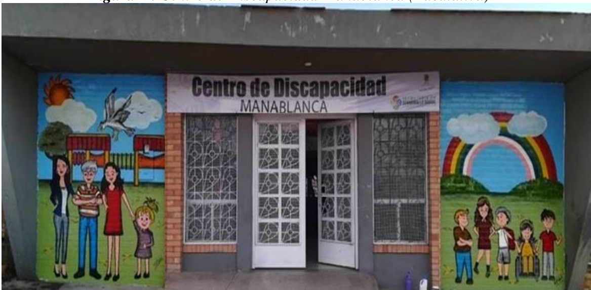
Figura 2. Centro de Discapacidad Manablanca (Facatativá)

Previo al desarrollo de las actividades que se enunciarán más adelante se realizó una visita al Centro de Discapacidad Manablanca (CDM) ubicado en el municipio de Facatativá (Cundinamarca), el cual atiende a 18 individuos que se encuentran entre los 18 y 63 años de edad y que presentan discapacidad sensorial, cognitiva, motora y múltiple, logrando así la identificación de la población objeto de estudio, así como el espacio disponible (Figura 2) para el desarrollo de los talleres prácticos a implementar.