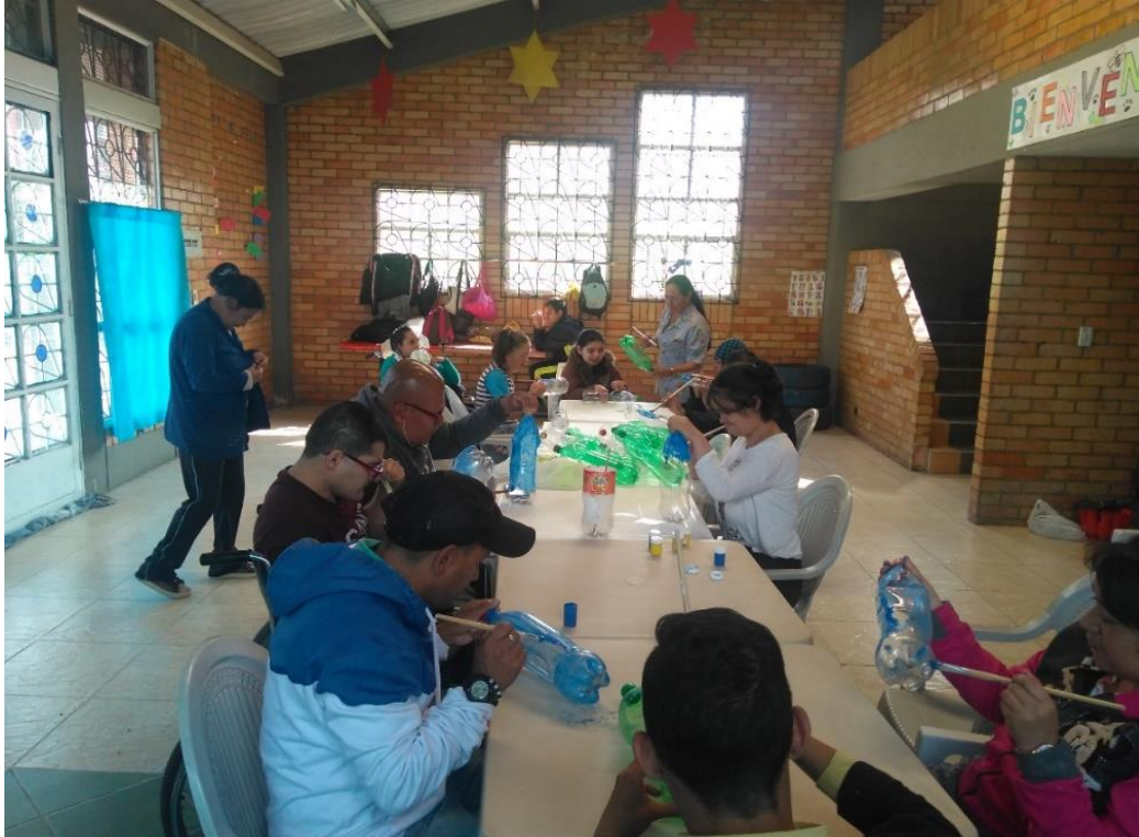
Figura 5. Aplicación de pintura al material PET

Luego de la preparación del material PET se empiezan a construir las estructuras de tres niveles para las huertas verticales usando alambre dulce, lo que facilitara la manipulación por parte de los integrantes al momento de armar dichas estructuras como se visualiza en la Figura 6.