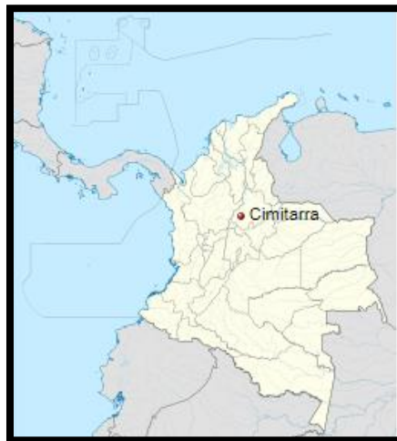
Imagen 1. Ubicación de Cimitarra en Colombia