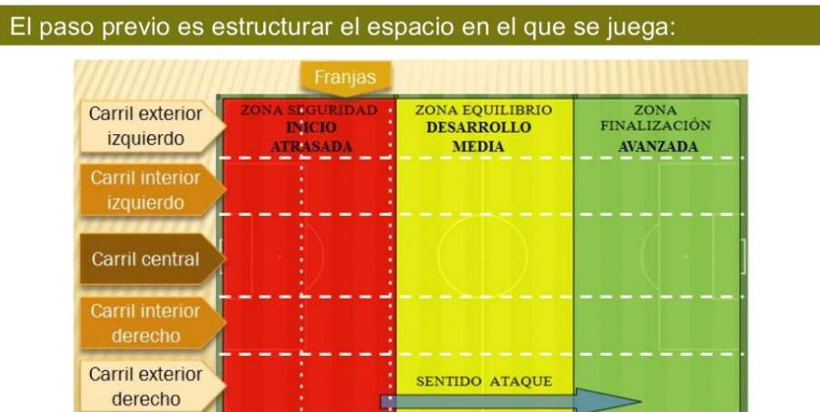
Ilustración 2. El paso previo es estructurar el espacio en el que juega:

Por su comprensión global y entrenamiento vamos a considerar la transición como una fase del juego mucho más amplia (fase de transición), que se inserta indispensablemente en la fase anterior (con una serie de movimientos preparatorios) y en la fase posterior (con el despliegue, caso de pasar al ataque o con el balance defensivo, caso de pasar a la defensa).