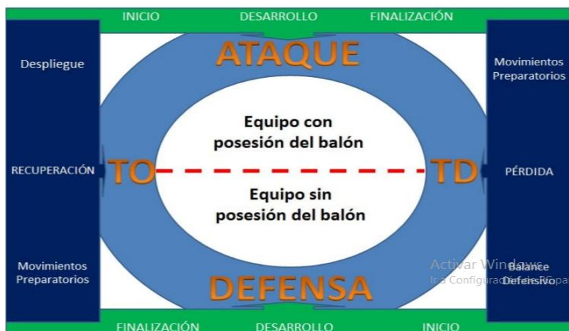
Ilustración 3. Fases de transición.

En función del cambio en la posesión del balón: transición ataque-defensa / transición defensa ataque.