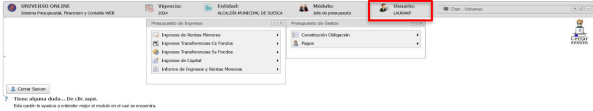
Figura 1. Sistema presupuestal UNIVERSO ONLINE- Modulo JEFE DE PRESUPUESTO

Pantallazo del módulo jefe de presupuesto del software Universo Online.