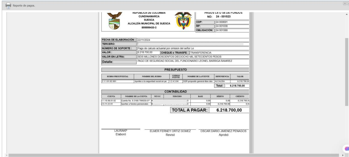
Figura 7. Ejemplo de PAGOS/EGRESOS

Pantallazo de “Egreso” del software Universo Online.