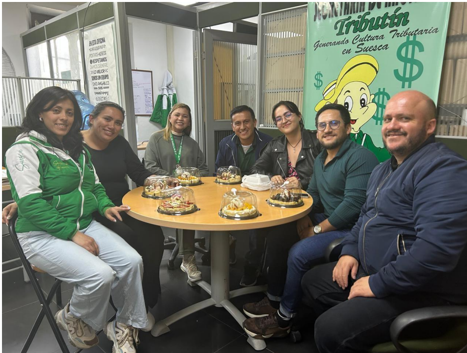
Figura 14. Equipo de trabajo

Nota. Fotografía tomada por Catherine Melo, Secretaria de Unidad de Desarrollo Agropecuario del Municipio de Suesca (2025). Usada con permiso.