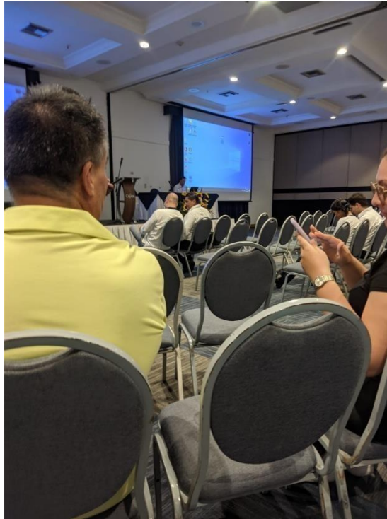
Ilustración 9 Encuentros para el rendimiento de ventas de fin de semana y cumplimiento de objetivos semanales.