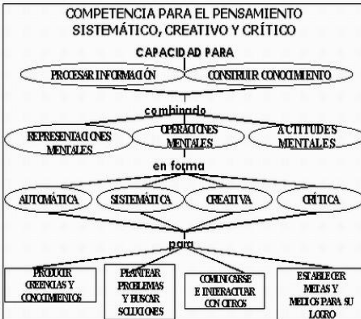
Figura 1. Competencia para el pensamiento sistemático, creativo y crítico.

pensamiento reflexivo crítico, elementos del pensamiento, modelo de pensamiento, niveles de pensamiento, modelo de pensamiento crítico.