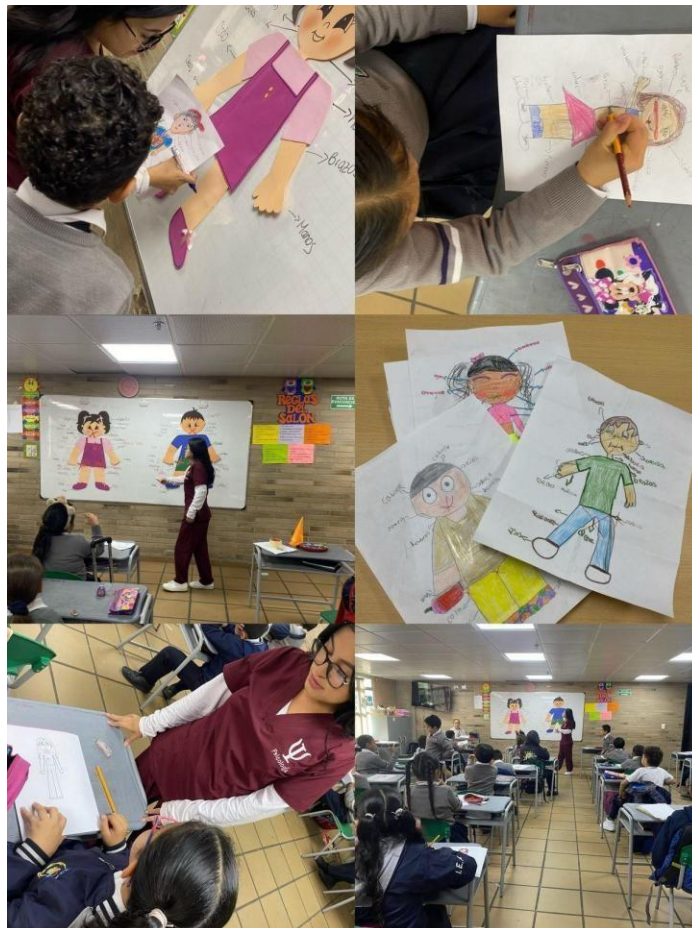
Fotografías de la 1 sesión