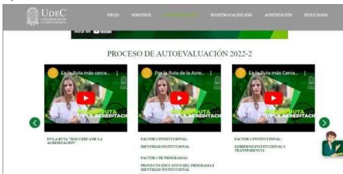
Figura 2. Socialización ruta hacia la acreditación