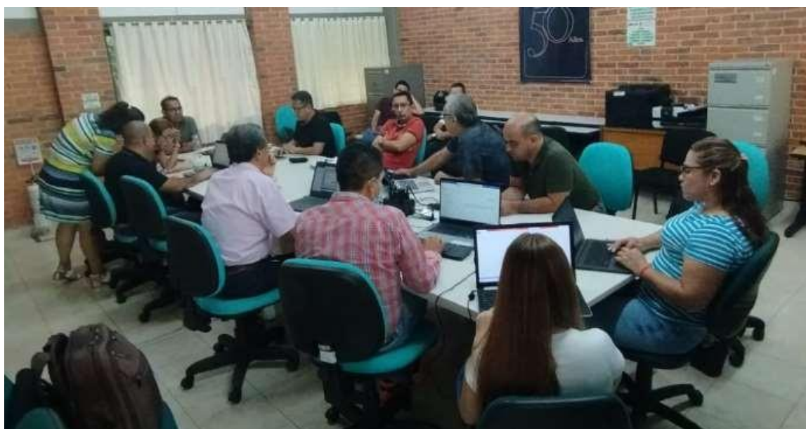
Figura 4. Evidencia comité curricular 19 de octubre 2022

que tienen relevancia y son de gran importancia para el programa, como pendientes de autoevaluación, seguimiento de objetivos entablados a corto y mediano plazo de las diferentes áreas o dependencias. En ellas se fijan estrategias y herramientas para cumplir estos objetivos. Todo esto con el fin de que el programa de la seccional cumpla con todos los requerimientos y metas planteadas por los mandos administrativos y objetivos del gobierno. En estas reuniones se levantan actas en las cuales describe, cita y menciona lo antes escrito. Finalmente se deben subir a la nube de OneDrive en una carpeta asignada que lleva por nombre Actas Autoevaluación – Currículo 2022- 2.