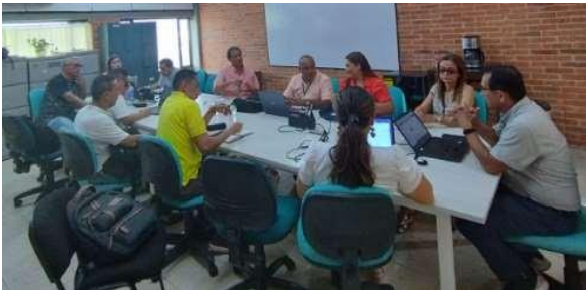
Figura 5. Evidencia comité curricular 9 de noviembre 2022