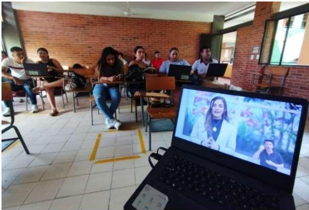
Figura 3. Proceso de socialización Ruta hacia la acreditación.

Se muestra evidencia fotográfica del proceso, haciendo la socialización de la Ruta más Cerca a la Acreditación.