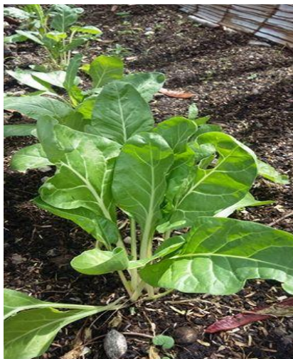
Ilustración 3. Planta de acelga