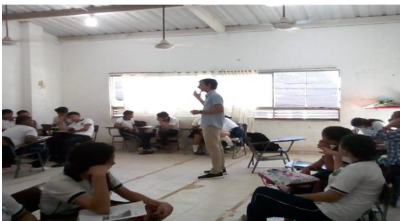
Ilustración 4. Evidencia en el aula

Se desea que los estudiantes interactúen más con los conocimientos teóricos y los plasmen en el componente práctico, reconociendo las herramientas y elementos que permiten la realización de una huerta, además de ofrecer conocimiento sobre los alimentos saludables que mejoran nuestra salud y bienestar.