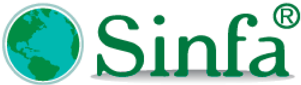
Ilustración 2: Logo SINFA