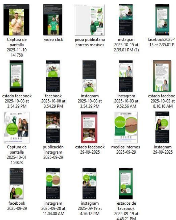
FIGURA 5 SEGUIMIENTO A LAS PUBLICACIONES