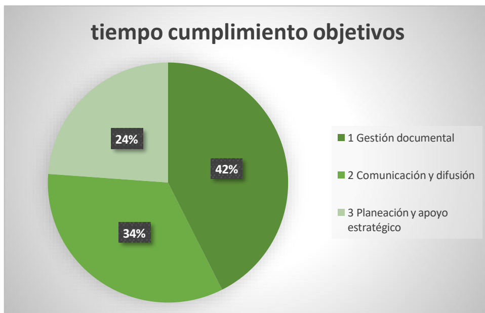
GRÁFICA 4. TIEMPO INVERTIDO PARA CUMPLIR CON EL OBJETIVO GENERAL DE LA PASANTÍA