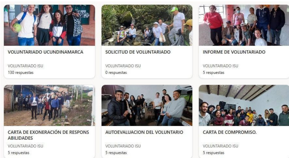
FIGURA 4 FROMS EN LINEA.

Este objetivo totalizó 114 horas , lo que representa el 34% del tiempo global de la pasantía.