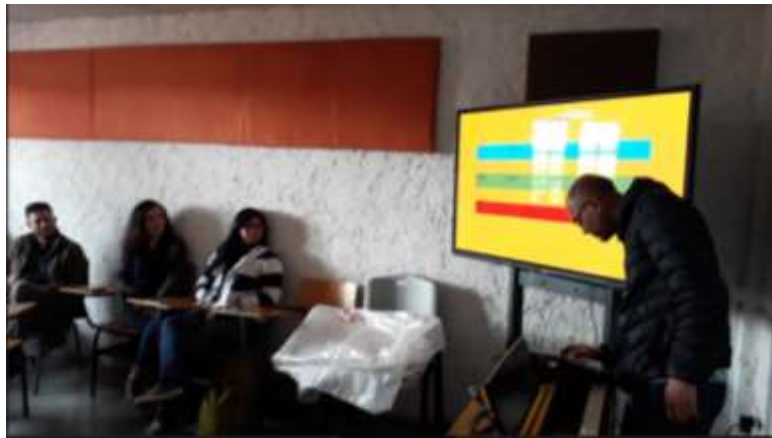
Fotografía 1. Registro visual sesión del proyecto de conciencia auditiva.

Nota: La tabla 5 muestra los resultados de un ejercicio de intervalos donde la línea amarilla muestra la cantidad de intervalos, la azul son las respuestas, los cuadros verdes son aciertos y los blancos los desaciertos; La tabulación y registro de los ejercicios de audición permite determinar muchas de las dificultades de los estudiantes a la hora de realizar ejercicios, sin embargo, son muchos los datos y variables que no se exploraron y que pueden representar objeto de análisis para identificar y concluir más detalles sobre esta información recopilada.