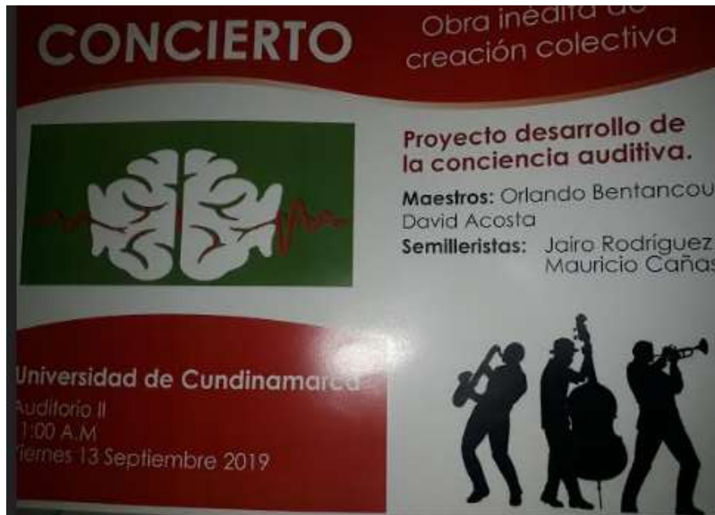
Fotografía 3. Flyer del concierto del proyecto de conciencia auditiva.