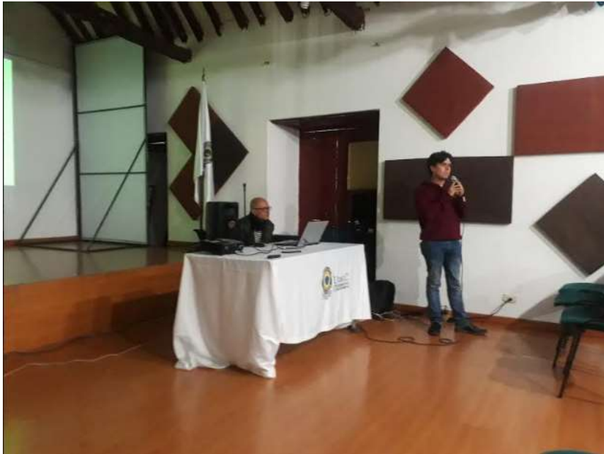
Fotografía 2. Registro visual de la II jornada de investigación musical Udec.

El anterior es un registro fotográfico de una de las sesiones en las que se expuso la forma básica del blues y se realizó un ejercicio de improvisación sobre esta forma, en el desarrollo del proyecto se terminó cumpliendo con 23 sesiones con gran variedad de actividades todas enfocadas al desarrollo de la conciencia auditiva.