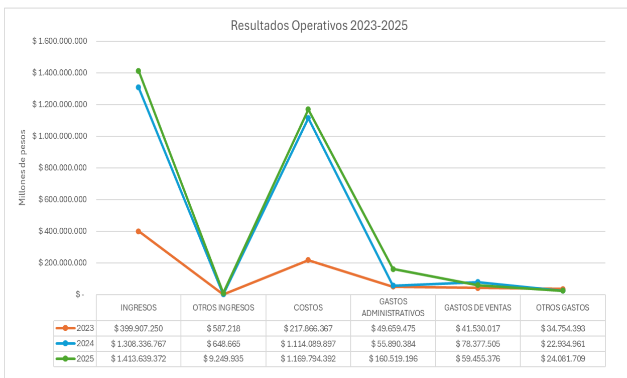
Ilustración 13 Tomado de creación propia