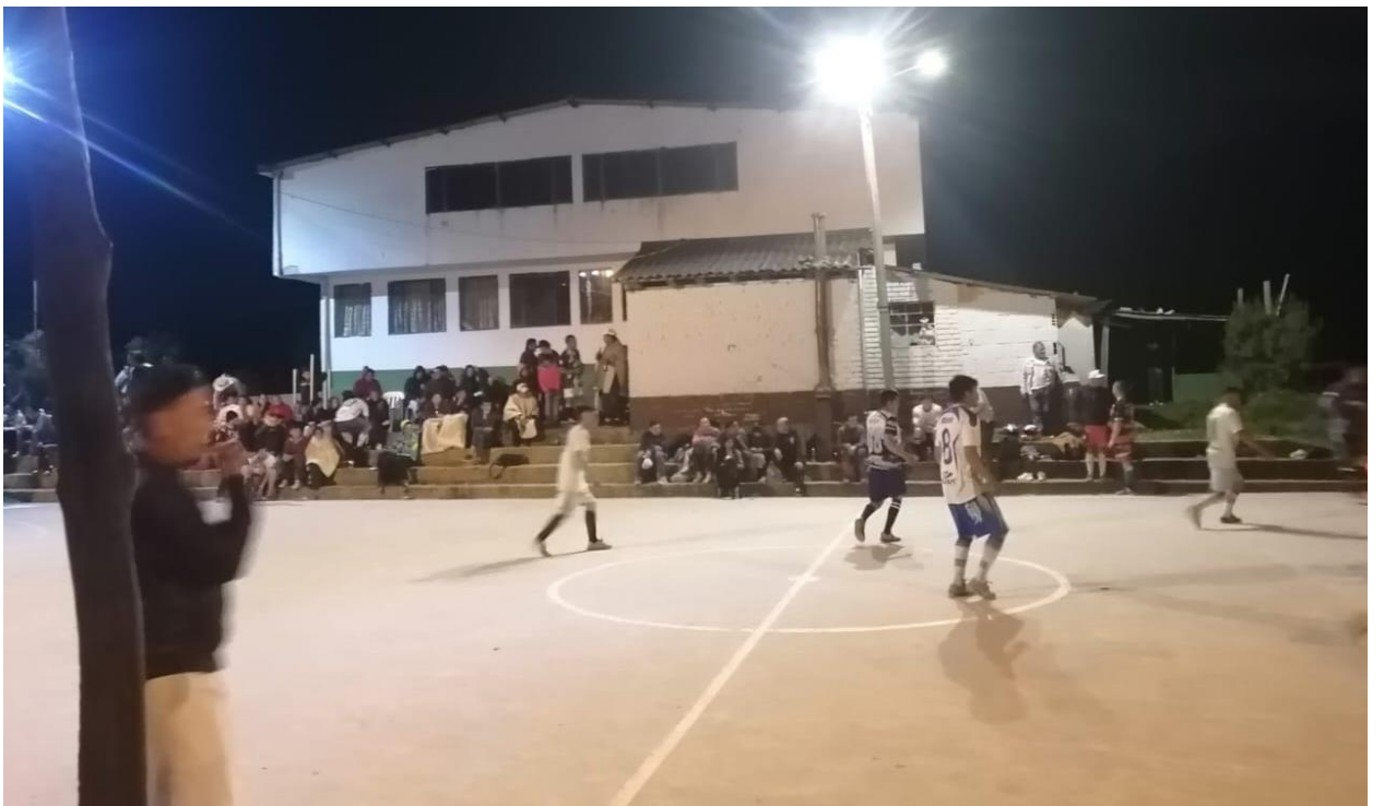
Ilustración 30, torneo nocturno 2023