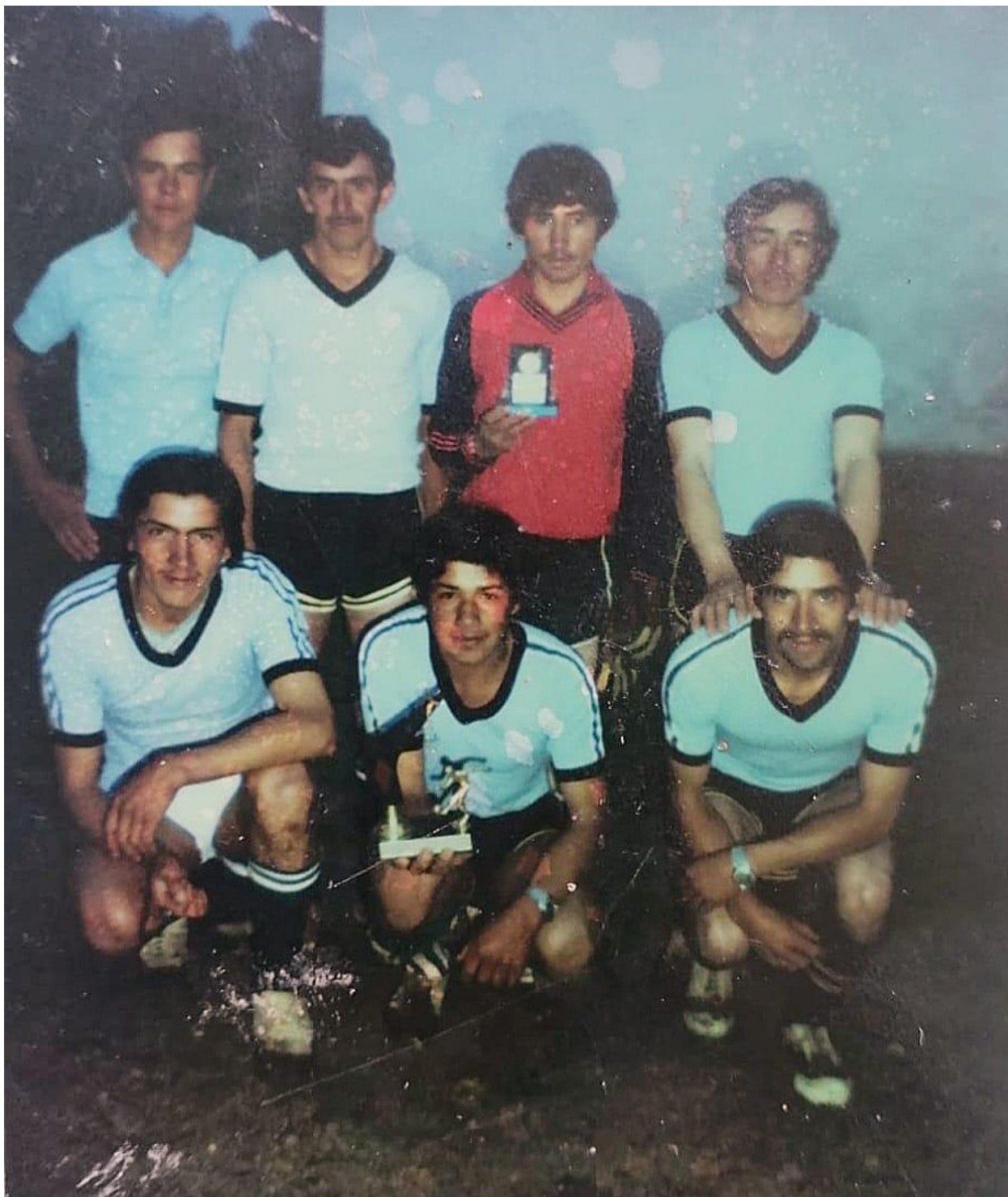
Ilustración 10, equipo campeón del primer campeonato en Noruega Alta, se jugaba sobre cancha de tierra, 1983