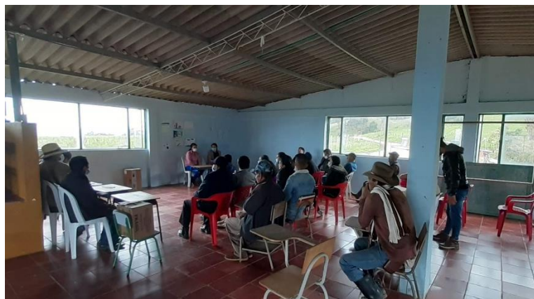
Ilustración 4, elecciones de directivos para el nuevo periodo JAC, noviembre 28, 2021

Después de más de un año espera, para noviembre del año 2021 la vacunación contra el Covid 19 avanzaba en el país, ahora las personas se podrían reunir nuevamente, aunque con moderación. Ese mismo mes hubo cambio de directivos y actualización de inscritos en las Juntas de Acción Comunal de todo el país. Así que se convocó a asamblea el domingo 28 de noviembre en el segundo piso de la escuela, allí funciona el salón comunal, el miedo existía y aún algunos se negaban a abandonar el uso de tapabocas como se aprecia en la ilustración 3 . Hubo postulaciones para nuevos cargos en la junta y se desarrolló la elección de directivos (presidente, vicepresidente, secretario, tesorero, fiscal, vocales y coordinadores de trabajo, salud y deportes). Yo quedé en el