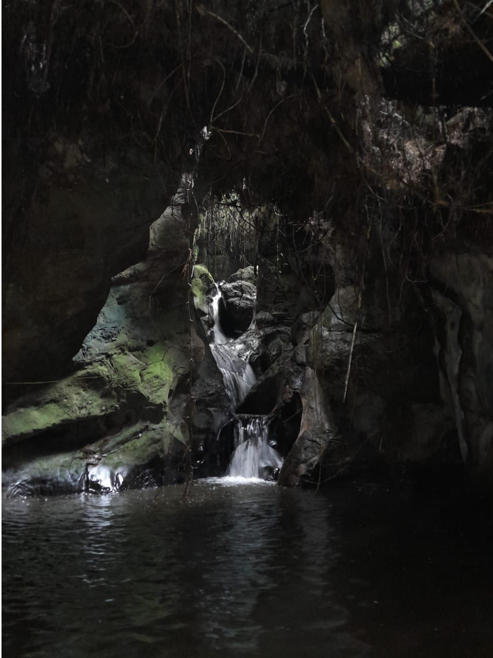
Ilustración 15, Quebrada Chiquinquirá, principal afluente de Noruega Alta