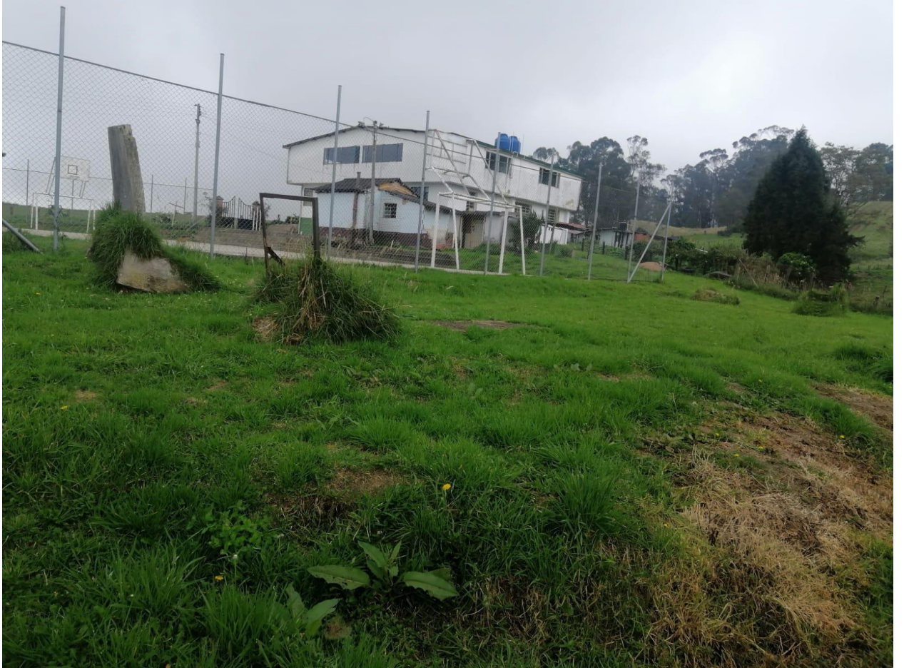
Ilustración 18, contraste entre las canchas de tejo que fueron abandonadas junto a la cancha de microfútbol que continúa activa, un contraste entre deportes rurales