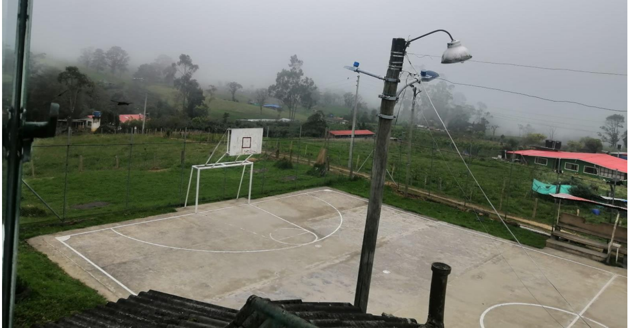
Ilustración 19, perspectiva desde el salón comunal, segundo piso de la escuela