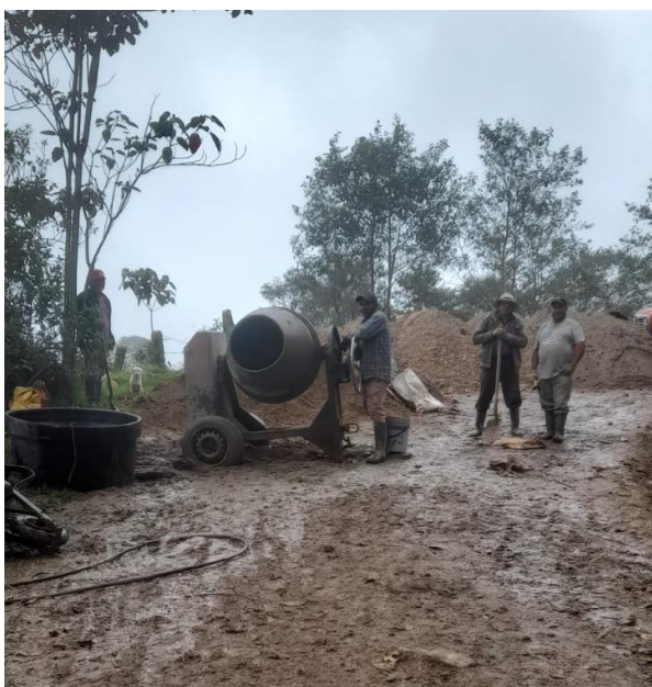
Ilustración 8, inicio de la obra de las cintas viales en el sector de los Castellanos

El balance fue positivo, la actividad dejó millón ochocientos mil pesos de ganancias, ahora la comunidad estaba preparada para recibir a las volquetas que traerían el material para las cintas viales que se construirían cerca a los Castellanos. Por esos días yo me encontraba cursando noveno semestre de la licenciatura y estaba en Fusagasugá, me agregaron a un grupo de WhatsApp con todos los miembros de la JAC y observaba las conversaciones como también los reportes y fotografías sobre lo que ocurría en la comunidad y la vereda. A inicios de abril se dio inicio a la obra que duró cerca de una semana, se alquiló el trompo que mezcla el cemento, se contrató un maestro de obra y se pagaron combustibles, aproximadamente 20 hombres de la comunidad en