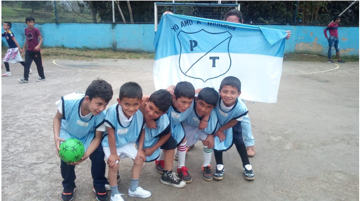
Ilustración 7, niños de la escuela de Noruega jugando micro en el colegio de Subia