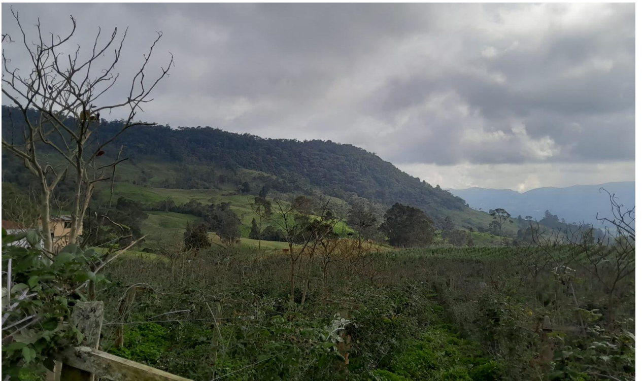
Ilustración 20, paisaje suroriental de la vereda