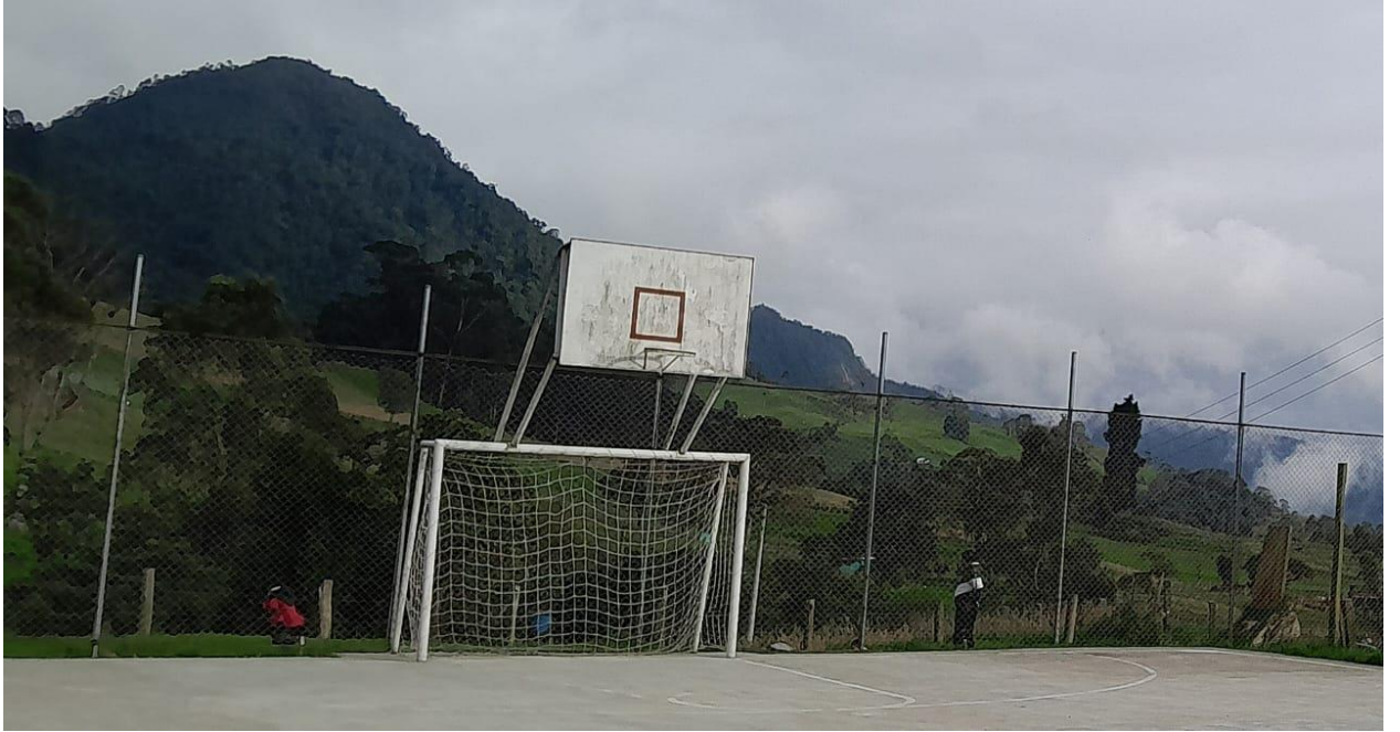
Ilustración 33, una placa de cemento en medio de las montañas