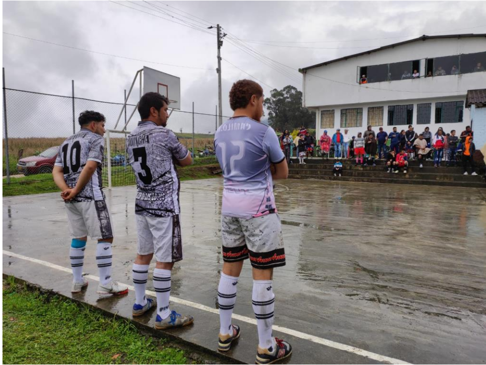
Ilustración 4, marzo, 2022