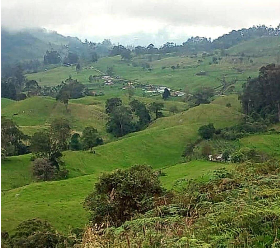
Ilustración 36, pequeño vecindario entre montañas