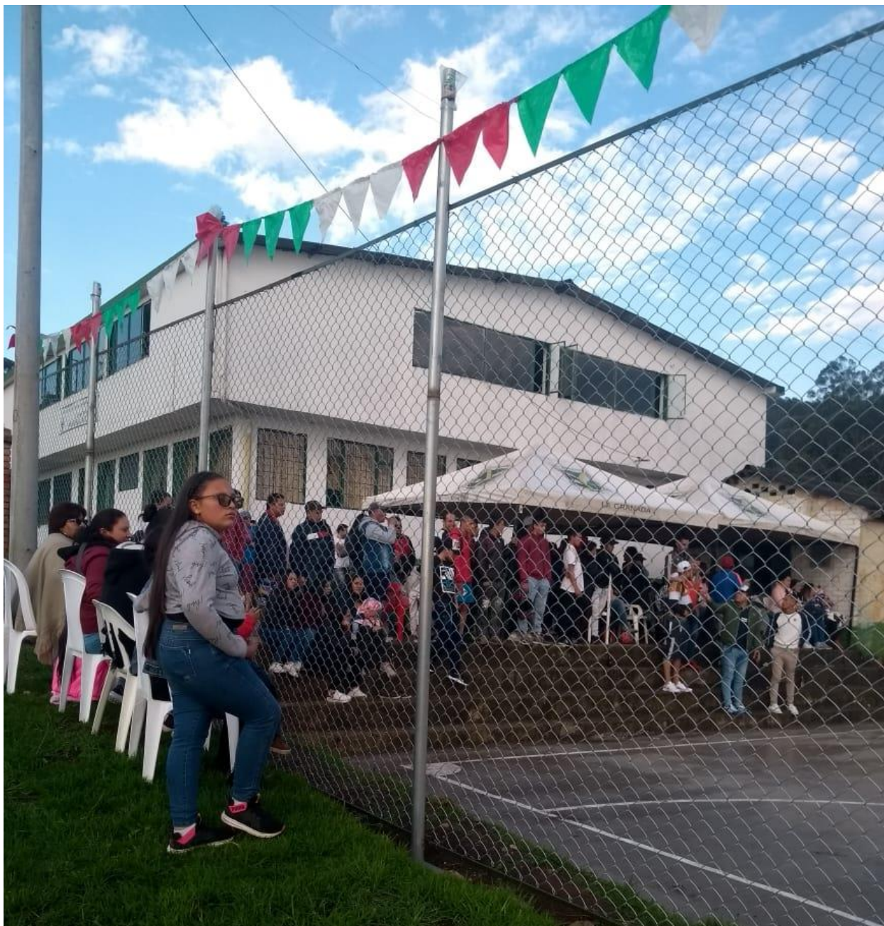
Ilustración 6, campeonato interrumpido por la llegada del Covid 19, 2020