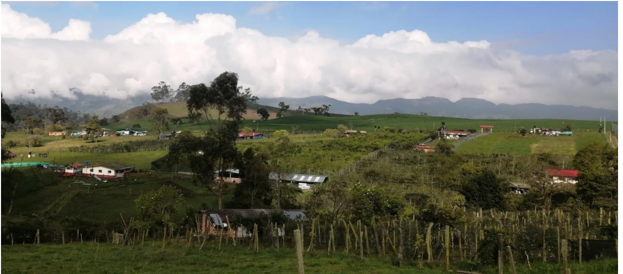
Ilustración 15, vecindario principal de Noruega Alta

En primera medida, resalta el valor dado por los habitantes al espacio naturalmente concebido más que al espacio socialmente construido. Al hablar de la vereda, es posible percibir en varios de los pobladores, un tipo de evocación que denota admiración casi que romántica, podría decirse, acerca del espacio natural en que se ubica la vereda, ya que es difícil que escaseen recursos vitales tales como el agua y a pesar de ser un clima frío, no llega a experimentar las heladas que dañan pastos y cultivos, es un espacio alejado de catástrofes naturales, como derrumbes y crecientes súbitas que ponen en riesgo la vida de los pobladores.