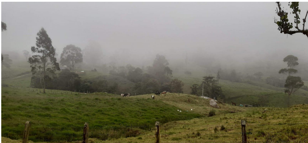
Ilustración 24, paisaje suroriental de Noruega