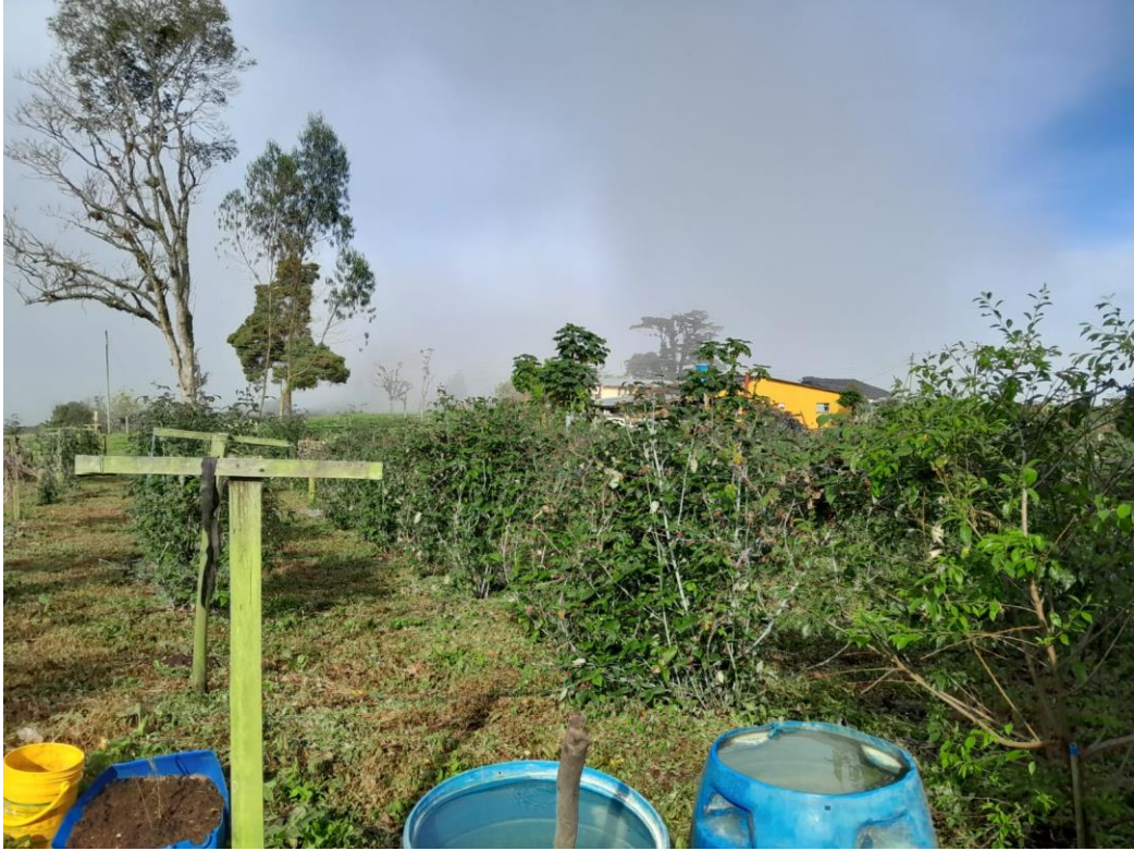
Ilustración 13, Cultivo de Mora