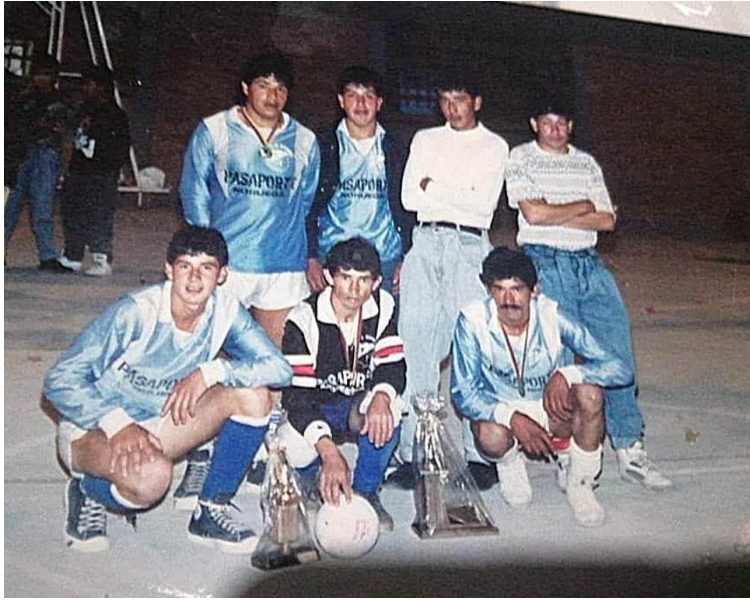
Ilustración 13, equipo Pasaporte, representante de Noruega y subcampeón en Sylvania, 1989

Muchos más jóvenes comenzaron a participar de los partidos en Noruega, había varios equipos, los cuales reunían a familiares y amigos de la vereda, el más popular era el equipo “Pasaporte”, el cual fue nombrado así por los hermanos Morales, quienes también jugaban allí, y