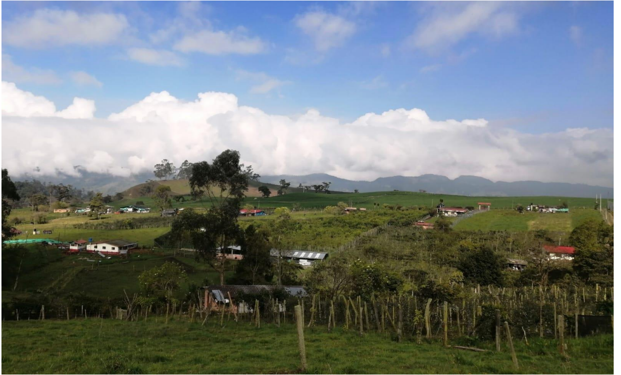
Ilustración 39, vecindario principal