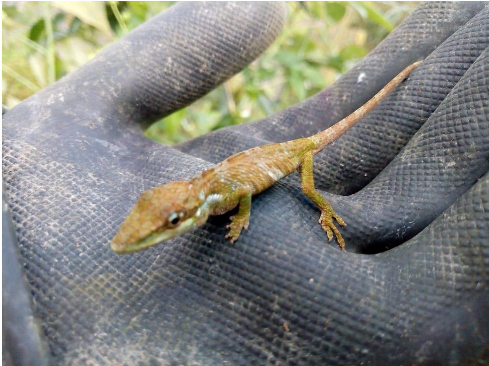
Ilustración 12, fauna de Noruega