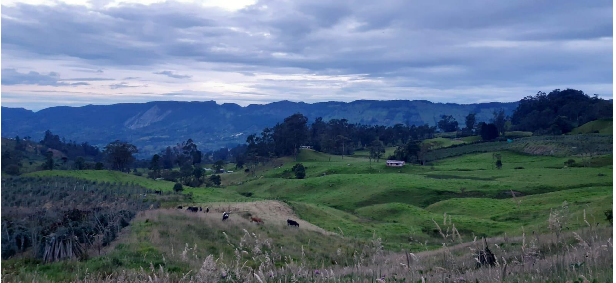
Ilustración 16 , vista hacia el suroccidente desde Noruega Alta