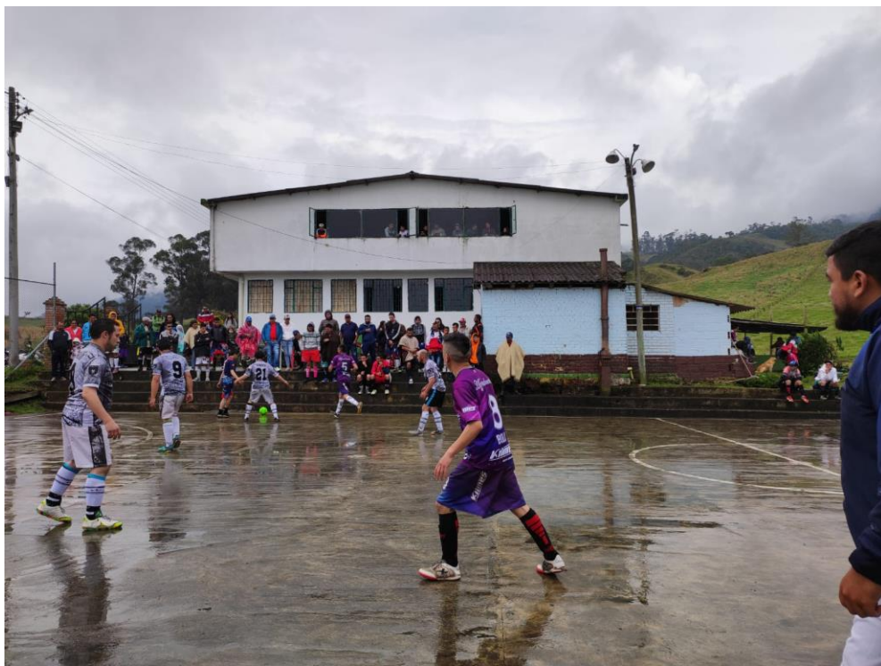
Ilustración 5 Marzo, 2022