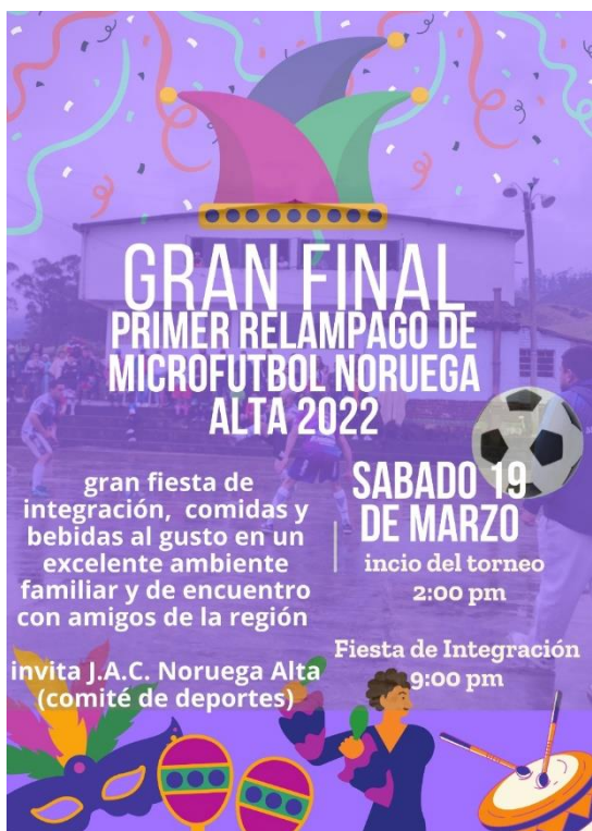
Ilustración 7, invitación para la gran final del campeonato

Ese día asistieron personas de Noruega y otras veredas, las cuales domingos de microfútbol anteriores no habían asistido, también acudieron a la escuela hombres y mujeres que en tiempos anteriores se fueron a vivir, estudiar o trabajar a Bogotá o Fusagasugá principalmente, llevaban tiempo sin ir a la vereda, sin embargo, allí aún conservan importantes lazos de amistad y familia, ellos llegaron para la fiesta y el encuentro, obedeciendo en razón de los Flyers que se difundieron días anteriores por redes sociales ( ver ilustración 7 ). Es evidente que no iban a apoyar a