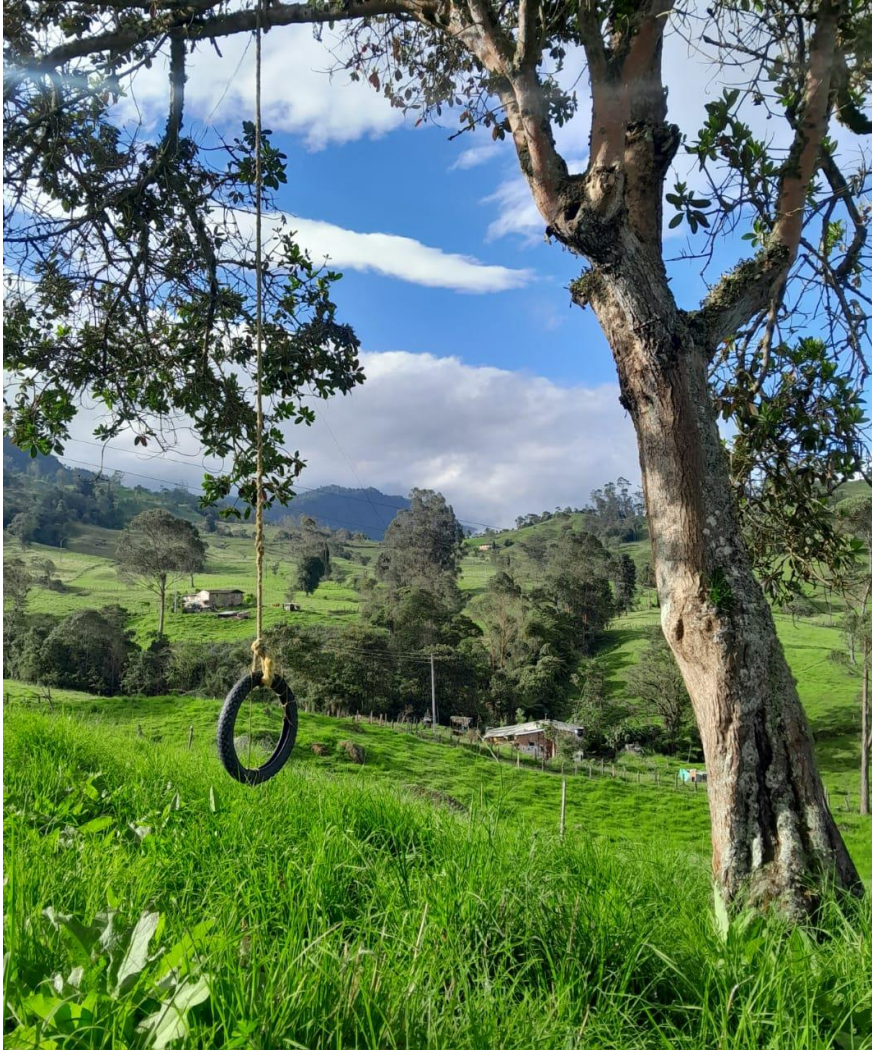
Ilustración 34 columpio en una finca de Noruega