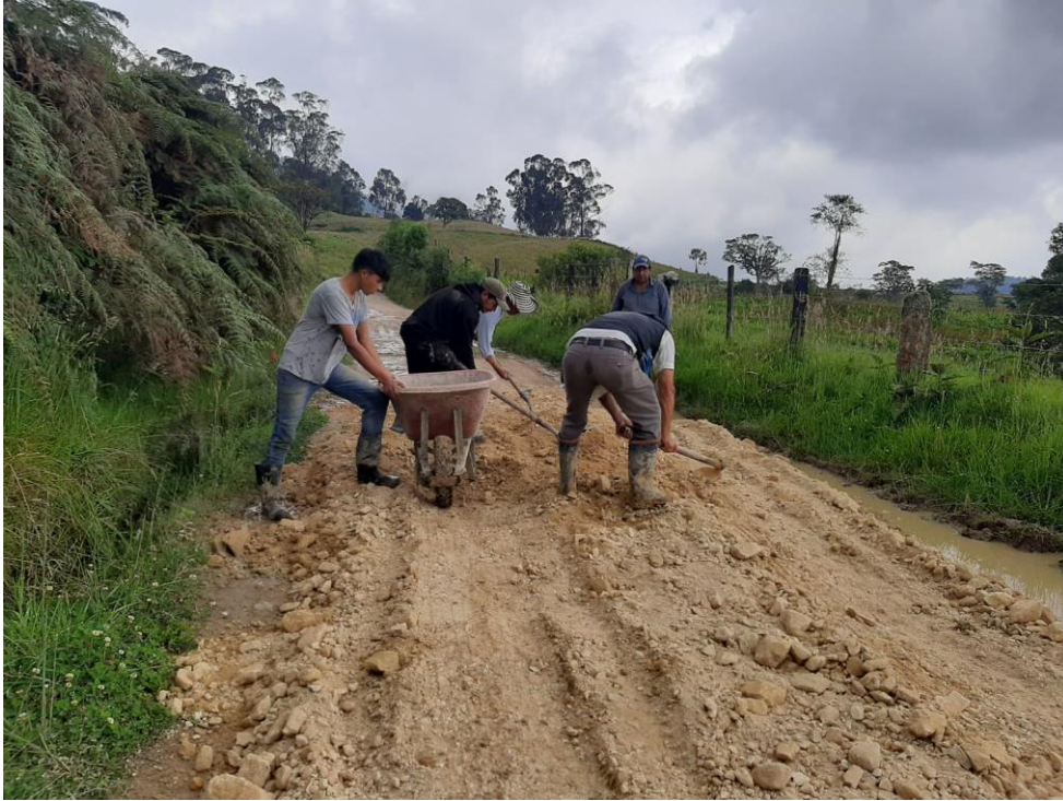
Ilustración 16, Jornada de trabajo y arreglo de vías, 2023