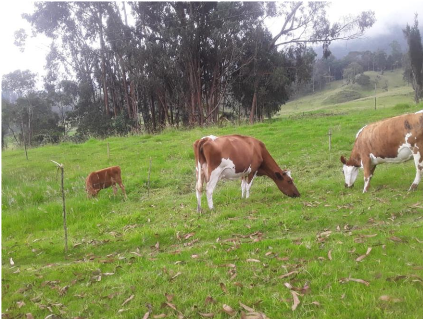
Ilustración 14, ganado de Noruega