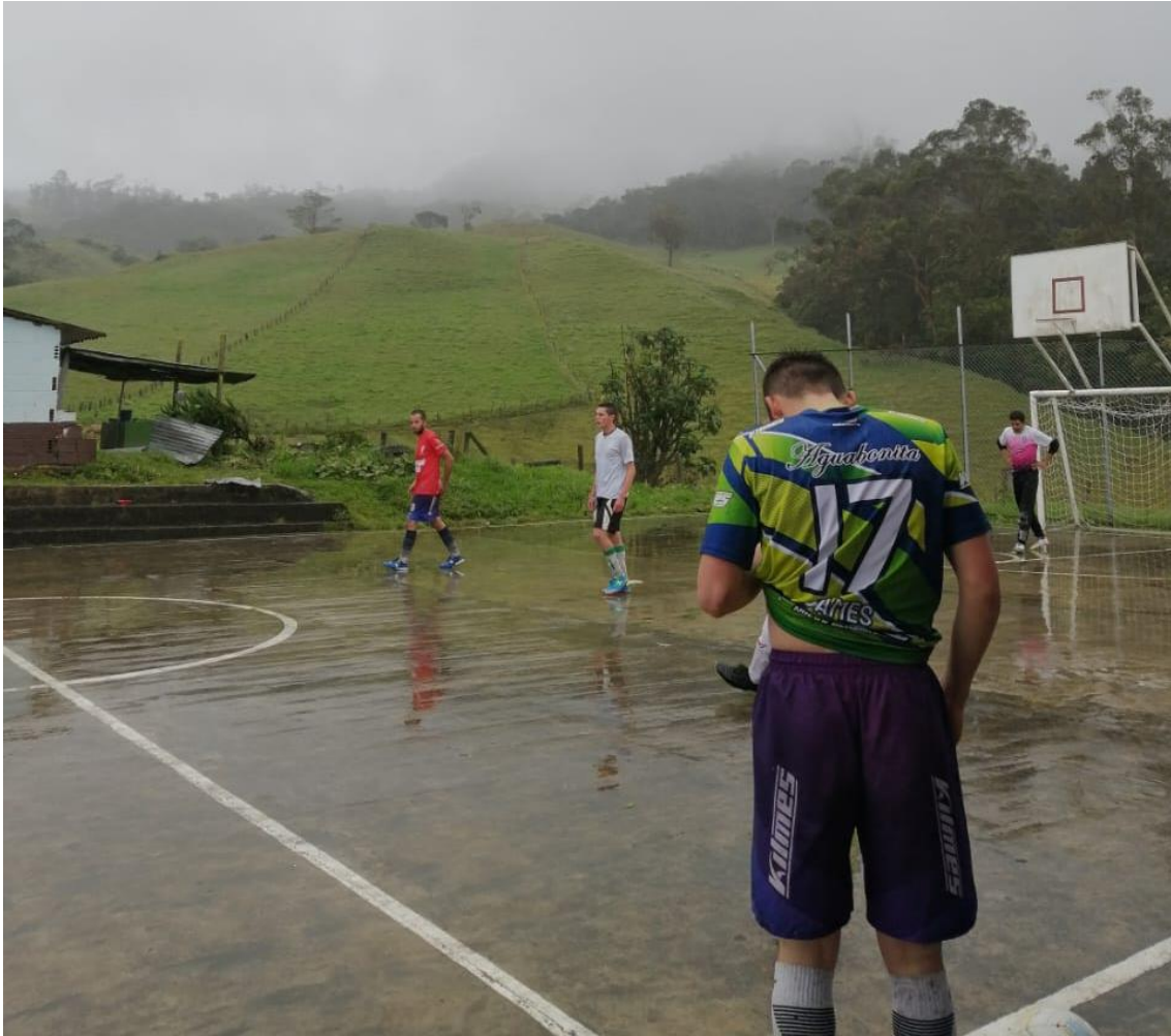
Ilustración 26, jugando micro bajo el frio y la lluvia, torneo 2022