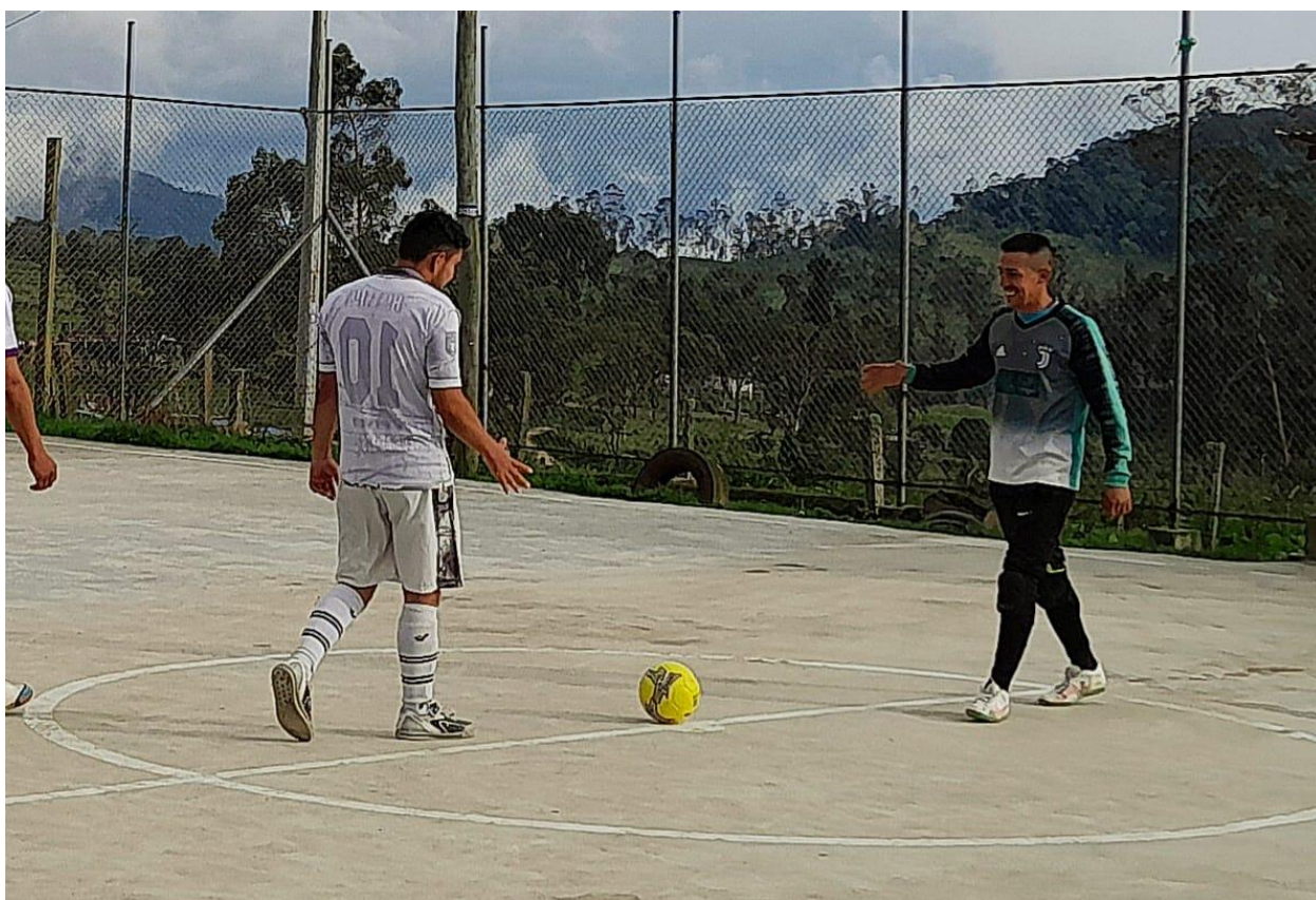
Ilustración 32, capitanes de cada equipo, de fondo se aprecian las montañas