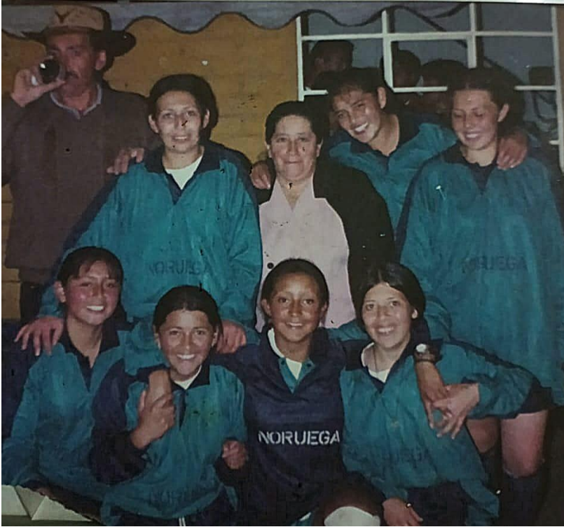
Ilustración 17, primer equipo femenino de microfútbol en la vereda (año 2002)

Así, se puede decir que todos los habitantes de la vereda han tenido alguna relación con el microfútbol, incluso aquellos quienes no lo practican, ya que asisten como espectadores y