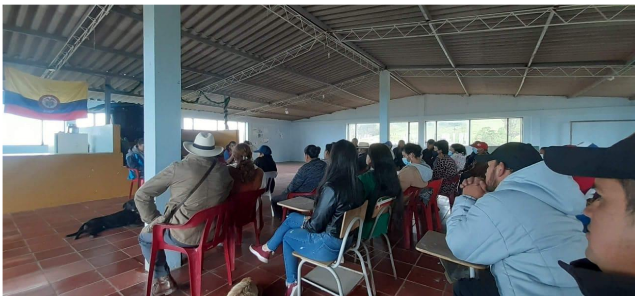
Ilustración 25, Asamblea comunal, 2022