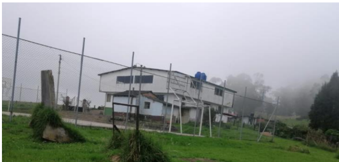
Ilustración 2. canchas de tejo abandonadas en la escuela de la vereda

Afuera, dentro del mismo lote, existen escaleras que conducen al polideportivo, estas mismas funcionan como graderías, también hay zonas verdes para la huerta escolar, y en una zona del lote se encuentran dos canchas de tejo abandonadas, las cuales fueron construidas por la comunidad hace más de 12 años para hacer sincrónicamente campeonatos de tejo y microfútbol, con fines de autogestión comunal.