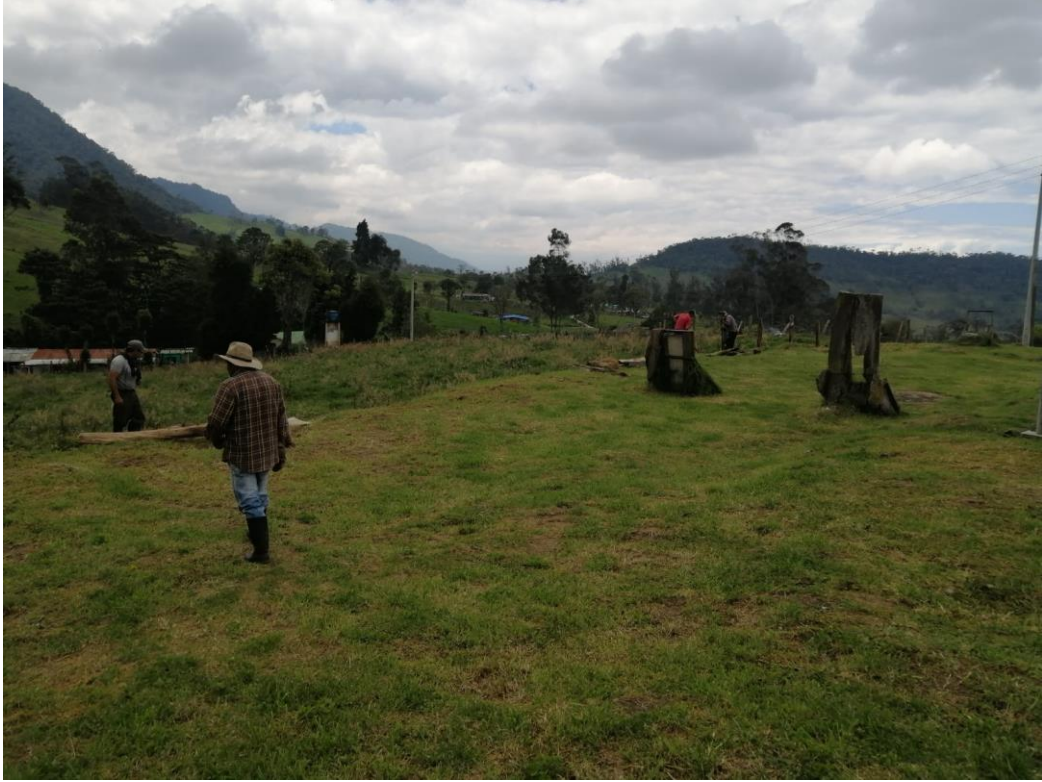
Ilustración 11, padres de familia cercando la escuela, se aprecia el paisaje y las canchas de tejo abandonadas