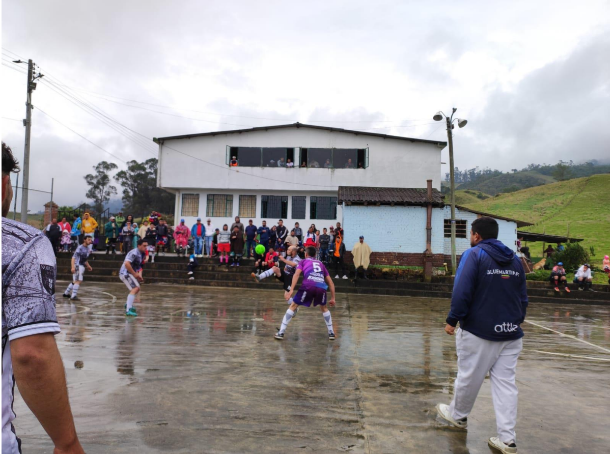
Ilustración 3, primer campeonato de micro, marzo 2022