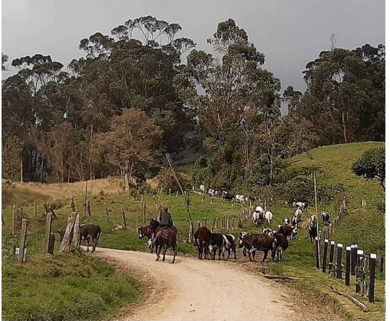
Ilustración 21, Los empleados de los Ochoa movilizando el ganado