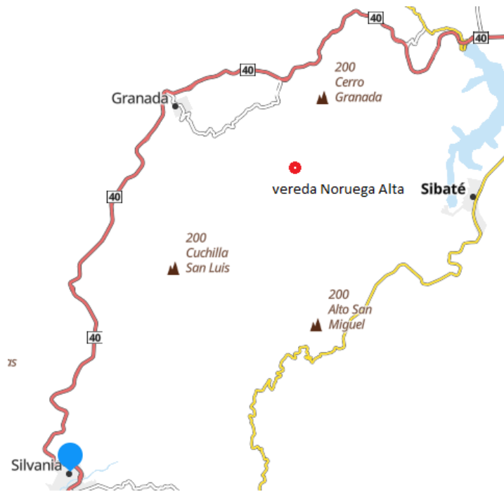
Ilustración 11, fotografía editada de "rutas Michelin"

e insumos necesarios para la vida en el campo. La comunidad muchas veces ha manifestado la falta de apoyo por parte de municipio encargado (Silvania) y el deseo de pertenecer legalmente a Granada, ya que esta antigua inspección que perteneció a Soacha a lo largo del siglo XX, consiguió autonomía territorial y fue declarada legalmente como Municipio en el Año 1995.