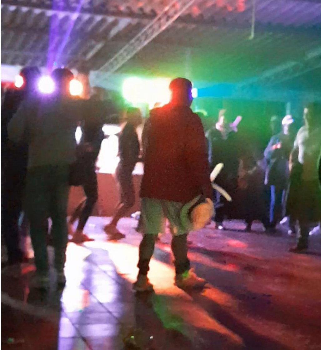
Ilustración 22, celebración de la final del campeonato de micro en el salón comunal, año 2023