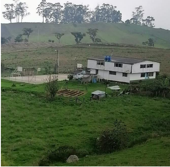
Ilustración 1, escuela de Noruega Alta

El segundo piso, se construyó hace aproximadamente 18 años por parte de la comunidad para funcionar como salón comunal, en él hay una pequeña tarima, mesones que dividen el espacio para desarrollar actividades tales como ventas y un equipo de sonido con bafles y micrófono, también ventanales que apuntan en todas direcciones, ofreciendo una gran vista de los valles y montañas que rodean la vereda y expresan parte del paisaje de la cordillera oriental.