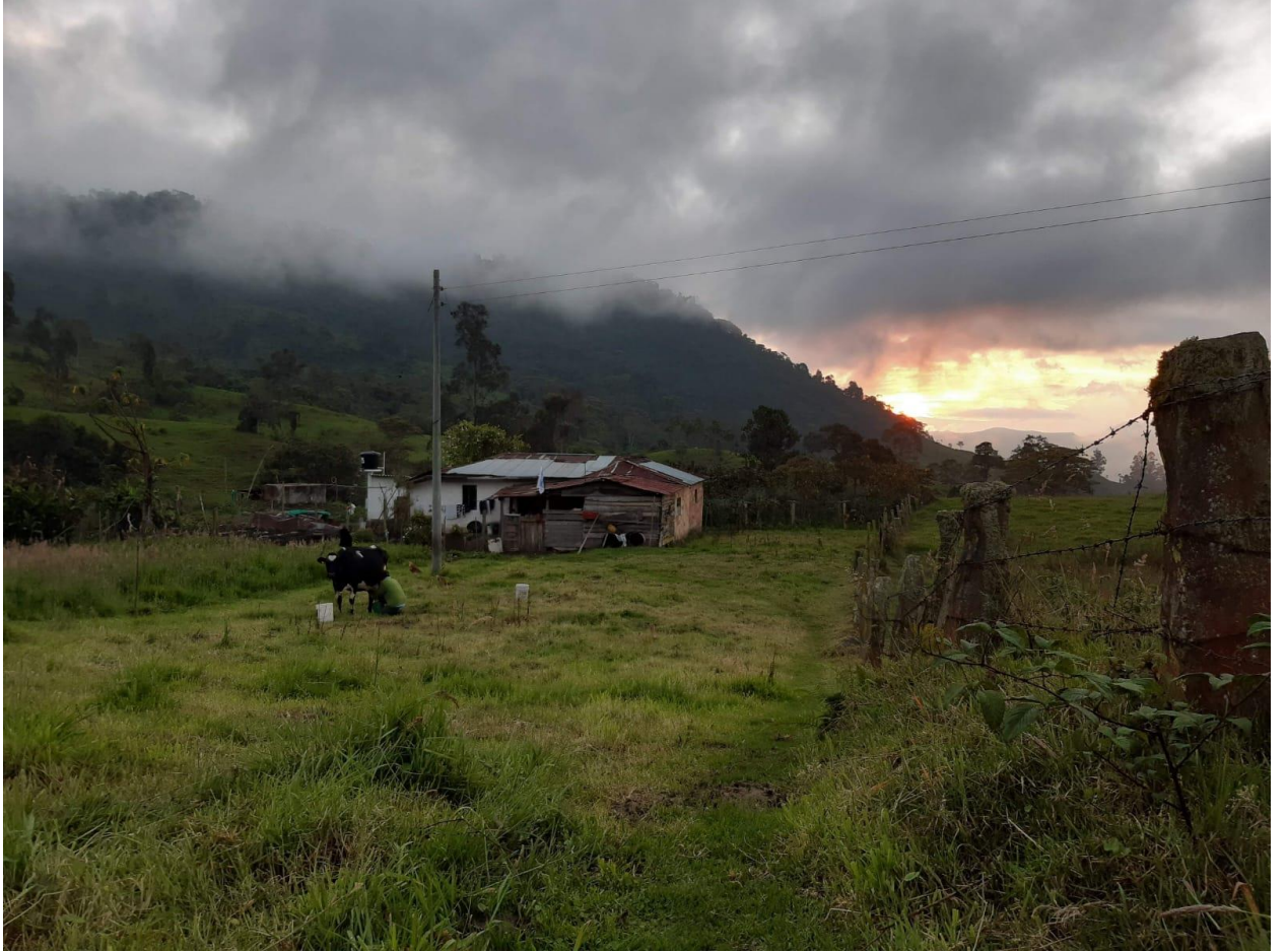
Ilustración 38, una pequeña finca de Noruega