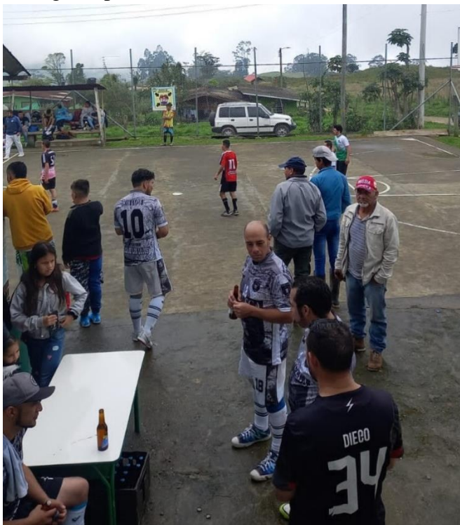
Ilustración 12, fotografía de un torneo de micro en Noruega Alta, pro-fondos para arreglo de vías (marzo 6, 2022)

En este sentido, en la vereda los torneos de microfútbol como evento deportivo, expresan los procesos de organización y participación comunal de la población, y tienen como propósito la integración social y la autogestión