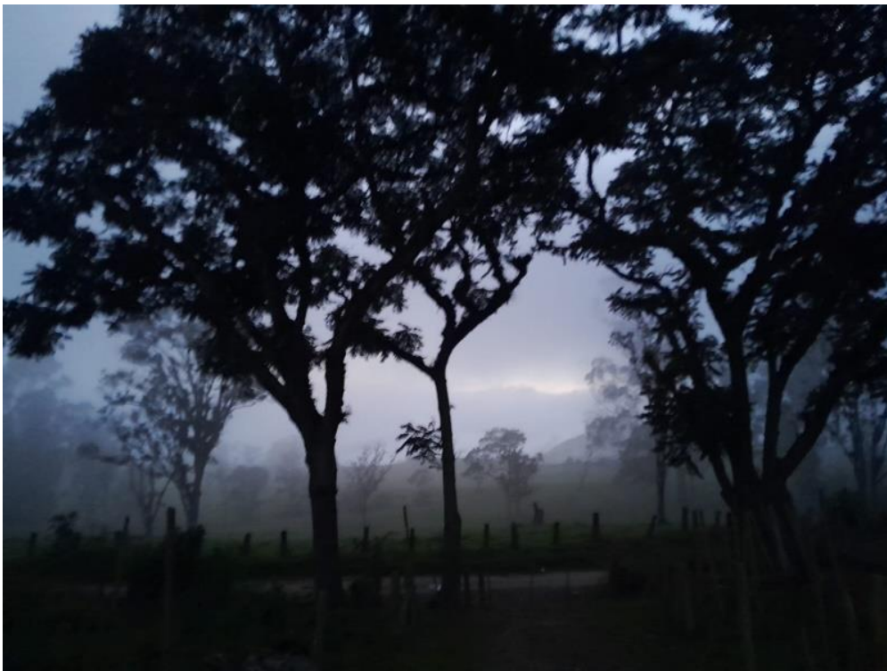
Ilustración 17, atardecer nublado en Noruega Alta