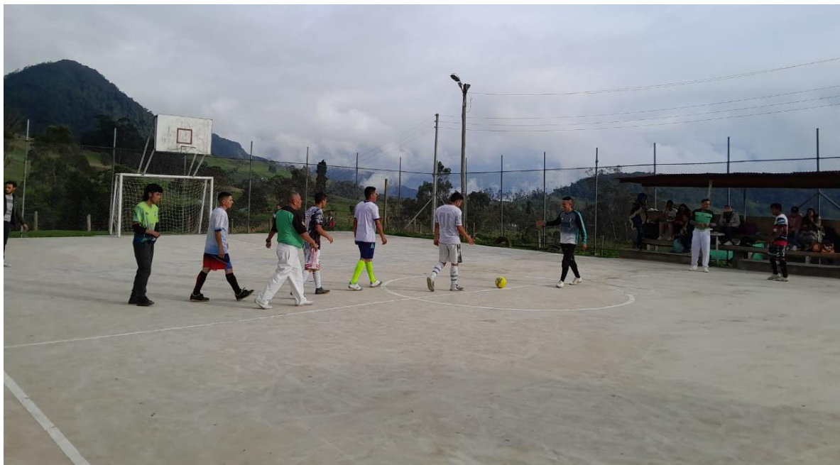
Ilustración 31, los equipos se saludan antes de jugar, 2023