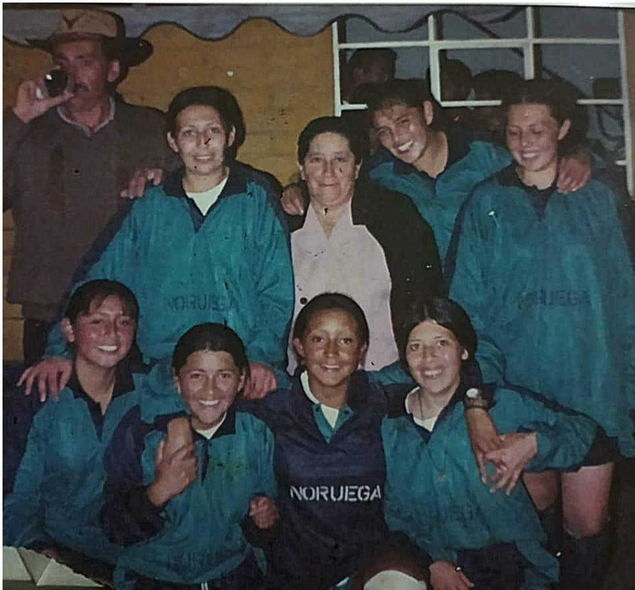
Ilustración 8, primer equipo femenino de microfútbol en la vereda, año 2002