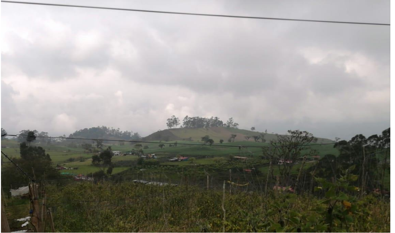
Ilustración 27, paisaje central del vecindario