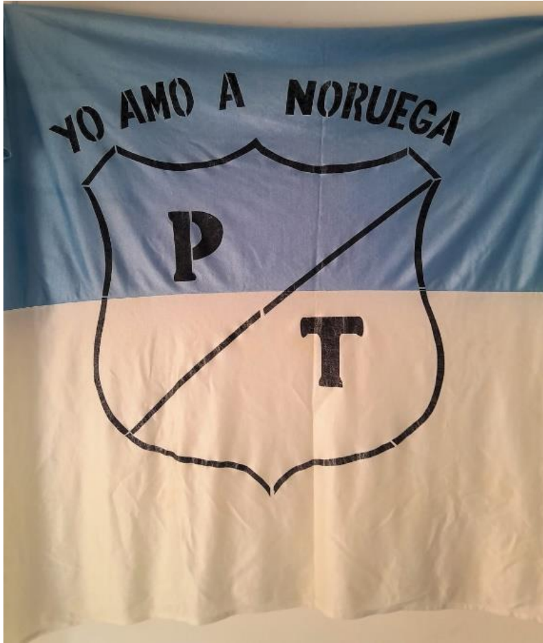
Ilustración 9, Bandera del equipo Pasaporte, 1989