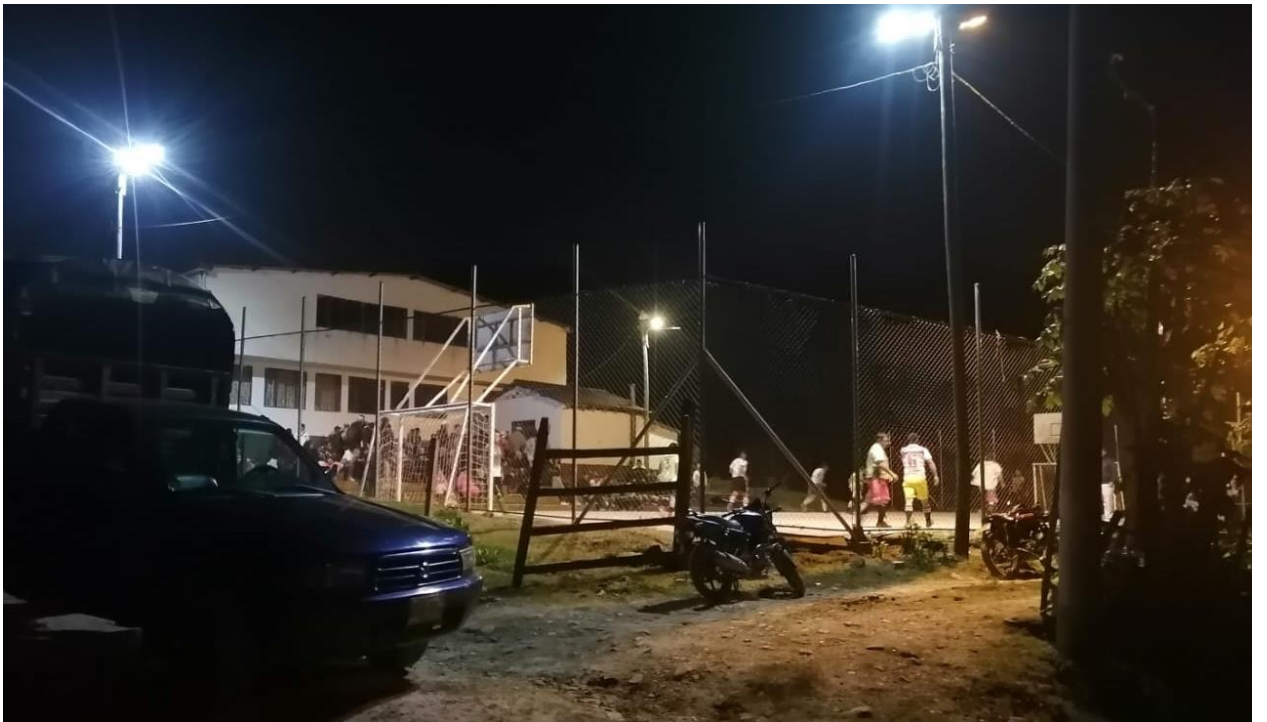
Ilustración 28, torneo nocturno 2023