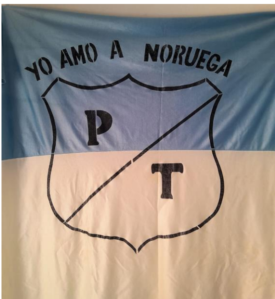
Ilustración 14. bandera del equipo Pasaporte, la cual era usada para alentar desde la tribuna

escuchaban y comentaban acerca de los partidos del fútbol colombiano (principalmente eran hinchas del América, Santa fe, Millonarios y Nacional).