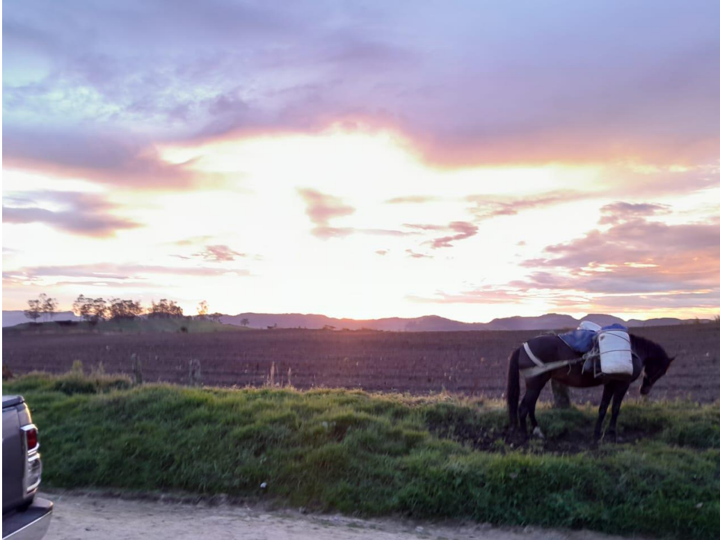
Ilustración 35, atardecer en Noruega, se aprecia un barbecho usado para la siembra de papa y un caballo cargado con cantinas de leche