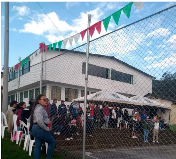
Ilustración 3, espectadores del torneo interrumpido por pandemia en marzo de 2020

Lamentablemente, tanto para la comunidad de Noruega Alta como para el mundo entero, el miércoles 25 de marzo en Colombia el COVID 19 colapsó el país, sabotando todo tipo de encuentros, hubo emergencia sanitaria y la gente no se volvió a reunir por meses, así