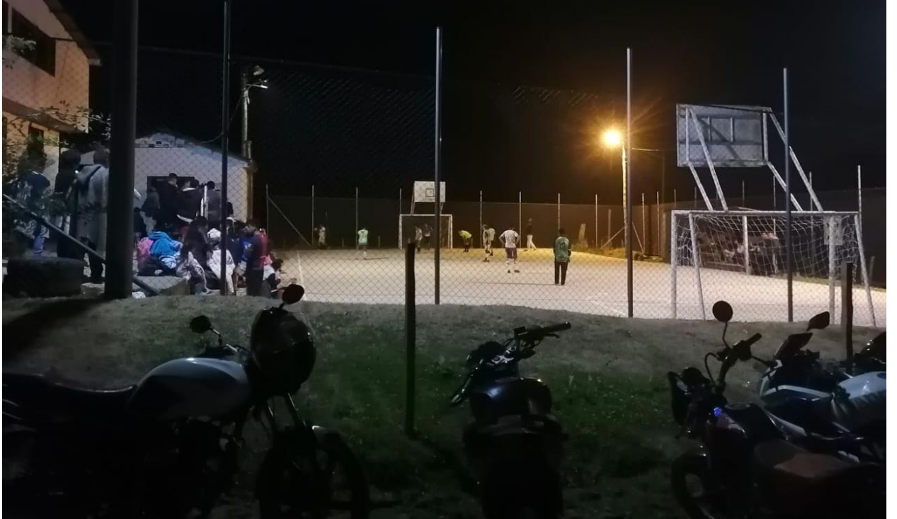
Ilustración 29, Torneo Nocturno 2023