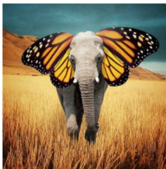
Ilustración 1 Ejemplo actividad inicial

Luego de aquel hechizo, el elefante había obtenido unas hermosas alas naranjas de mariposa en el lugar donde se encontrarían sus orejas y pudo escapar ileso de los humanos del planeta, quienes querían quitarle sus colmillos. En el cielo, el elefante mariposa agradeció barritando a la bruja marciana que volaba en su escoba.