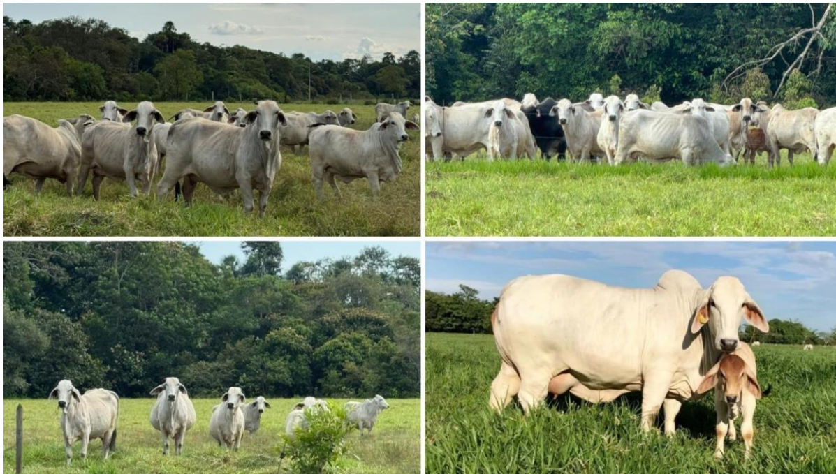
Ilustración 1. Ganado Brahman Gris, Ganadería de Apiay