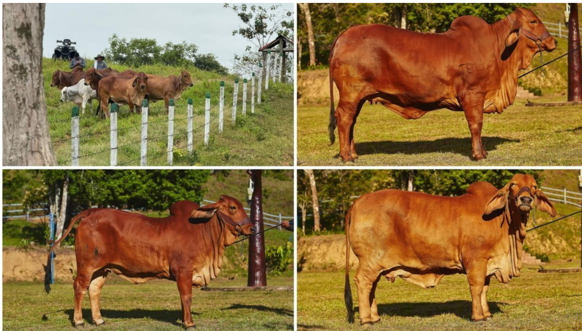
Ilustración 2. Ganado Brahman Rojo, Ganadería de Puerto López