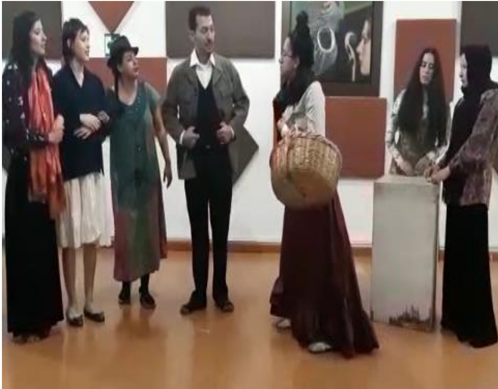
Primer Acto. Escena 2 “Llegada de Don Antonio”