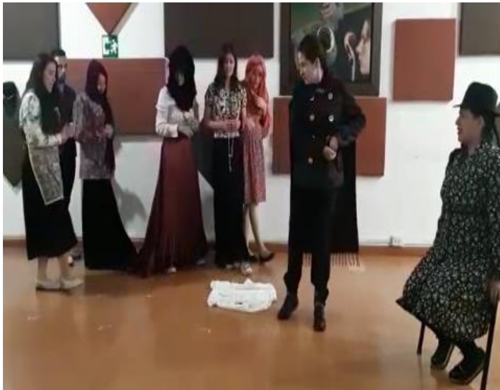
Primer acto. Escena 1 “Caos”