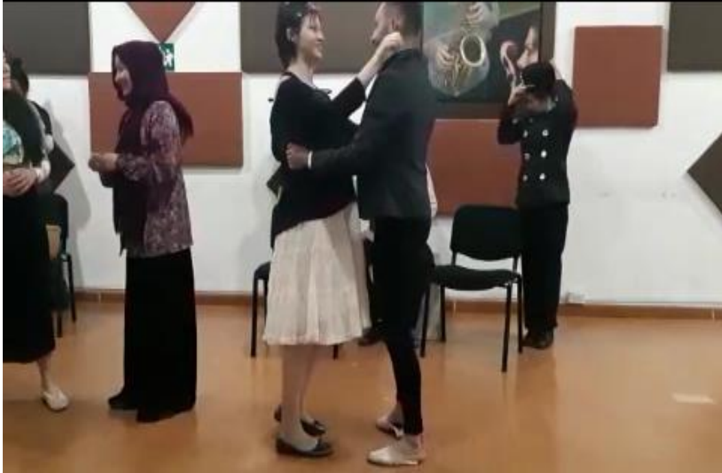
Segundo Acto. Cuadro tercero. Escena 1 “En la plaza”