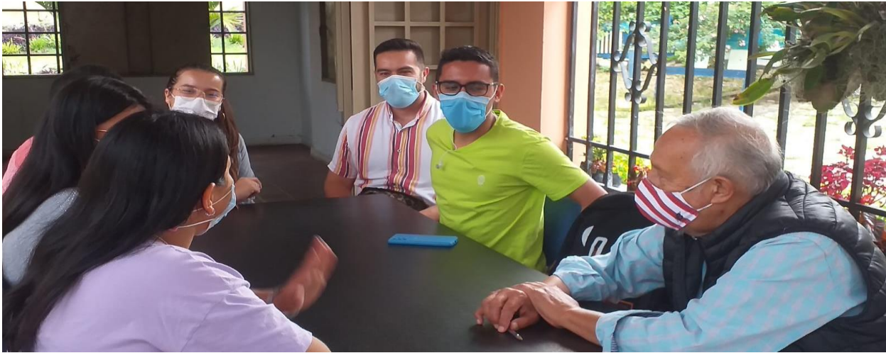
Nota. Construcción de las actividades a realizar en los comedores. Elaboración propia.