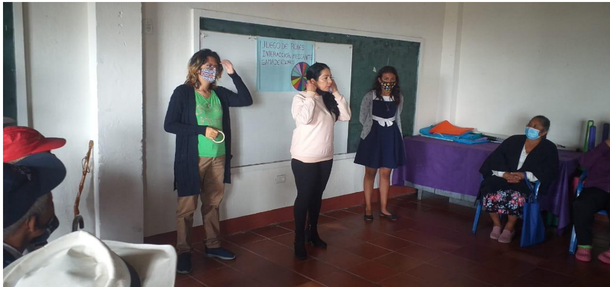
Nota. Implementación de la prueba diagnóstico con la comunidad. Elaboración propia.