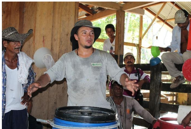
Grafico 8. Taller biofertilizante sencillo con boñiga de búfala

En el marco de plan de trabajo estipulado al inicio del trabajo se planificaron y proyectaron una serie de talleres que le permitan al campesino productor, tener herramientas al alcance de su finca, y que le permita realizar una transición tecnológica y pasar de insumos de síntesis química a productos orgánicos y biológicos, se presentan los futuros talleres a realizarse en las asambleas de socios.