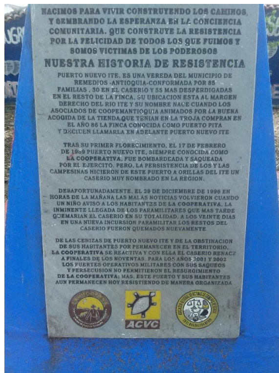
Grafico 2. Placa en memoria a los campesinos caídos por hostigamientos militares y paramilitares

considerado como zona roja por la presencia de: i) El Ejército de Liberación Nacional, ii) las Fuerzas Armadas Revolucionarias de Colombia, iii) Ejército Popular de Liberación, iv) Grupos paramilitares Autodefensas Unidas de Colombia AUC hoy águilas negras o Bacrim, y v) 6 batallones del Ejército Nacional, una presencia militar y armada muy fuerte para una zona geopolíticamente estratégica para la economía del país. Cabe resaltar que con el surgimiento de las AUC en el territorio se aumentó la violencia, hubo mayor cantidad de asesinatos selectivos a líderes sociales y se incrementó el desplazamiento forzado interno en la región.