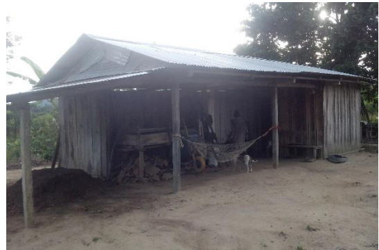
Grafico 10. Lugar Abono orgánico tipo bocashi

Formula: abono liquido biofertilizante sencillo.