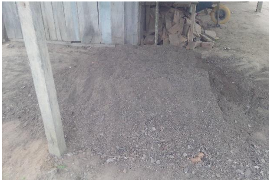
Grafico 9. Abono orgánico tipo bocashi