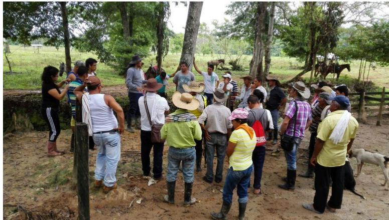
Grafico 6. Taller el suelo un sistema vivo

convertirá nuevamente en minerales para ser consumidos por otras plantas, Los sistemas agroalimentarios de producción limpia manejan este principio, el principio del bosque, de reciclaje de nutrientes.