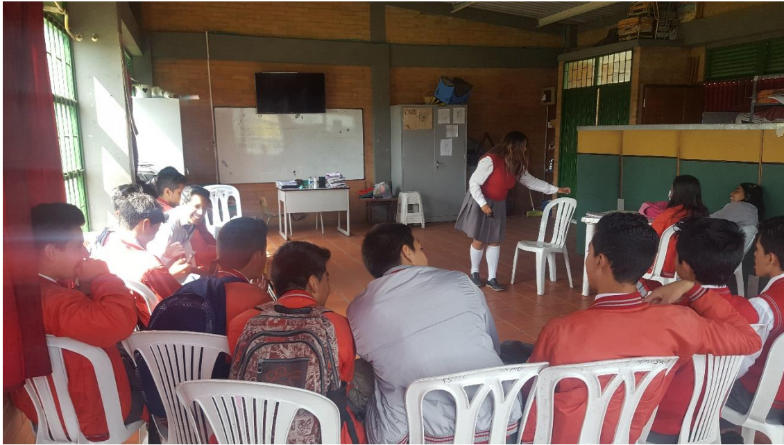
Anexo 4: percepción de la cartilla parte docente 901