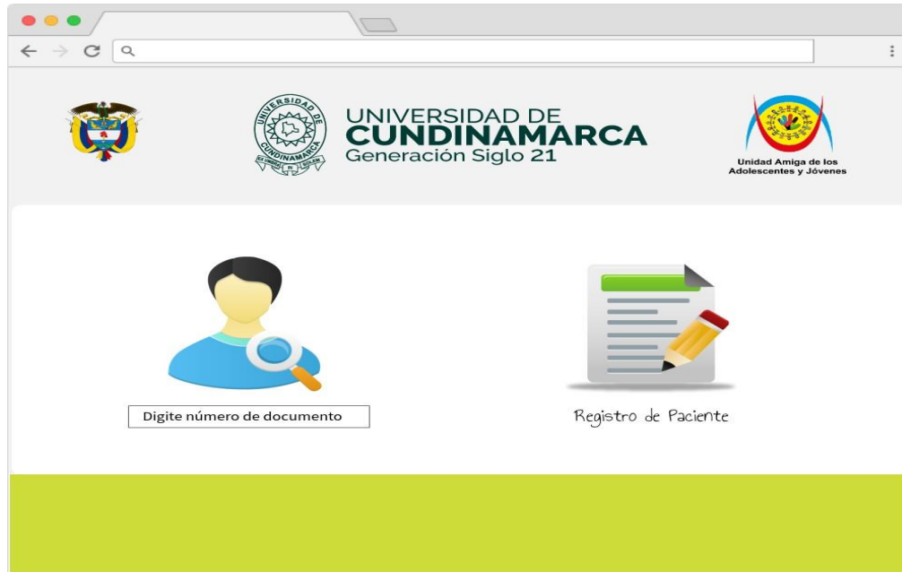
Ilustración 4. Pasante