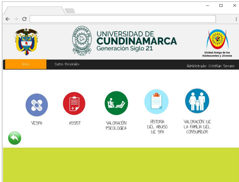
Ilustración 5. Formularios