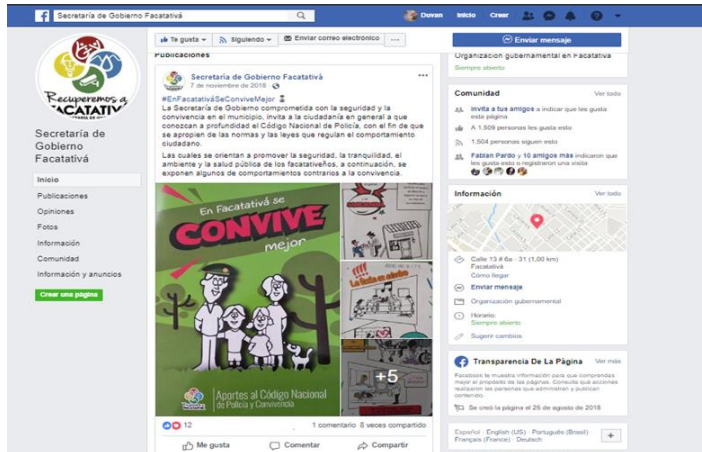
Figura 2 Socialización código de policía a la ciudadanía.