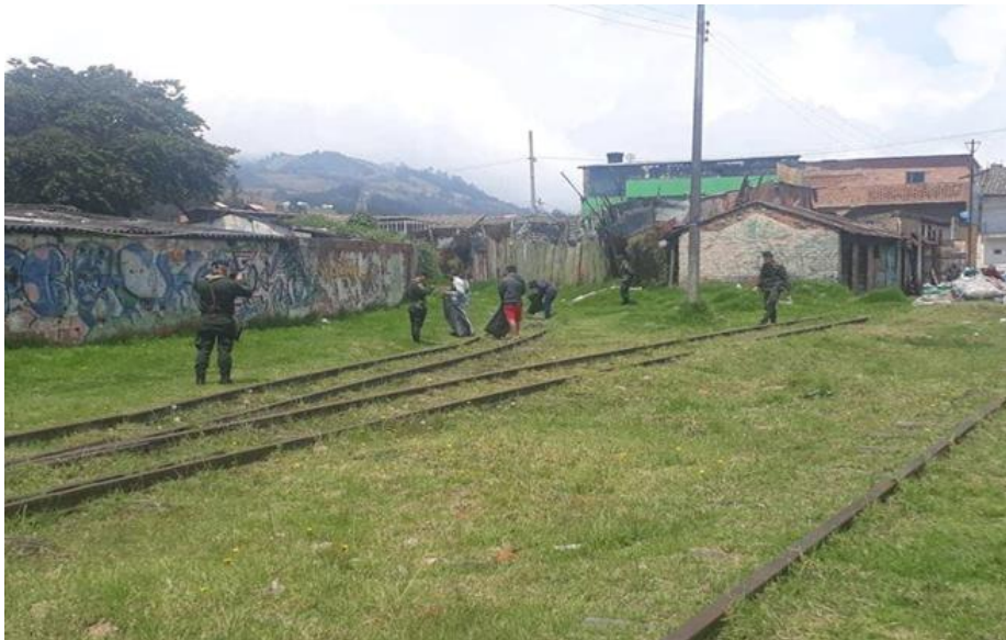
Factores que determinan el comportamiento del ciudadano

En Facatativá y como se puede ver qué sucede en la gran parte de Colombia los factores que determinan el comportamiento del ciudadano frente a la seguridad y convivencia ciudadana es la