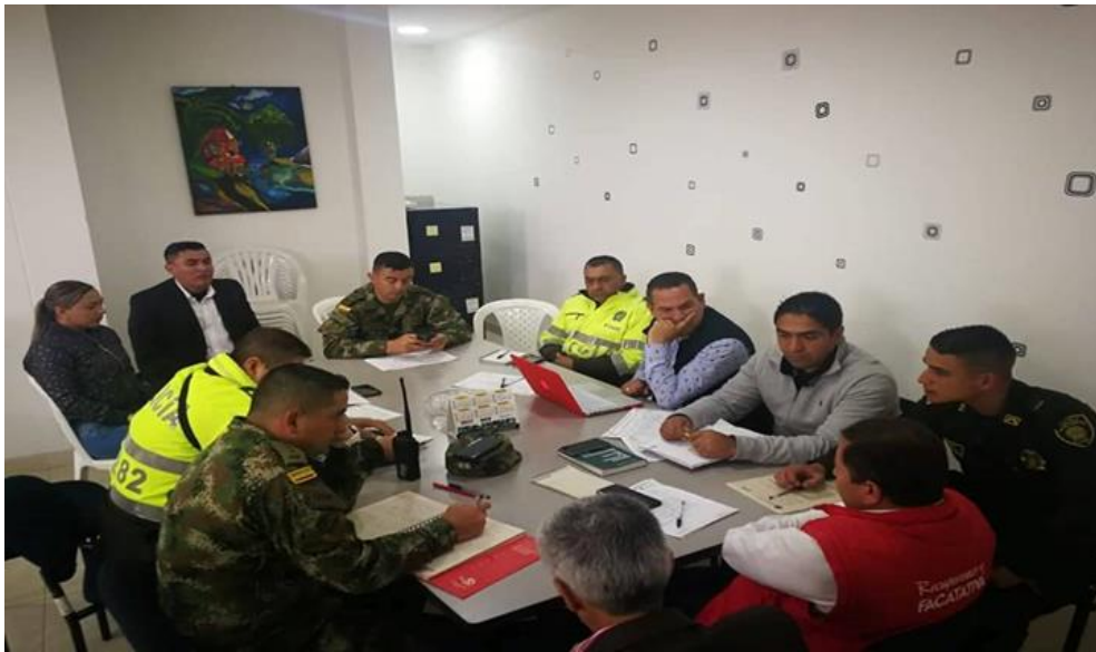
Figura 10 Reunión de consejo de Seguridad.