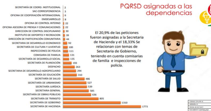
Figura 7 Numero de PQRSD asignadas a cada dependencia de la Alcaldía.

ellos internamente, y después de tener el visto bueno y la firma del señor Secretario de Gobierno de turno ya que cada uno de estos documentos se identifican internamente con un número que le dan al ingreso en el sistema el pasante debía buscar la relación de ese documento de respuesta con el oficio que fue radicado inicialmente y ser el encargado de subir esa respuesta al sistema de SAC (Sistema de Atención al Ciudadano) software encargado de hacer toda la administración de los recursos presentados a la Alcaldía Municipal y a cada una de sus secretarías, donde queda almacenado de una forma virtual la gestión que se la haya dado luego de este procedimiento se pasa se hacia la relación de las respuestas dadas a los documentos para entregar al mensajero encargado de entregar estos documentos, y así se logró una efectividad en esta secretaria pasando de 10 respuestas pendientes por día a dar un resultado promedio de 2 respuestas pendientes, y cerrando las peticiones en un tiempo menor al que exige el sistema SAC. A continuación, se ve una gráfica de la cantidad de PQRSD presentadas.