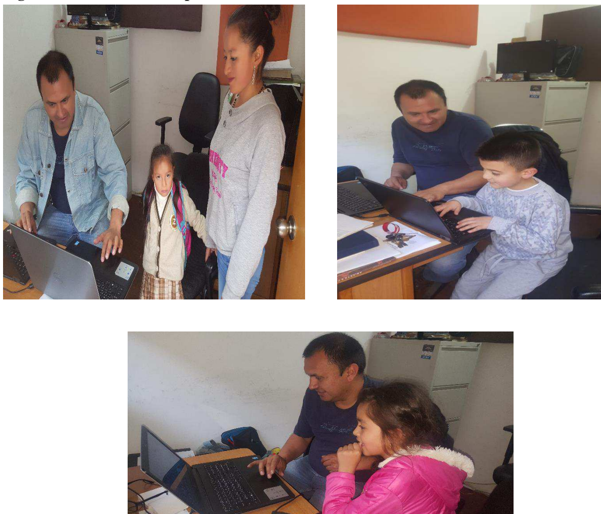
Figura 2: Ambiente dos espacios académico administrativo