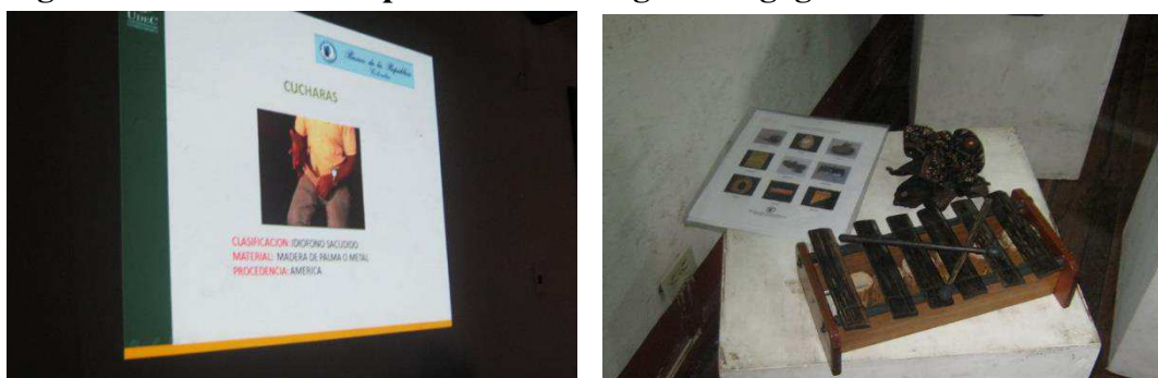
Figura 8: Muestra final aplicación Estrategia Pedagógica