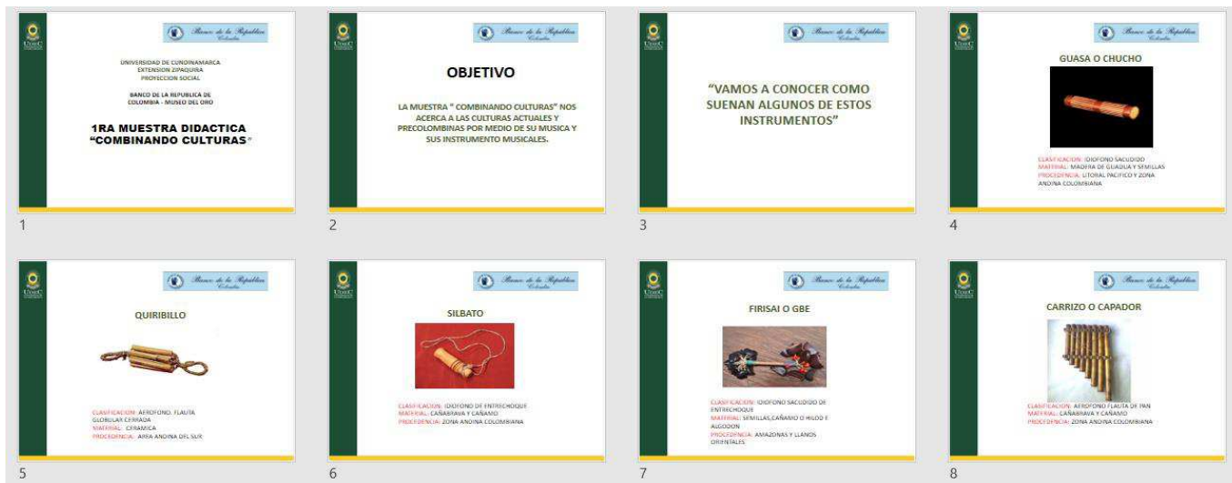
Figura 7: Presentación para proyectar combinando culturas

Fuente: propia Recursos para implementación estrategia pedagógica