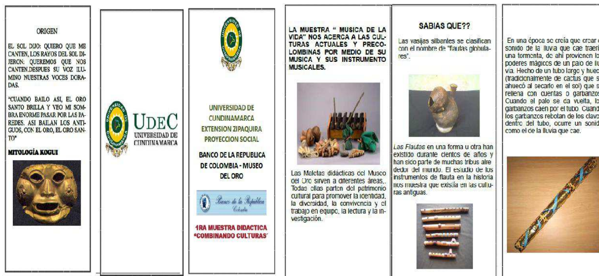
Figura 6: Brochure 1ra Muestra Didáctica Combinando Culturas

Recursos para implementación estrategia pedagógica