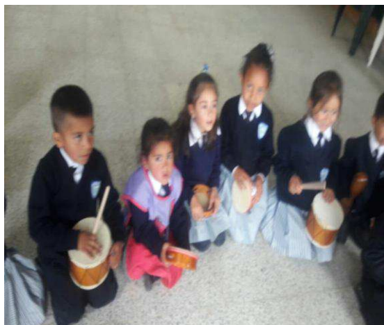
Figura 1: Ambiente uno espacios con instrumentos Musicales