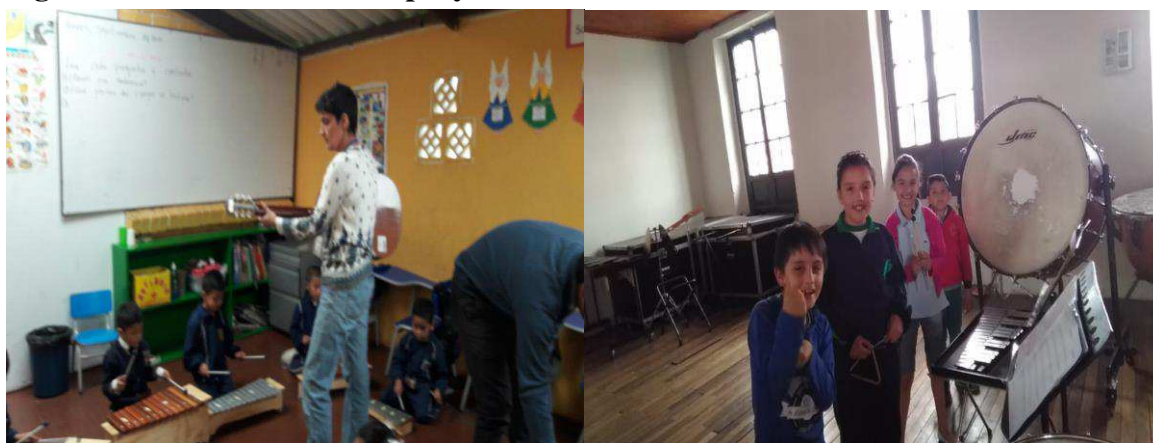
Figura 5: Actividad curso de proyección social