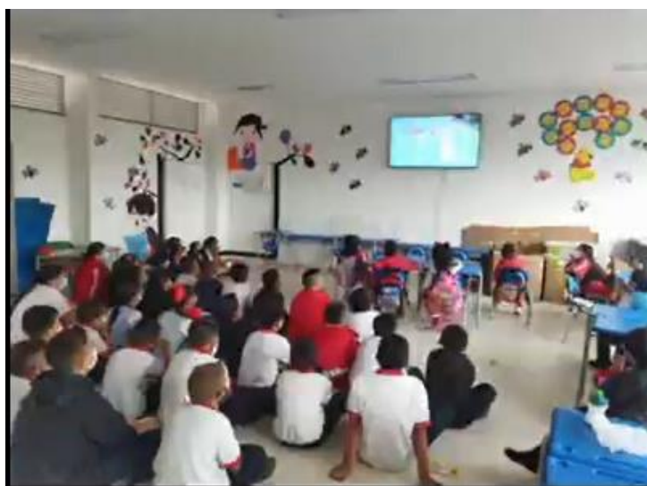
Figura 3. Socialización con los estudiantes