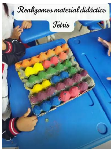
Figura 2. Uso del material reciclado