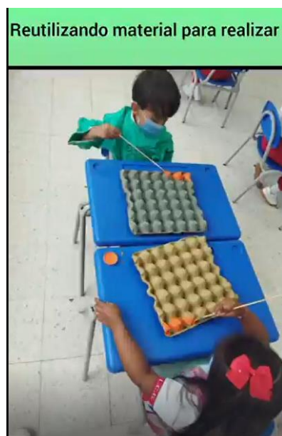
Figura 1. Socialización del material reciclado