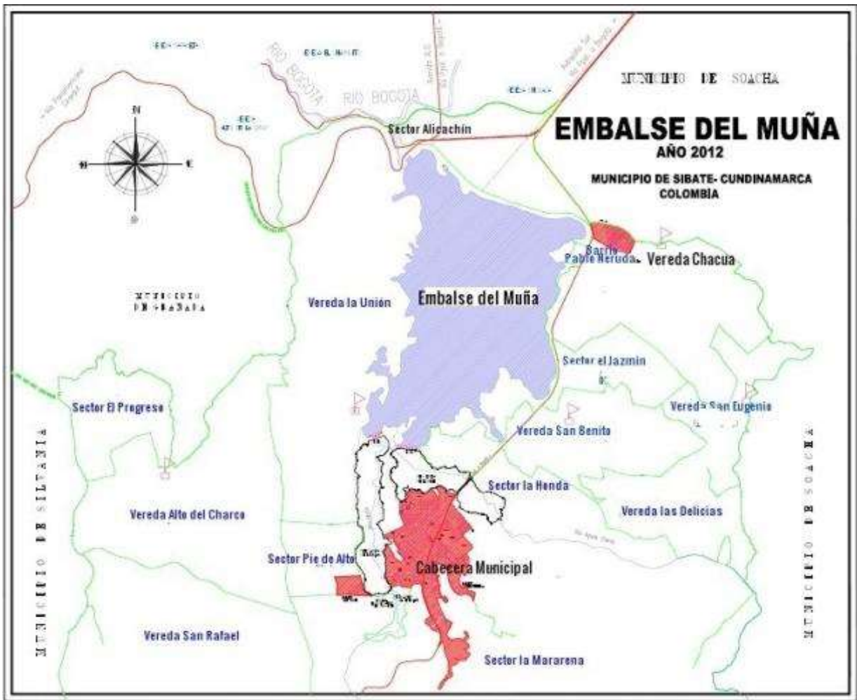
Ilustración 2 Embalse del Muña y Sectores aledaños.

materiales contaminantes ya que este río recibe las descargas de aguas residuales de la capital de Colombia y los municipios de su cuenca además de aportes industriales sin tratamiento alguno. Aclarando que el río Bogotá “(...) tiene una extensión aproximada de 365 kilómetros desde su nacimiento en el Páramo de Guachaneque a más de 3.500 msnm al Nororiente de Bogotá, hasta su desembocadura en el Río Magdalena a 300 msnm, en la población cundinamarquesa de Girardot” (Pizano, s.f p. 2).