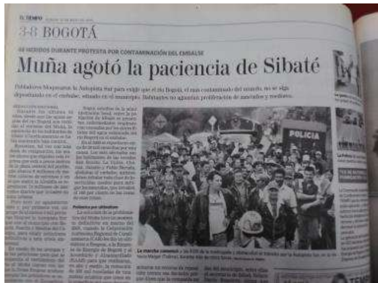
Fotografía 7 Artículo del diario El Tiempo, Publicado el 13 de marzo de 2006.

entonces se hizo un paro por estas problemáticas y fue terrible, se vinieron de diversos sectores de Sibate, fue violento, porque se agredieron a los policías y ellos a la población con pipetas y gases”, situación recordada por todos los entrevistados”.