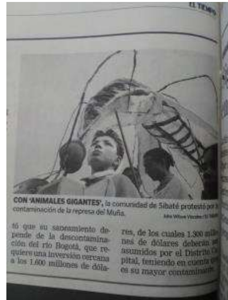
Fotografía 5 Artículo del diario El Tiempo, Publicado el 29 de mayo de 2004.