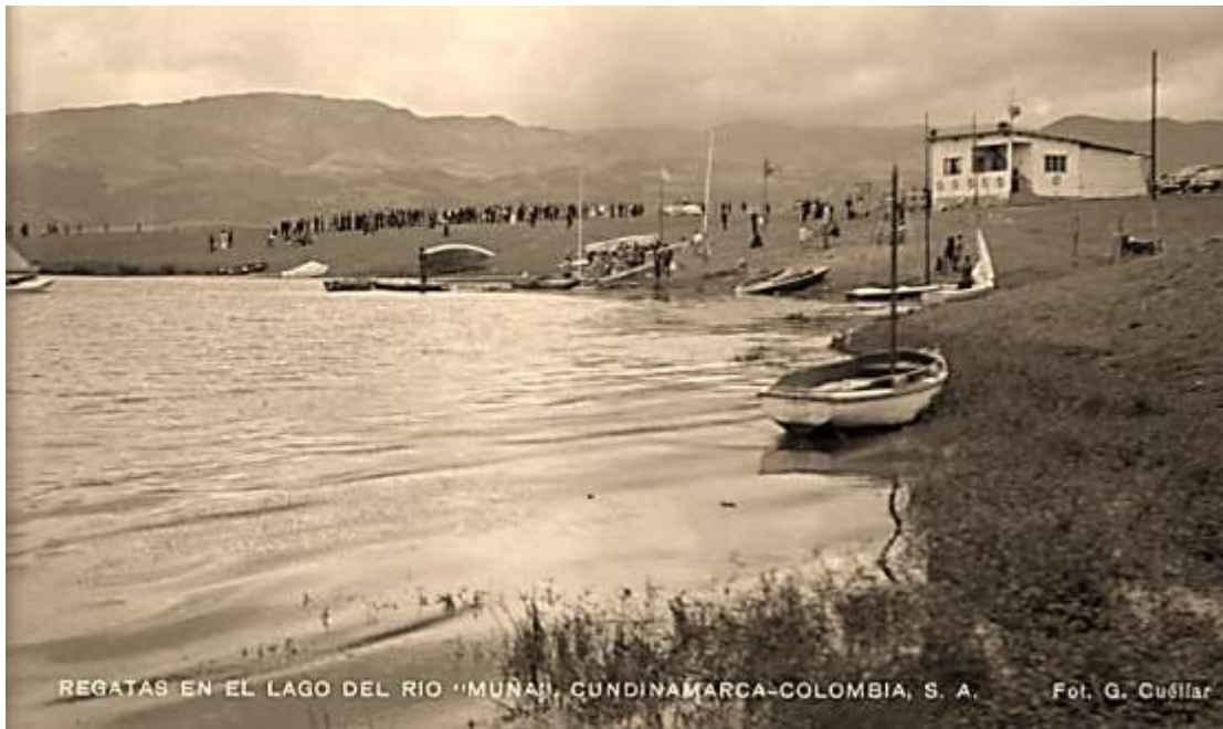
Fotografía 3 Cuéllar G. (s.f) Regatas en el lago del río Muña. Cundinamarca Colombia. Fotografía. Colección Gumersindo Cuéllar Jiménez Biblioteca Luis Ángel Arango Identificador: brblaa925921-2

barcos, carreras de velas y se pescaba, todo era muy bonito” 5 . Es este punto cabe recordar la afirmación de Torres Carrillo al exponer como “desde el carácter subjetivo de las Ciencias Sociales se utilizan categorías como conciencia, ideología, descontento, inconformidad, creencias generalizadas y agravio moral (...)” (2009, p. 56)