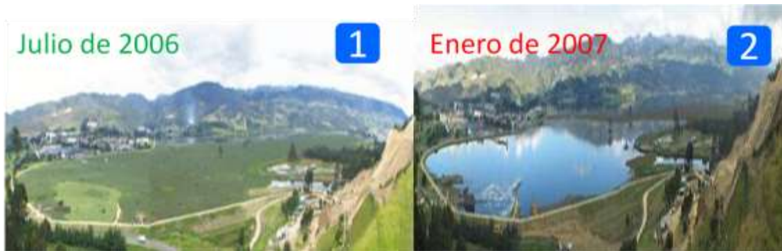
Ilustración 3 Buchón y espejo de agua en el embalse del muña.