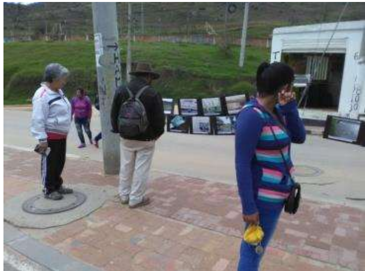
Fotografía 10 Exposición fotográfica.