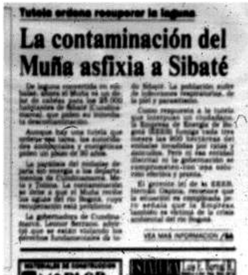
Fotografía 4 Artículo del diario El Tiempo , Publicado el 15 enero 1996. Hemeroteca de la Biblioteca Nacional de

contaminación de la represa se acabó por completo la vida acuática, silvestre y la tranquilidad de los habitantes de este municipio.