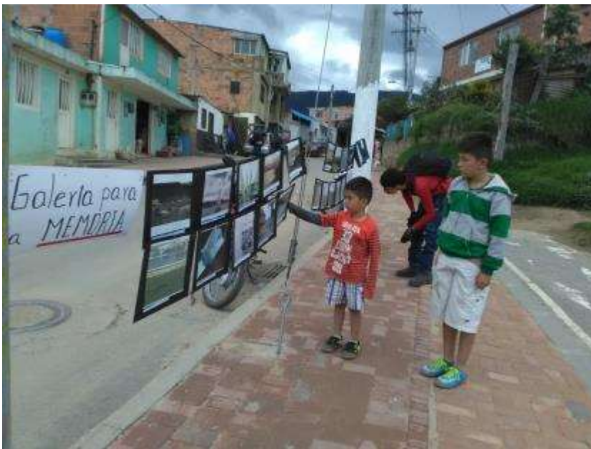
Fotografía 9 Galería para la memoria, Vereda Chacua, febrero 2017.

Dicha actividad se denominó la Galería para la memoria, fue realizada el 18 de febrero de 2017 y consistió en exponer una serie de fotografías de distintas épocas del embalse del Muna