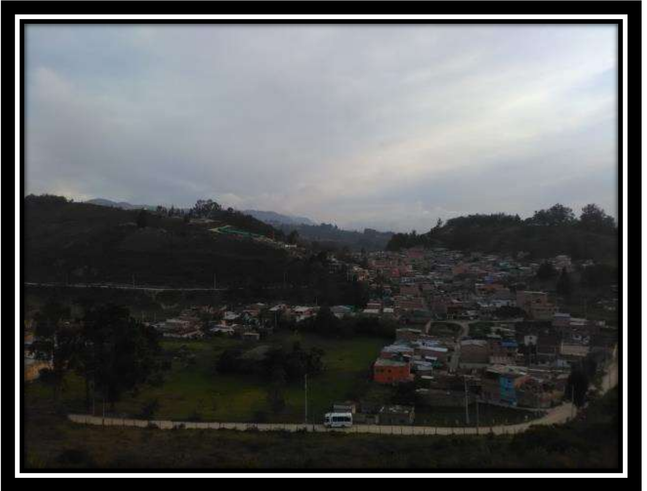
Fotografía 1 Vereda Chacua, Febrero de 2017.