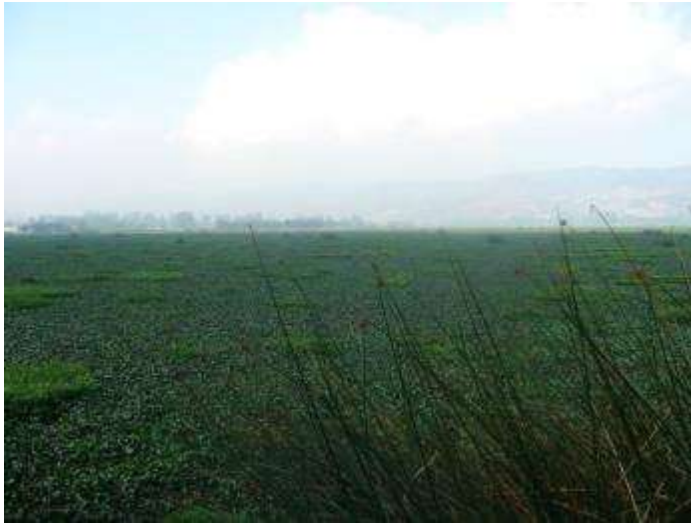
Fotografía 8 Eichhornia crassipes (2005) conocido comúnmente como buchón cubriendo el espejo del agua del embalse del Muña. Sibaté Cundinamarca

poder dormir, ya luego empezaron a recoger zancudos para corroborar que tanta cantidad había y establecer si era o no una cantidad tolerable por los seres humanos, además de analizar si de verdad había la problemática que la comunidad denunciaba, de igual manera se fumigaban las casas como se evidenciara más adelante, finalmente al darse cuenta que ya nada de esto era efectivo decidieron secar las colas del embalse mediante dos diques para alejar las aguas de la cabecera municipal y finalmente fumigar para acabar el buchón excesivo sin importar lo que esto pudiera implicar.