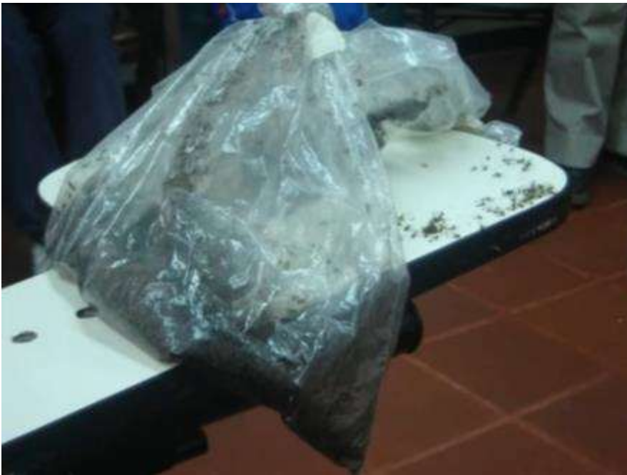
Fotografía 6 Bolsa de zancudos, recogida con trampa Entomológica (2005) Sibaté Cundinamarca.