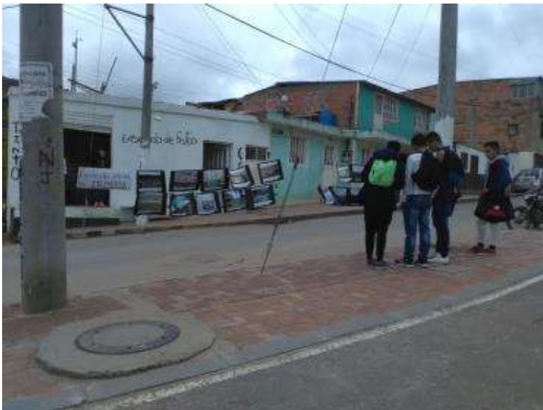
Fotografía 11 ¿es importante la memoria? ¿Por qué?

Por otra parte se evidenció que gran parte de los transeúntes no observaban o al observarlas no generaba aparentemente un mínimo interés, y expresado por ellos mismos, principalmente jóvenes para los cuales el embalse del Muña no tiene importancia en sus vidas porque simplemente no saben porque está bajo esas condiciones y cuáles fueron los motivos para que esté contaminado, además de llevar residiendo poco tiempo en la vereda y manifiestan no tener un interés por conocerlo ya que no son sus prioridades en estos momentos, y por otro lado que en el colegio más cercano ubicado en el Barrio Pablo Neruda no les hablan de esos temas, evidenciando una problemática concreta que es la educación descontextualizada y de si es verdaderamente importa recordar, llevando a pensar sobre la pertinencia de los temas de memoria colectiva en las instituciones educativas.