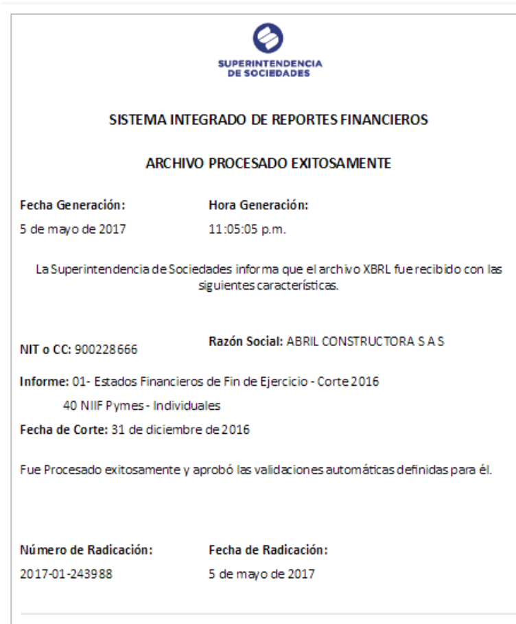
GRAFICA N° 28 RADICADO REPORTE A SUPERSOCIEDADES