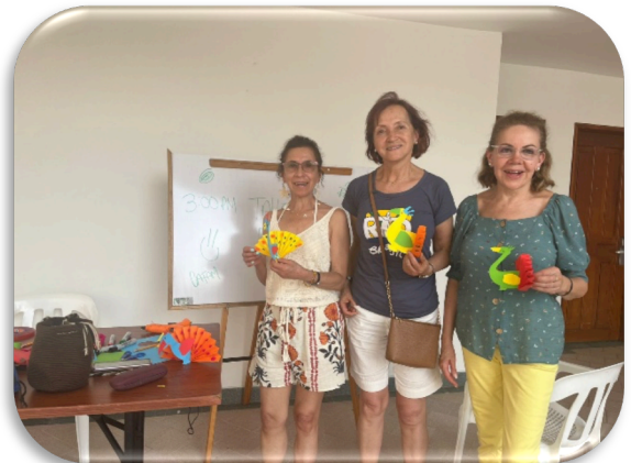
Ilustración 10. ACTIVIDADES