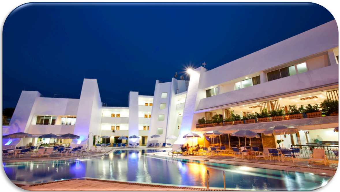
Ilustración 3. INTERIOR CON PISCINA