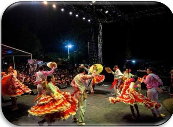
Ilustración 9. BAILES