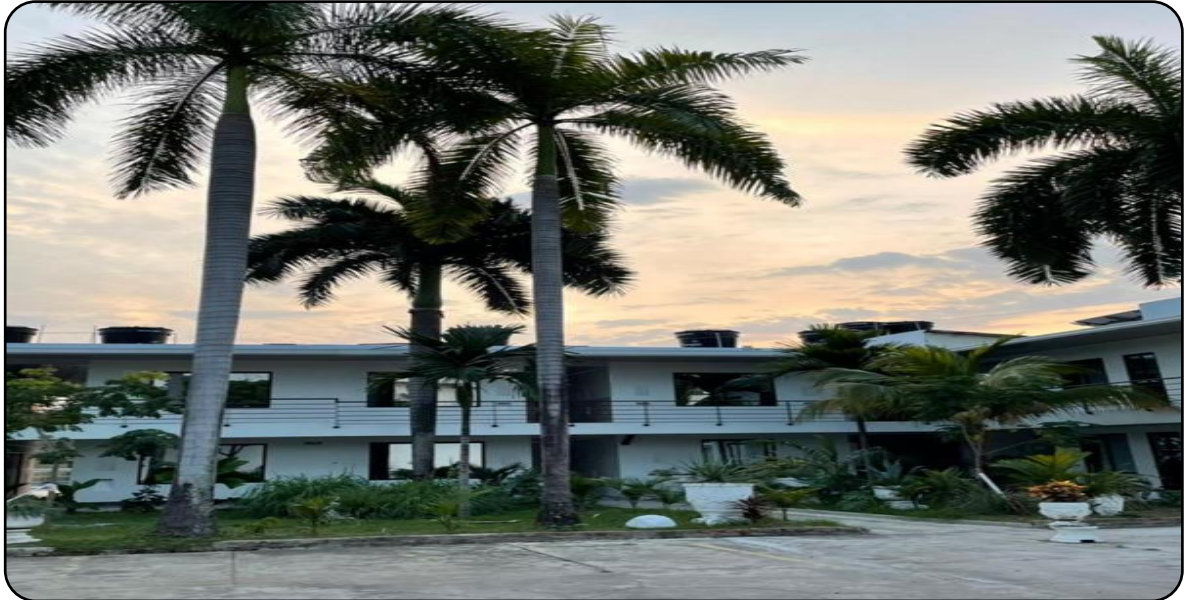
Ilustración 2. FACHADA DEL HOTEL