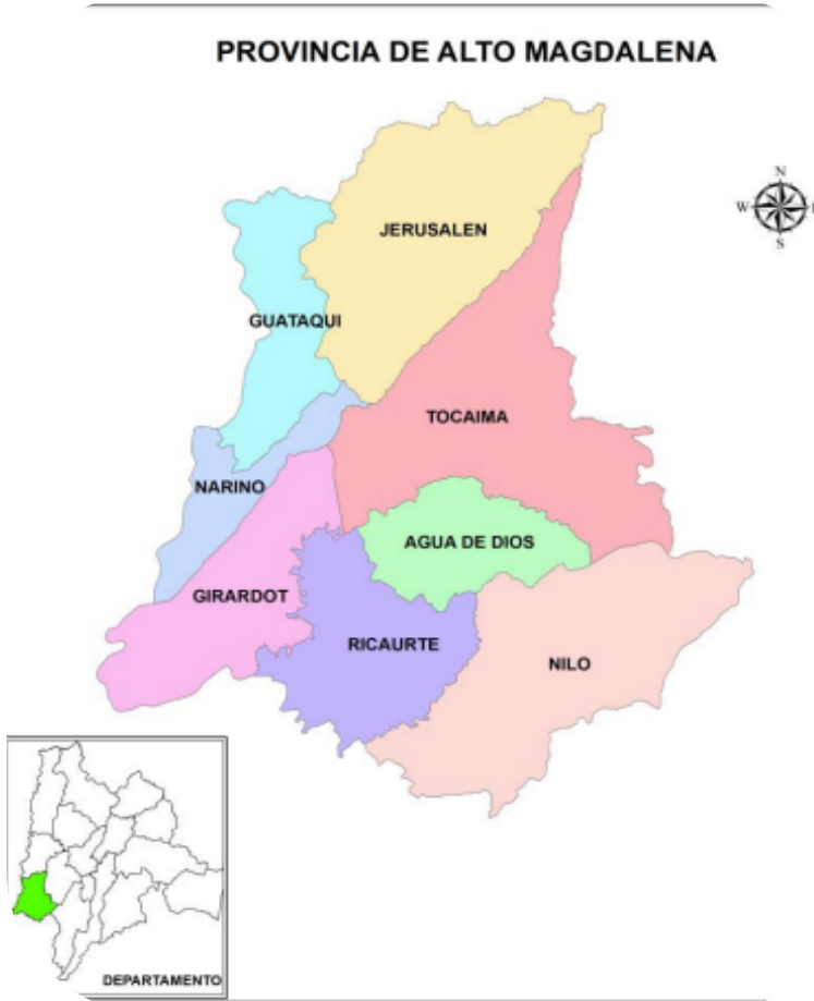
Ilustración 1. PROVINCIA ALTO MAGDALENA

oriental y desemboca en el río Magdalena. En el entorno de la ciudad de Melgar destacan importantes atractivos turísticos como las piscinas termales de Santa Ana, la reserva natural del Cañón del Río Apulo, el parque natural de La Garza, entre otros.