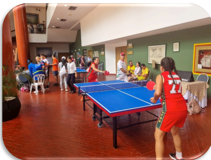
Ilustración 7.PIN PON

Es un programa enfocado en el entrenamiento de habilidades y potencializar las capacidades motrices como la coordinación, percepción visual y la memoria. Además, ayuda a evitar el sedentarismo, perder capacidades y futuras enfermedades por medio de juegos simples y divertidos, enfocado en los deportes para incentivar a la práctica de estos. Los deportes a realizar son: fútbol tenis, natación, Acuayoga, torneo de rana, tenis de mesa, juegos del ayer, Badminton, Vóley Playa. Estos deportes permiten la participación de todas las edades con una duración mínima de 45 minutos y están adaptados para realizarse en los espacios de los hoteles.