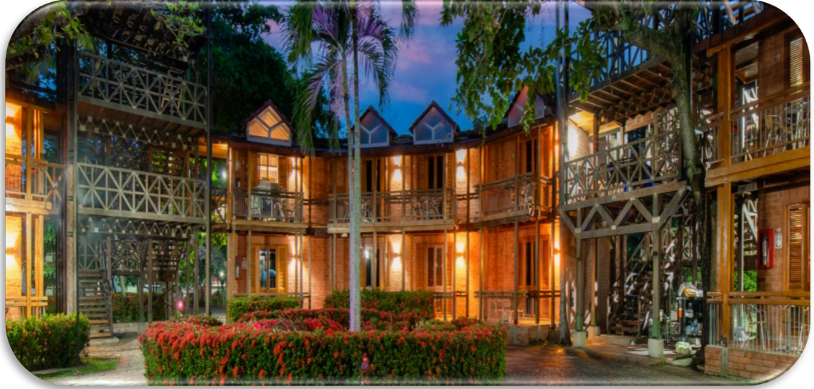
Ilustración 6. PLAZA CENTRAL DEL HOTEL