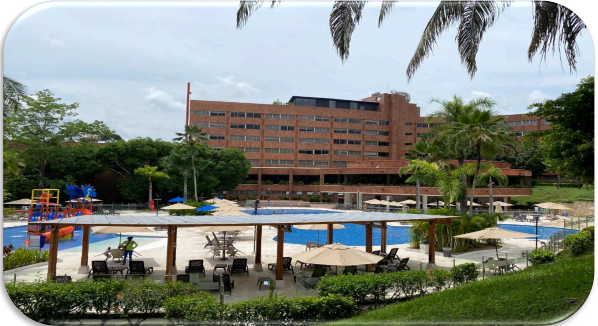
Ilustración 4 INTERIOR HOTEL EN MELGAR