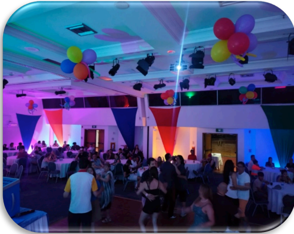
Ilustración 14. EVENTOS