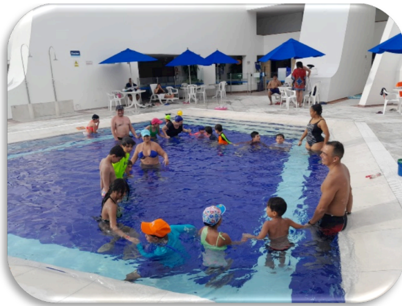
Ilustración 11. PISCINA