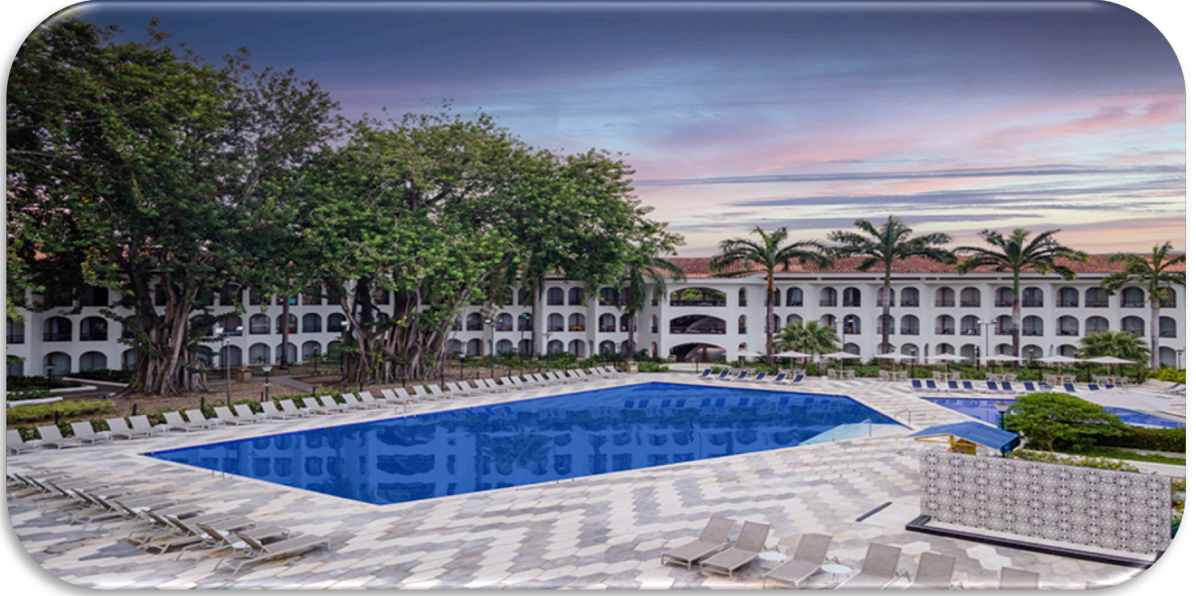
Ilustración 5. INTERIOR Y PAISAJE DEL INTERIOR