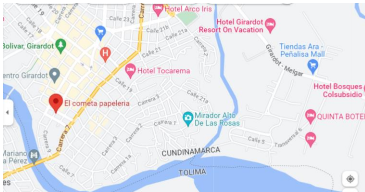
Figura 1. Ubicación