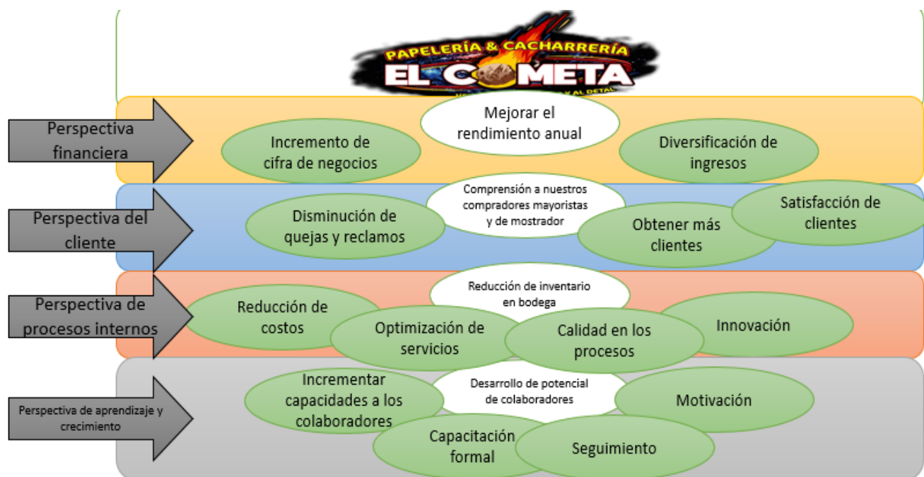
Figura 3. Mapa estratégico