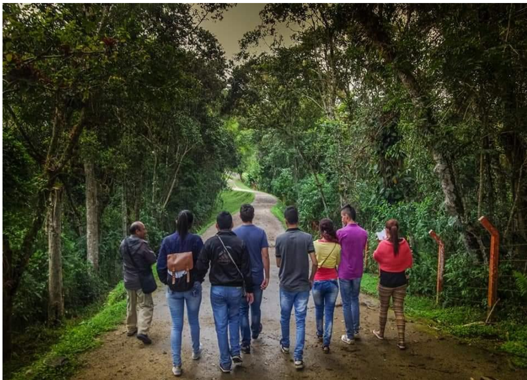
Ilustración 5. Parque arqueológico San Agustín, Huila.