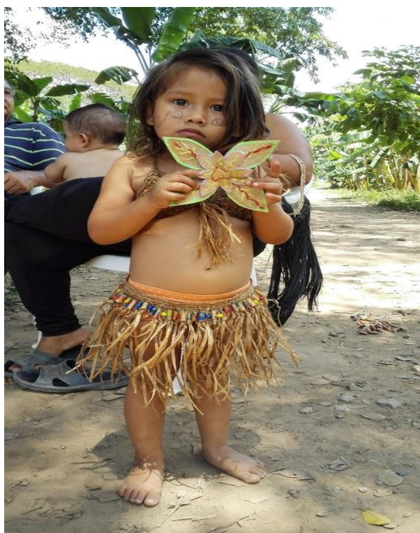
Ilustración 4. Muestra traje típico de la comunidad indígena del Cabildo.

En el segundo día, realizamos un mural en conjunto con las personas del cabildo y vimos una presentación de una danza típica y el respectivo vestuario.