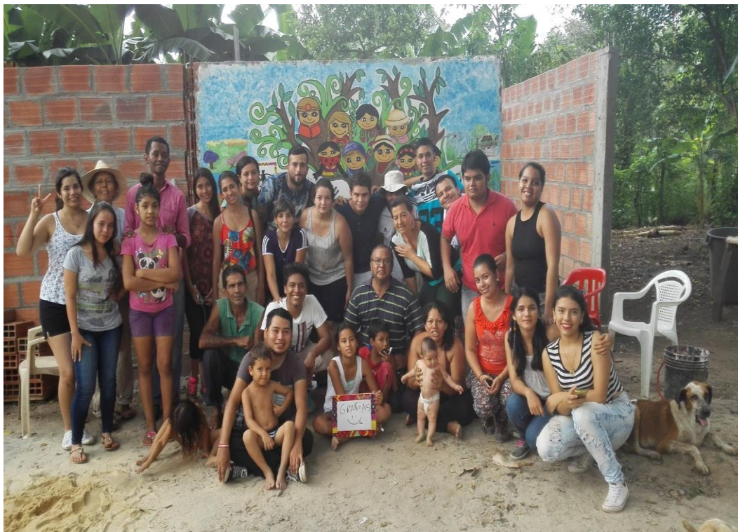
Ilustración 3. Elaboración del mural Ataco.