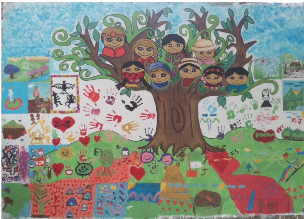
Ilustración 2. Mural colectivo Ataco - Tolima.