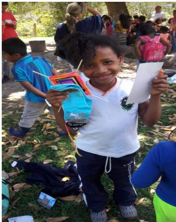
Ilustración 6. Institución educativa, Tierra Adentro.