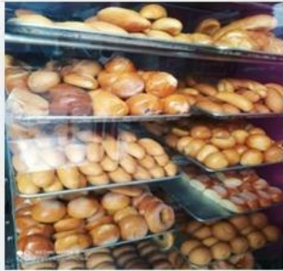
Imagen 3. Productos.