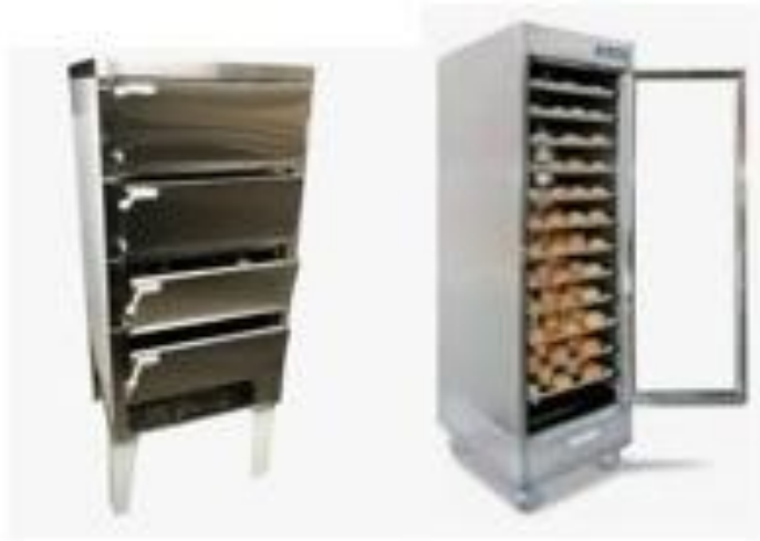
Imagen 4. Funcionamiento a Gas