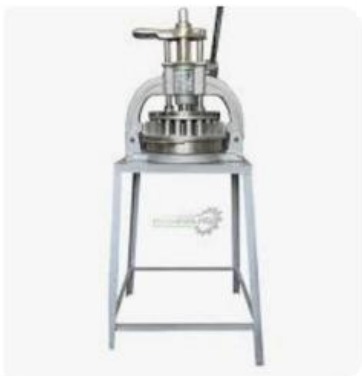
Imagen 6. Maquinaria manual.