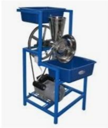
Imagen 5. Maquinaria eléctrica