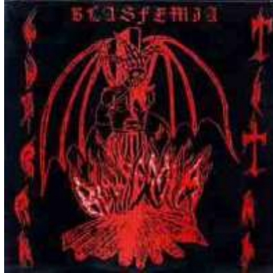
Flayer Guerra Total