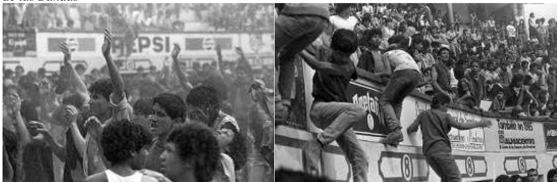
La Batalla de las Bandas