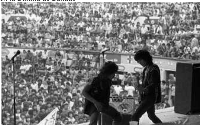
Concierto de Parabellum en la Batalla de Bandas