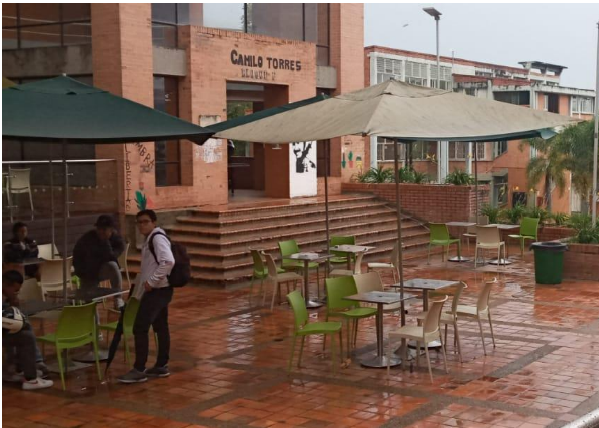
Zona de estar del bloque F