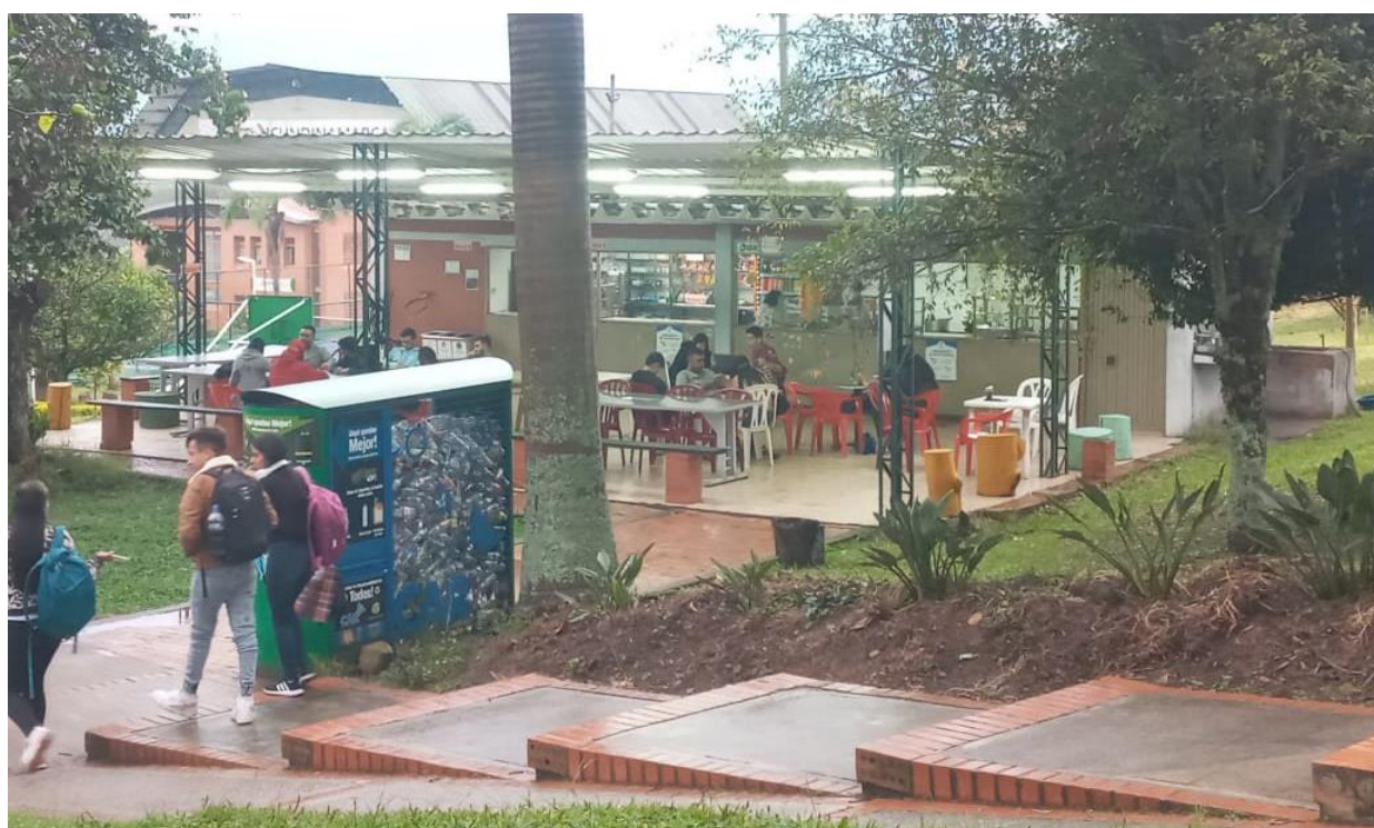
Cafetería de las canchas.