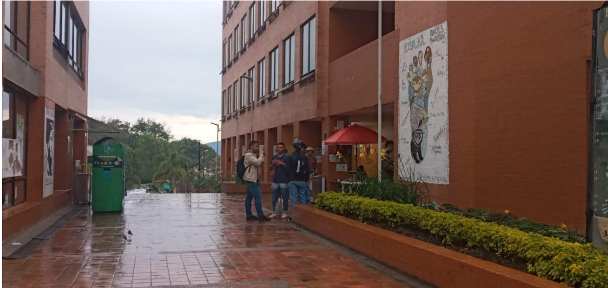
Chazas del bloque E.