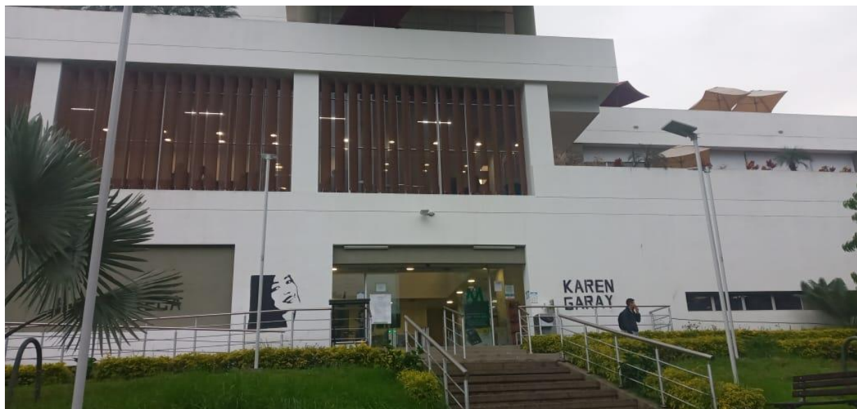
Biblioteca Karen Garay.