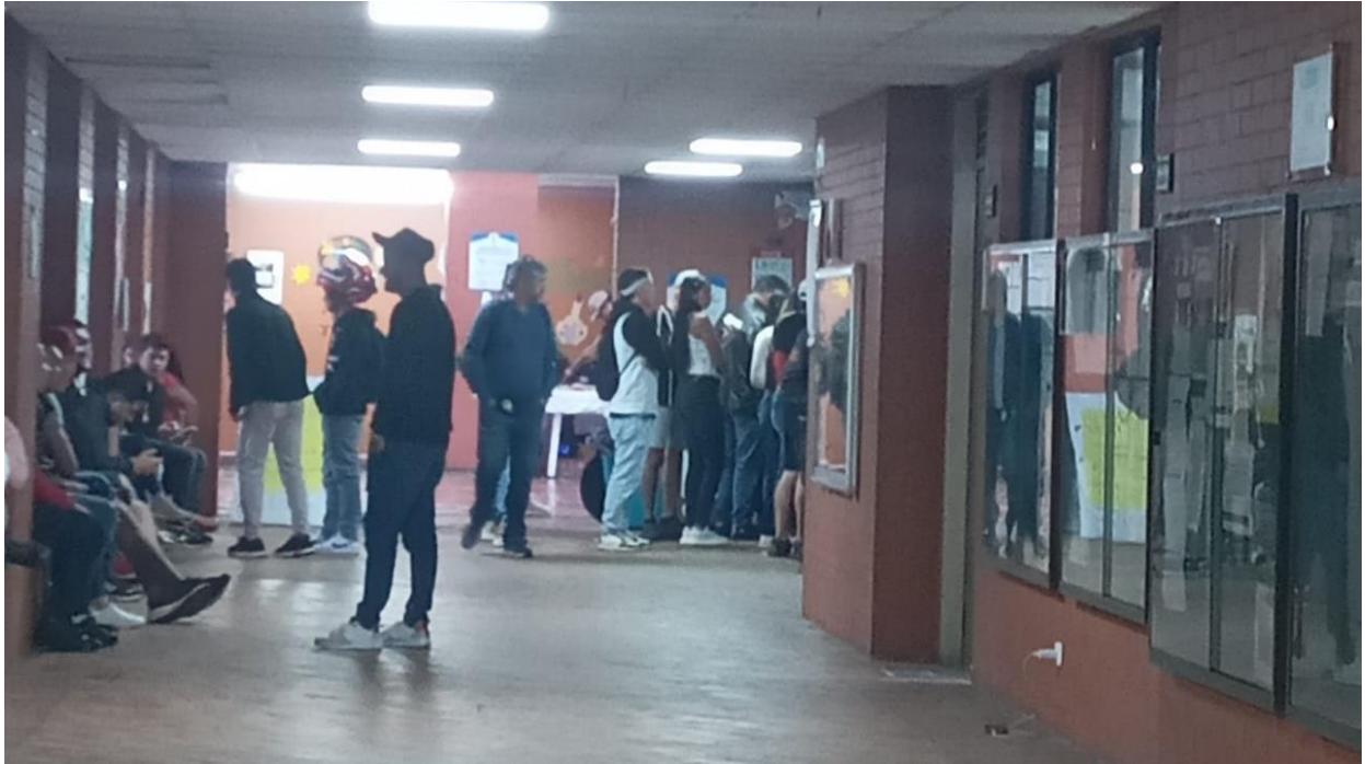
Cafetería del bloque F.