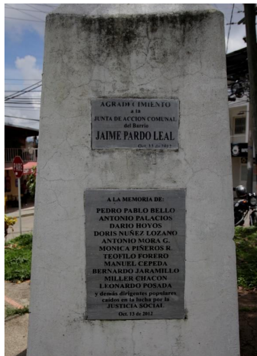
2 Obelisco del barrio Pardo Leal en memoria de las víctimas de la UP