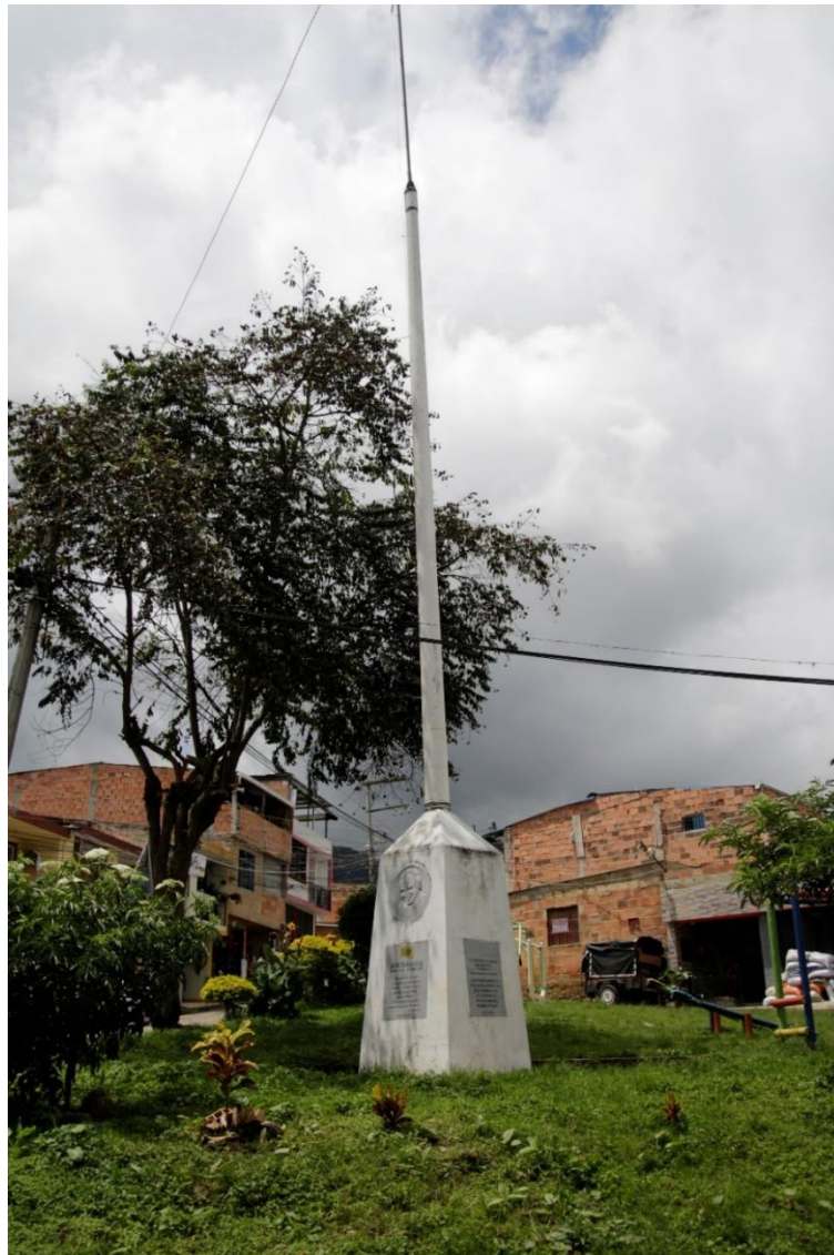
1 Obelisco del barrio Pardo Leal en memoria de las víctimas de la UP

del homenaje a dicho personaje también se encuentran los nombres de antiguos líderes y de las víctimas que perecieron en el contexto de genocidio (Rodríguez P. H., 2022).