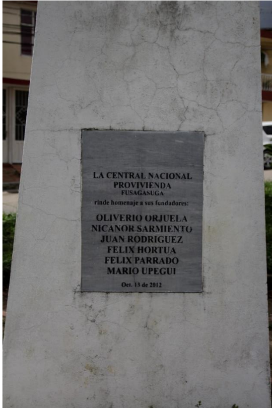
3 Obelisco del barrio Pardo Leal en memoria de las víctimas de la UP