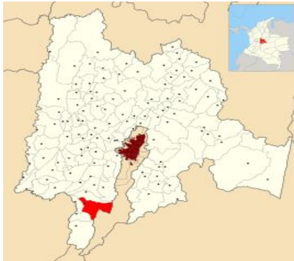
Ilustración 1 Ubicación geográfica municipio de San Bernardo

Se tomó como base para el análisis los municipios de San Bernardo y Venecia pertenecientes al departamento de Cundinamarca, como un ejemplo de los municipios correspondientes categoría sexta en Colombia, al cumplir con los requisitos exigidos por la ley para esta categoría.