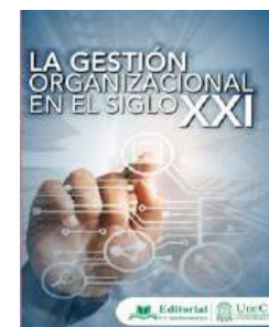
La Gestión Organizacional en el siglo XXI. Capítulo 3 Sector Turismo (2021)