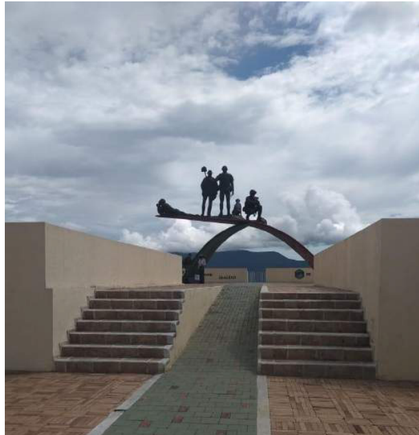
Monumento a los Héroes del Sumapaz, Chinauta