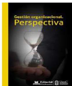
Gestión Organizacional Perspectiva (2019)