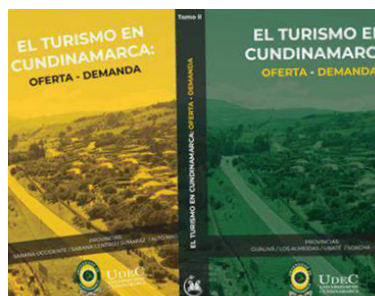
El Turismo en Cundinamarca: Oferta – Demanda (2019)