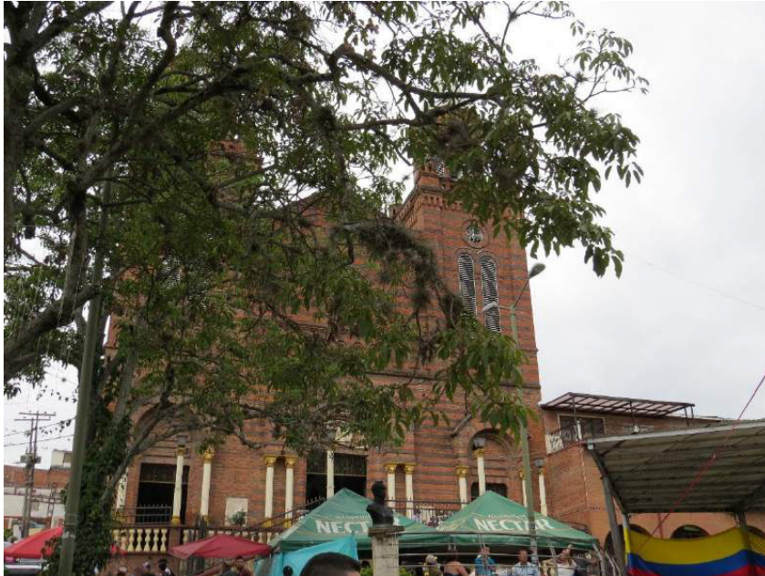
Parroquia Inmaculada Concepción