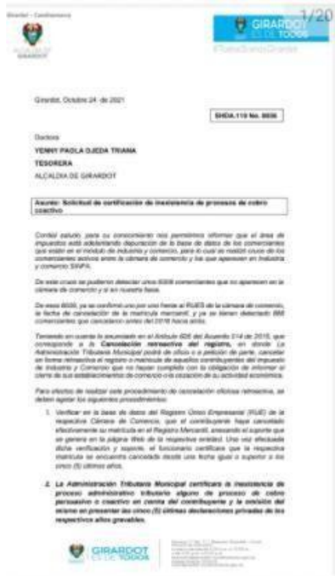
Ilustración 9. Primera de Solicitud de certificación de inexistencia de procesos de cobro coactivo