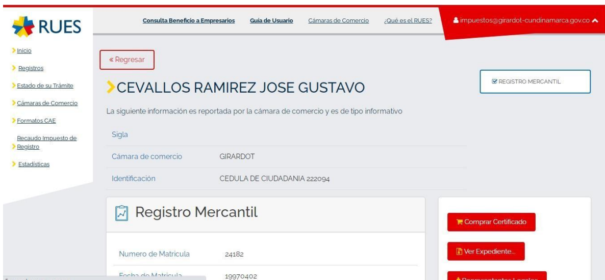
Ilustración 6. Aplicación de la cámara y comercio