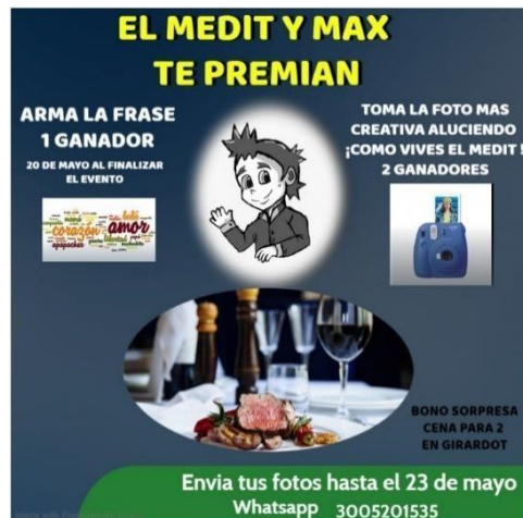
Ilustración 6 Publicidad de Incentivo 1