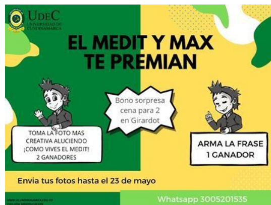
Ilustración 7 Publicidad de Incentivo 2