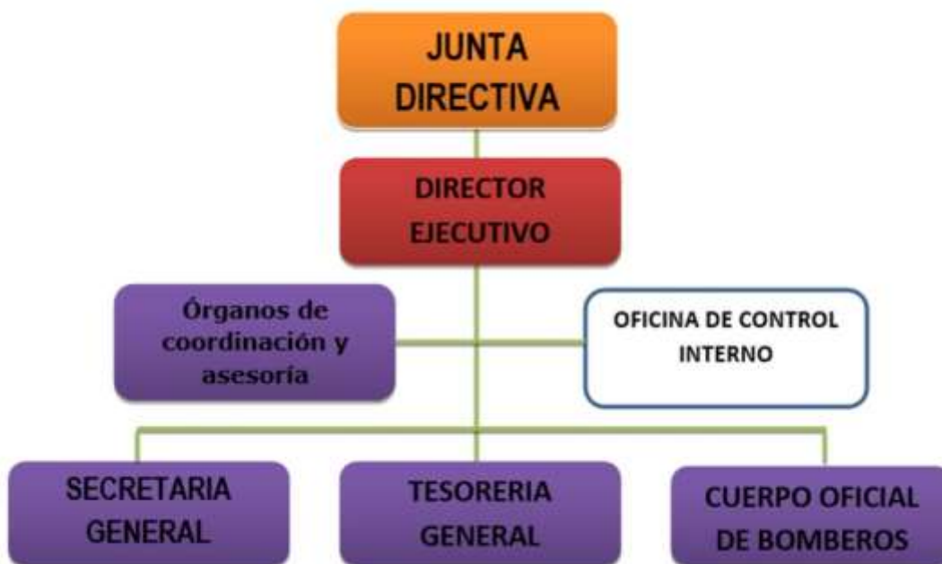
Figura 6. Estructura Organizacional Corporación Prodesarrollo y Seguridad