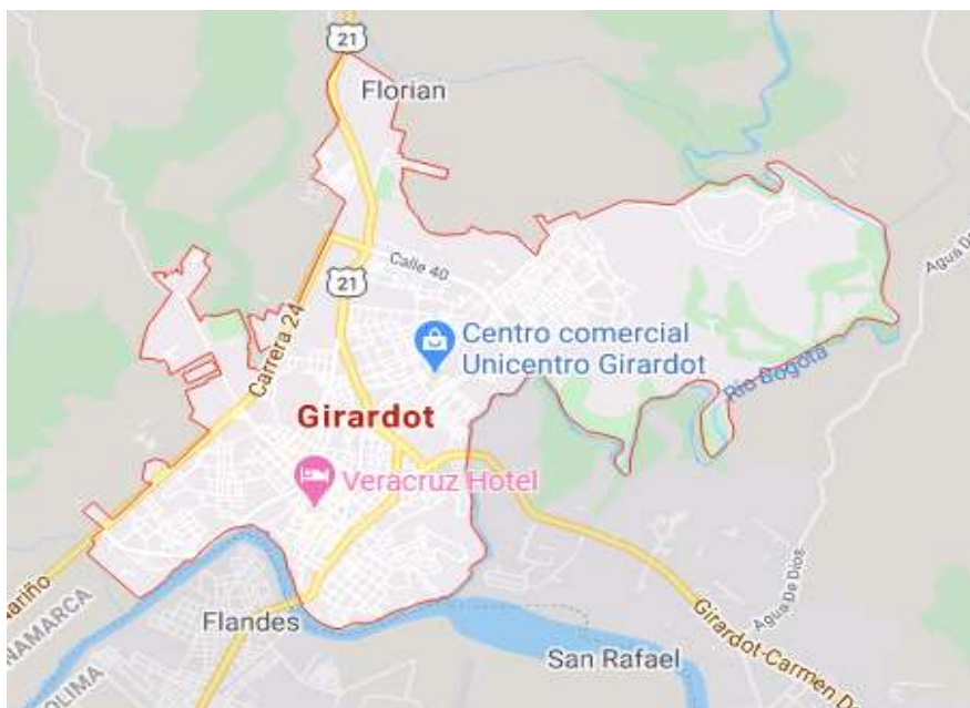
Figura 1. Ubicación Geográfica del Municipio de Girardot-Cundinamarca