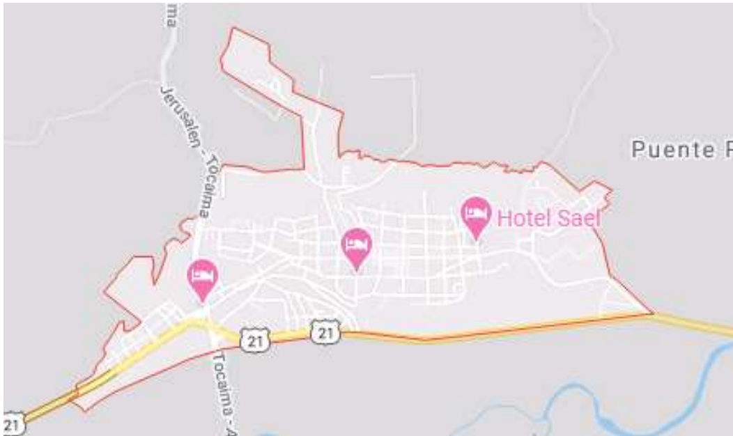
Figura 3. Ubicación Geográfica del Municipio de Tocaima-Cundinamarca.