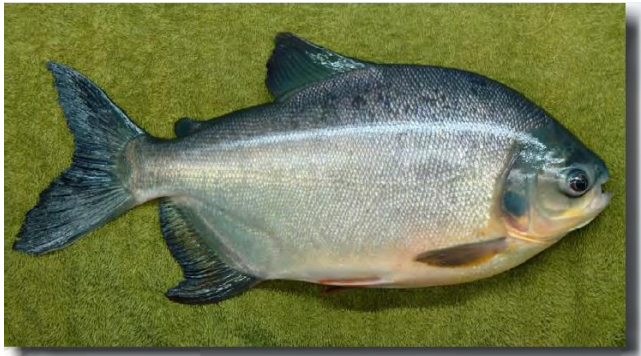
Figura 4. Cachama Blanca. (2015) Departamento de Ciencias para la Producción Animal.

Es propio de la Amazonia, destacado por ser la especie nativa de mayor producción en Colombia, su coloración es grisácea con reflejos azulosos, abdomen blanquecino con ligeras manchas anaranjadas. Inicia su reproducción al inicio de marzo hasta mediados de junio (Suarez, Medina, & Cruz, 2019).