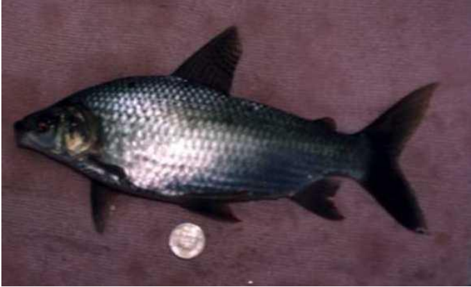
Figura 2. Bocachico Macho. (2015) Atencio-García Víctor

Es una especie endémica que aparece reportada en el libro rojo de las especies dulceacuícolas de Colombia, en categoría de peligro crítico, su tamaño es mediano, su boca es pequeña carnosa y prominente, lo cual hace referencia a su nombre común (Mojica et al, 2012). Se generan acciones de repoblamiento con prácticas biotecnológicas reproductivas (Hernandez, Navarro & Muñoz, 2017). Obteniendo períodos de reproducción con mayor actividad, entre octubre y marzo épocas de lluvia (Roa & Villa, 2019). Durante la época de reproducción, hace migraciones conocidas como subienda, desplazándose desde las ciénagas, donde se cría y se desarrolla en la parte alta de los ríos donde se reproduce. Durante este proceso sus gónadas terminan de madurar. Así mismo, realiza un proceso de migración de retorno a las ciénagas llamadas “bajanza”; Estas migraciones durante el año están sujetas a cambios en las condiciones físicas y químicas del agua, los cuales están influidos por el periodo de lluvias (Zapata & Usma, 2013).