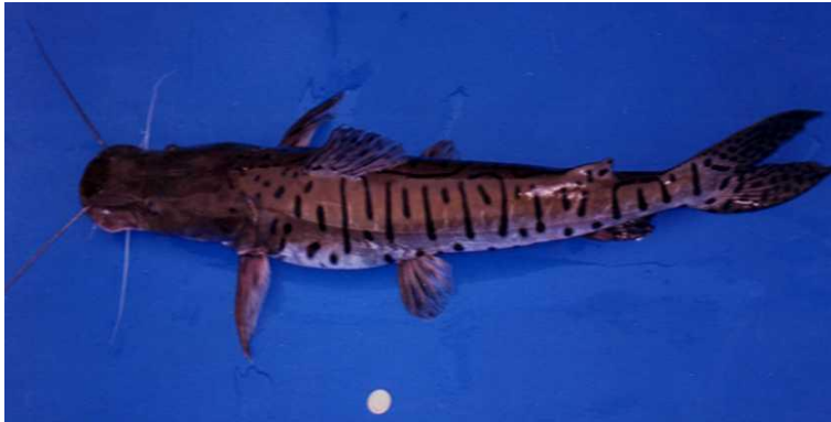
Figura 3. Bagre Rayado Macho. (2015) Atencio-García Víctor.

Es representativo de la cuenca del río Magdalena en Colombia, es endémico, las características de su cuerpo son: Alargado, muy comprimida de forma aerodinámica y sin escamas, cabeza grande y achatada valioso tanto económico y ambiental, actualmente está bajo amenaza debido a la pesca indiscriminada y la degradación de su nicho ecológico (Lozano et al, 2017).