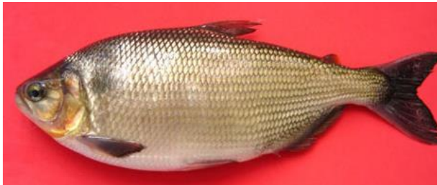
Figura 5. Yamú Macho (2020) Landinez.

Es un pez endémico de Colombia, es una especie reófila nativa de la cuenca del Amazonas (Maldonado, Vari, & Usma, 2008). Es considerada una especie con potencial de interés comercial, debido a su tamaño, rápido crecimiento, alimentación omnívora y aceptación de alimentos artificiales (Atencio et al, 2017). Es un pez de excelente carne. Se maneja su reproducción artificial, los estanques deben ser en lugares de clima tropical puede alcanzar los 8.4 cm de longitud en cautiverio (Mercado, Garcia, & Rosado, 2003).