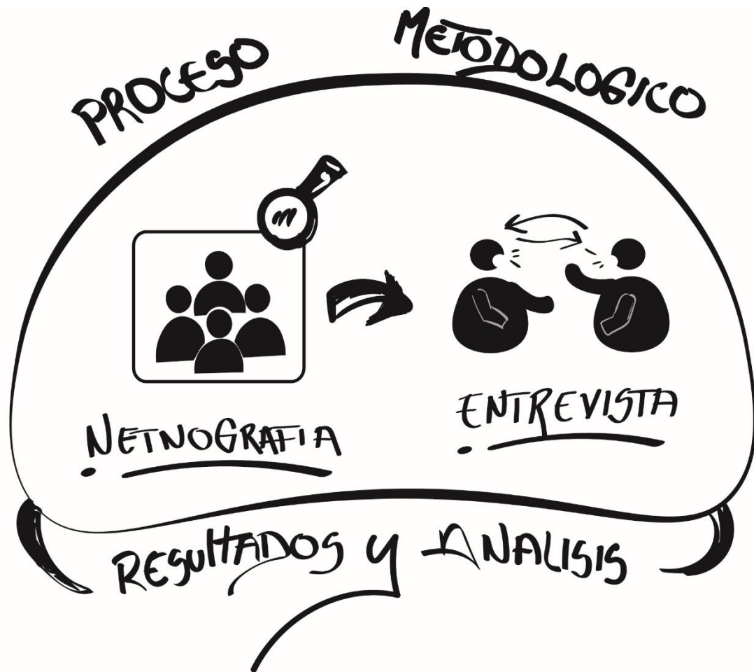
Grafico 1. proceso metodologico para la fase de recoleccion de datos (autoria propia)