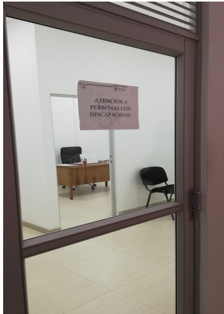
ILUSTRACIÓN 2. Oficina de atención a personas con discapacidad.