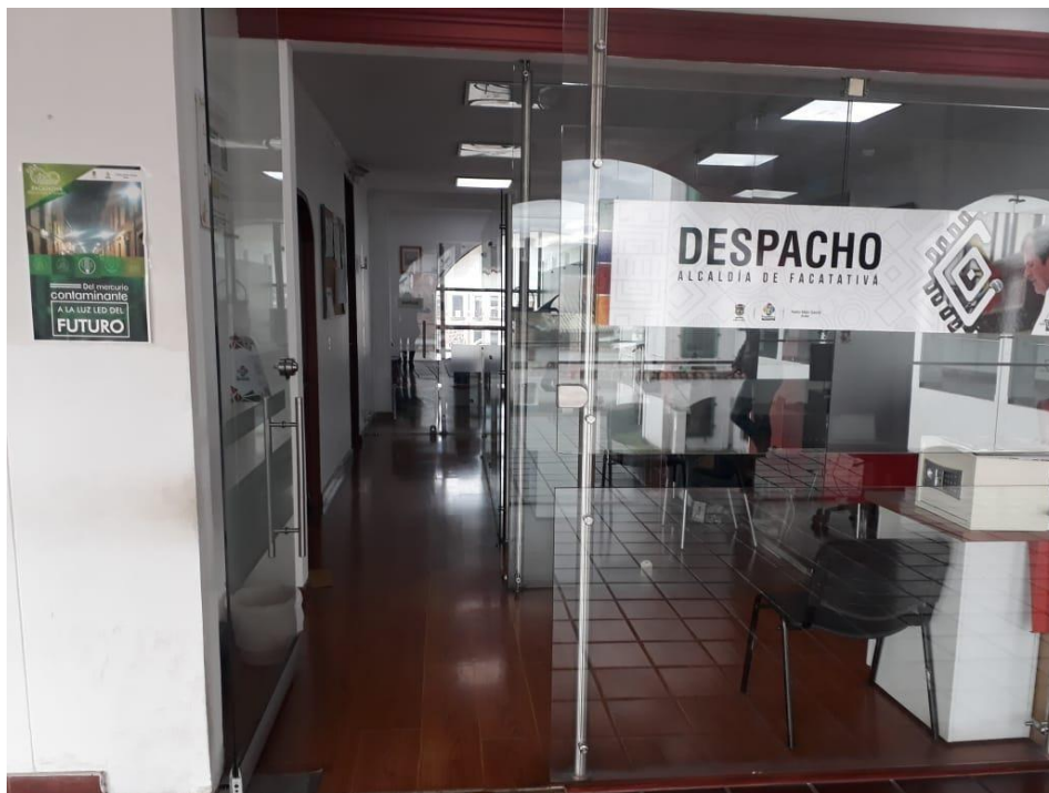
ILUSTRACIÓN 3. Despacho de la alcaldía.