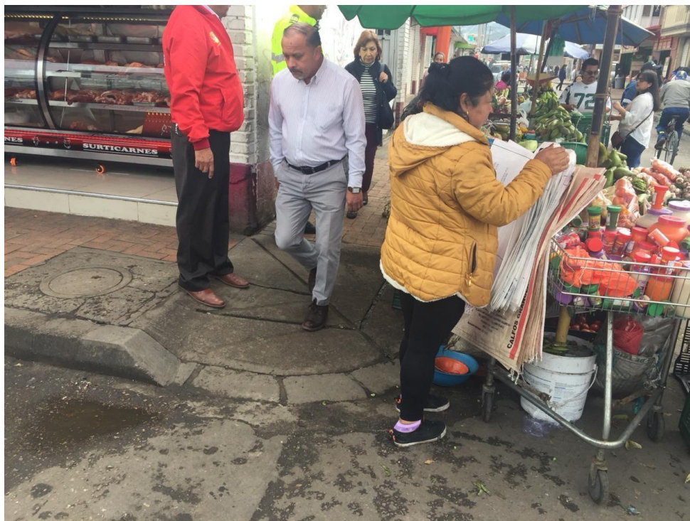
ILUSTRACIÓN 5. Recuperación del espacio público.