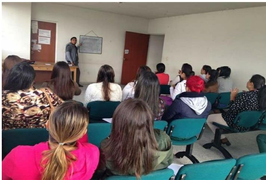
ILUSTRACIÓN 4. Capacitaciones con docentes sordomudos.