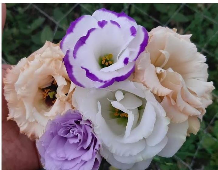
Imagen 4. Flores de Lisianthus variedades “Celeb Lovely Pink”, “Arena White”, “Megalo Magic Purple” y “Arena Picotte Purple”. (Santana, 2019)

E. grandiflorum se ha convertido en un producto con un gran potencial de comercialización en mercados nacionales e internacionales debido a que se posiciona como una especie novedosa, vistosa, con muy buena duración en florero y precio final ajustado (Cajimela V., 2006); puede considerarse como uno de los diez productos más vendidos en el mercado de los países bajos (Kameoka, 1998).