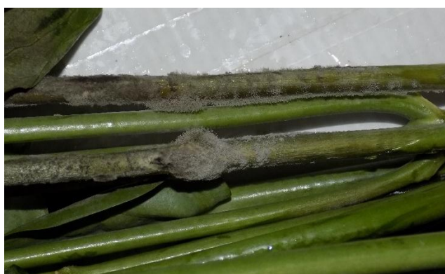
Imagen 11. Botrytis en tallo de Lisianthus (Santana, 2019)