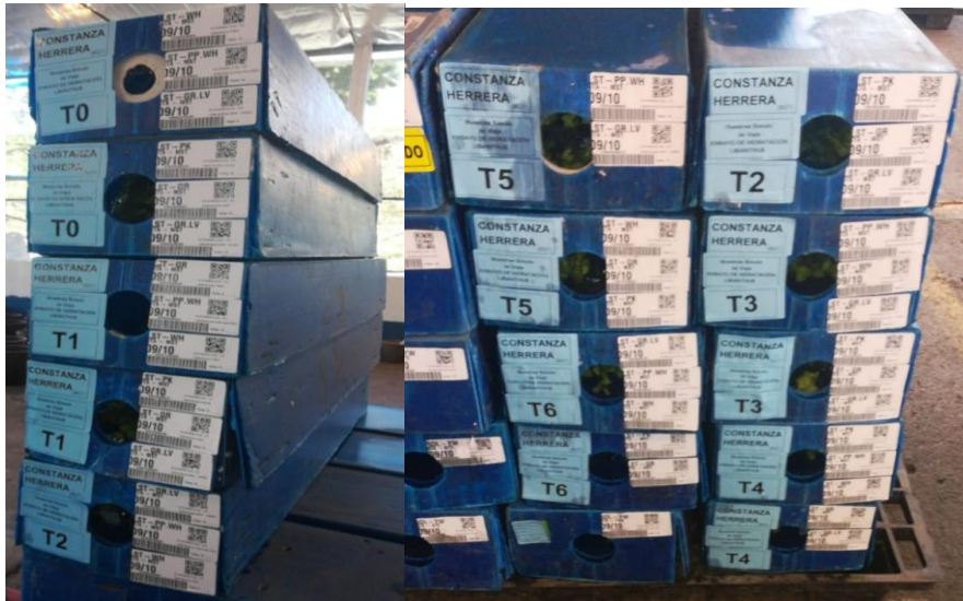
Imagen 8. Cajas o tabacos con Lisianthus en la poscosecha de la finca Marsella, listos para ingresar a cuarto frío (Santana, 2019)

Después de haber sido transportados entre fincas, se dejan los ramos en cuarto frío durante 12 días empacados en cajas de cartón (empaquete de flor para exportación –ver Imagen 9- ). Una vez se cumple el tiempo en cuarto frío, se retiran las cajas con los ramos y se dejan a disposición para el respectivo montaje de los ramos en los floreros.