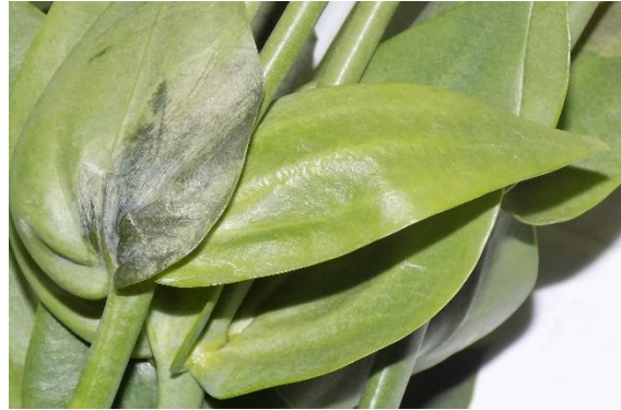
Imagen 12. Clorosis en hoja de Lisianthus (Santana, 2019)

falta o pérdida de clorofila, lo cual está estrechamente ligado a factores como nutrición de la planta y/o características del suelo (Schuster, 2019).