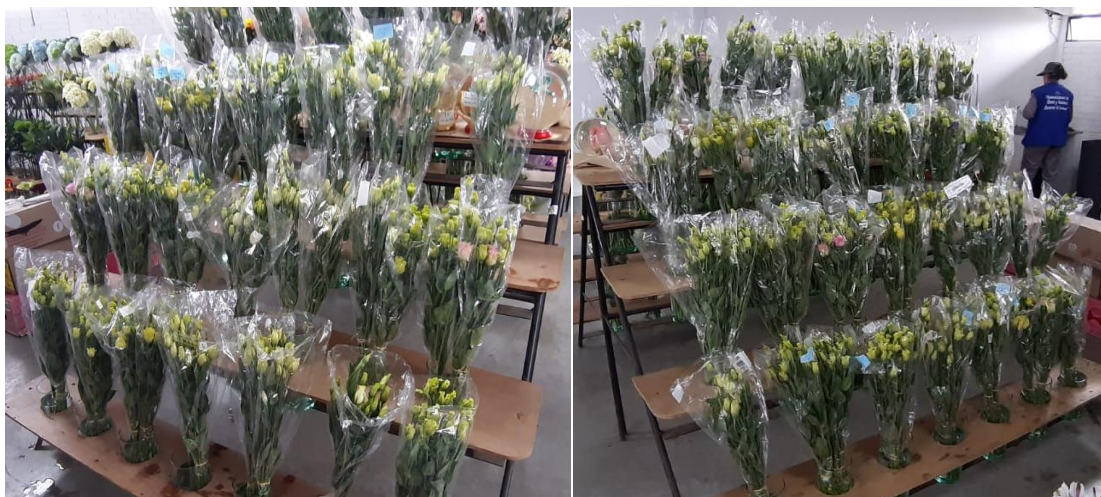
Imagen 10. Floreros con Lisianthus para evaluación de vida en florero (Santana, 2019)