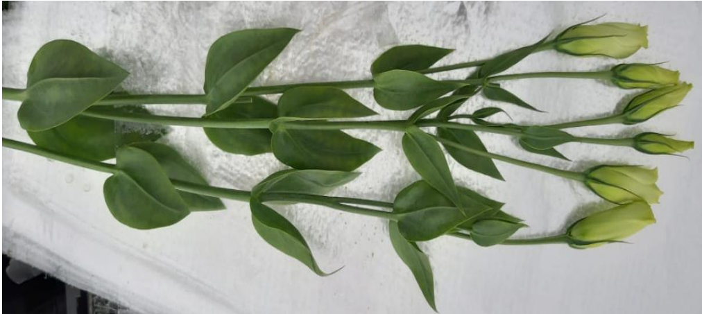
Imagen 1. Tallo de Lisianthus (Santana, 2019)

Los híbridos han sido obtenidos a través de programas de mejoramiento genético adelantados en su mayoría por empresas japonesas; entre éstos, se destacan variedades con flores blancas, rojas o mezclas de colores, además se han obtenido también flores sencillas y dobles, con incluso tres anillos de pétalos. (Cajimela V., 2006). Lo anterior abre las puertas a que el Lisianthus sea una flor apetecida en varias partes del mundo, por ejemplo, los países europeos prefieren flores con tonos azules oscuro sólido, mientras que en Japón y Brasil gustan más flores con bordes azules; y en cuanto al tipo de flor, se venden a los mercados japoneses y europeos más flores sencillas, mientras que en Estados Unidos y Brasil son apetecidas las flores dobles (Corr & Katz, 1997).