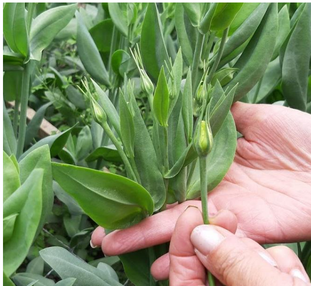
Imagen 2. Botones florales en desarrollo. (Santana, 2019)

3.1.6.2. Segunda fase: Comprende un aproximado de 60 días, es el lapso en que la planta evidencia crecimiento en la parte aérea, alargando el tallo y formando los tallos secundarios; una vez los laterales alcanzan una longitud entre 30 y 50 cm, empieza la formación de los botones florales (ver Imagen 2).