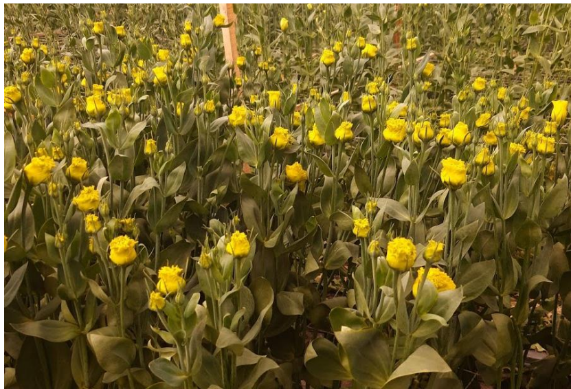
Imagen 3. Cultivo de Lisianthus var Celeb 2 Green. (Santana, 2019)

El ciclo completo puede durar de 90 a 120 días según las condiciones del cultivo y según la variedad (ver Imagen 3).