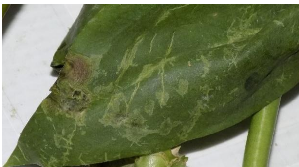
Imagen 14. Maltrato en follaje de Lisianthus (Santana, 2019)

Como se puede evidenciar en el anexo 9.4 (Resultado de la Evaluación de vida en Florero), la clorosis o amarillamiento es uno de los síntomas presentes en todos los ramos, esto permite evidenciar que por ejemplo, con los tratamientos con contenido de Floríssima Green Expression no se obtuvo la respuesta esperada (no presencia de amarillamiento). Por otra parte se evidencian también problemas asociados a la rápida maduración de los tejidos vegetales ( Botrytis , senescencia, entre otros), razón por la cual tampoco se observa el efecto de las soluciones y/o tratamientos con contenido de STS.