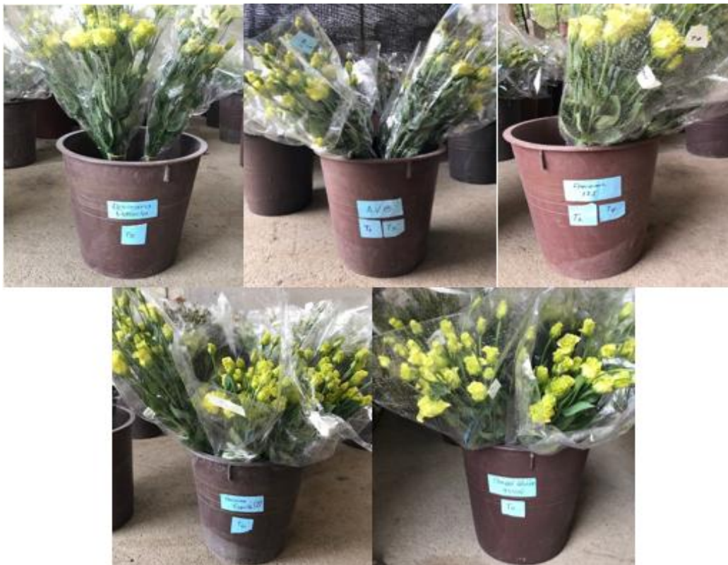
Imagen 7. Ramos de Lisianthus en baldes con tratamientos de soluciones de hidratación (Santana, 2019).

La cantidad de tallos a evaluar está sujeta a la disponibilidad en la producción al momento de cosecha según el cronograma establecido para el desarrollo del presente proyecto. Una vez cosechados, se disponen los tallos en cada tratamiento durante el tiempo indicado en cada caso (ver Imagen 7).