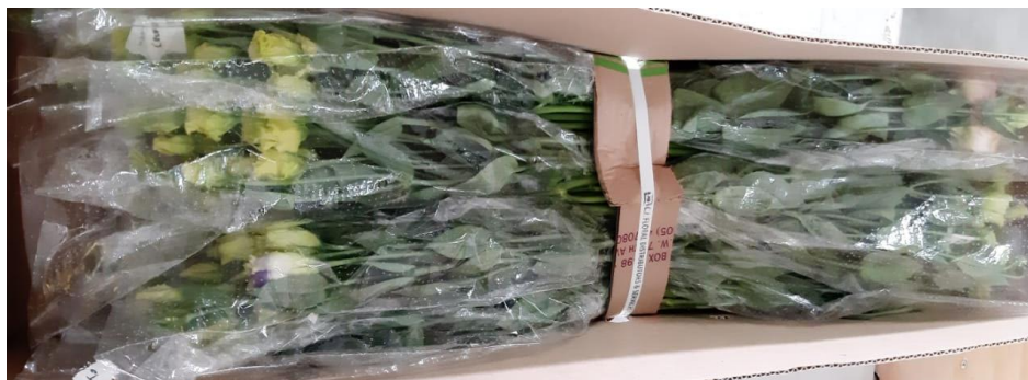
Imagen 9. Lisianthus en caja para flor de exportación (Santana, 2019).

Después de haber sido transportados entre fincas, se dejan los ramos en cuarto frío durante 12 días empacados en cajas de cartón (empaquete de flor para exportación –ver Imagen 9- ). Una vez se cumple el tiempo en cuarto frío, se retiran las cajas con los ramos y se dejan a disposición para el respectivo montaje de los ramos en los floreros.