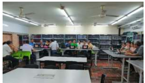
ILUSTRACIÓN 12 APLICACIÓN AUTOEVALUACIÓN