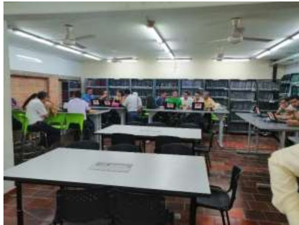
ILUSTRACIÓN 13 APLICACIÓN AUTOEVALUACIÓN