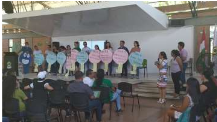
ILUSTRACIÓN 9 EVENTO SENSIBILIZACIÓN Y AUTOEVALUACIÓN