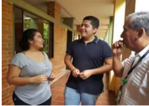
ILUSTRACIÓN 1 CONVOCATORIA A LÍDERES