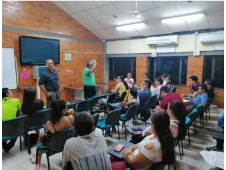
ILUSTRACIÓN 15 ENCUNTROS DIALÓGICOS NOCTURNO