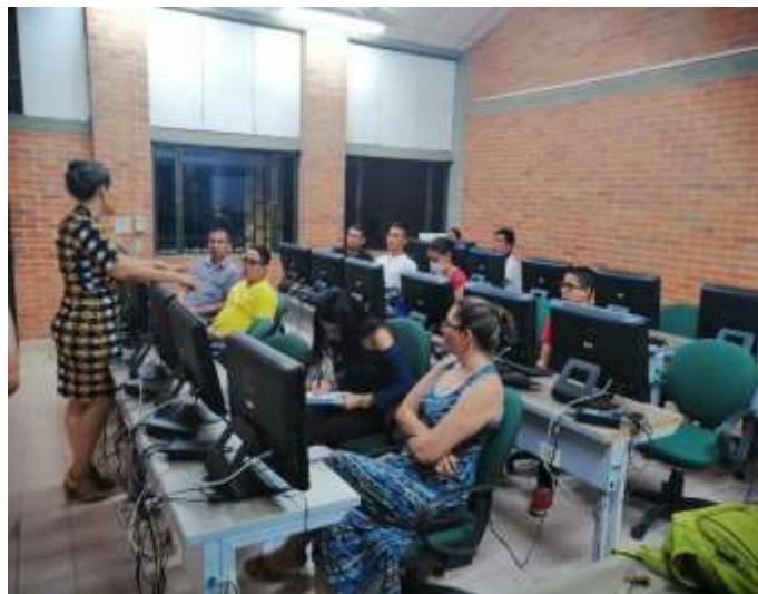
ILUSTRACIÓN 4 REUNIÓN LÍDERES NOCTURNO