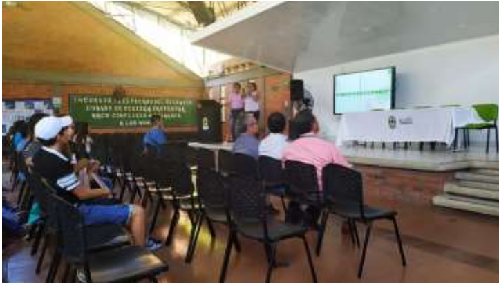
ILUSTRACIÓN 8 EVENTO SENSIBILIZACIÓN Y AUTOEVALUACIÓN