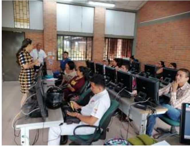
ILUSTRACIÓN 3 REUNIÓN LÍDERES DIURNO