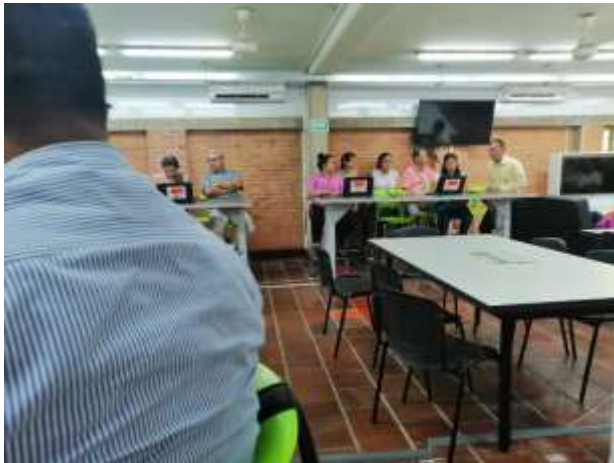
ILUSTRACIÓN 11 APLICACIÓN AUTOEVALUACIÓN