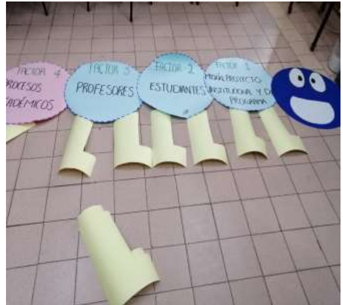
ILUSTRACIÓN 6 CONSTRUCCIÓN DIDÁCTICA AUTOEVALUACIÓN