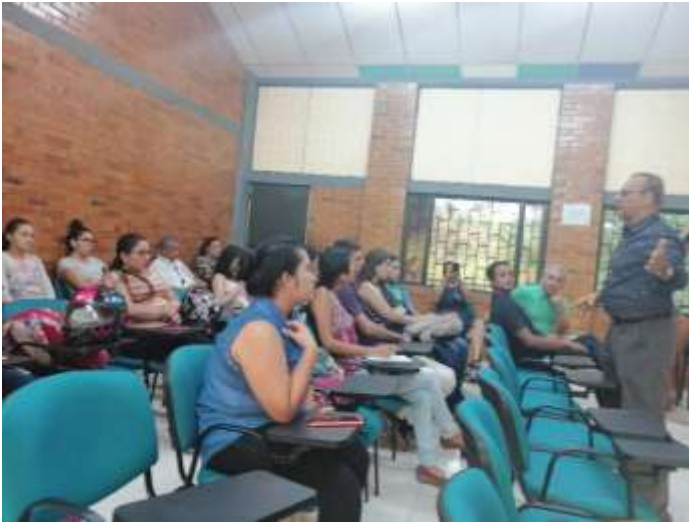
ILUSTRACIÓN 14 ENCUNTROS DIALÓGICOS DIURNO