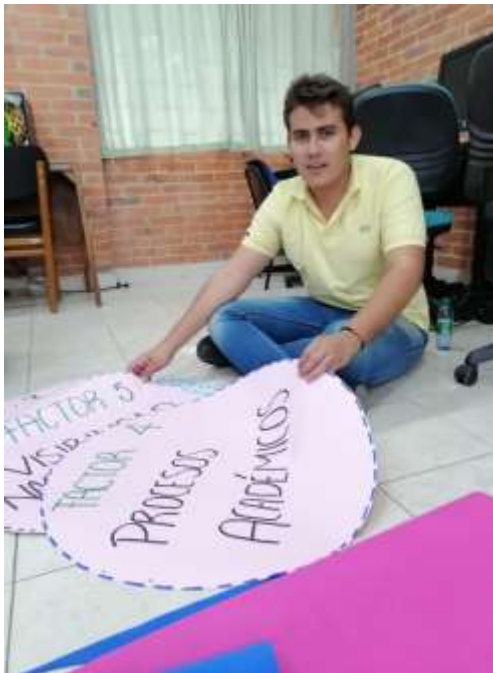
ILUSTRACIÓN 7 CONSTRUCCIÓN DIDÁCTICA AUTOEVALUACIÓN