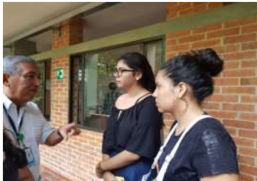
ILUSTRACIÓN 2 CONVOCATORIA A LÍDERES