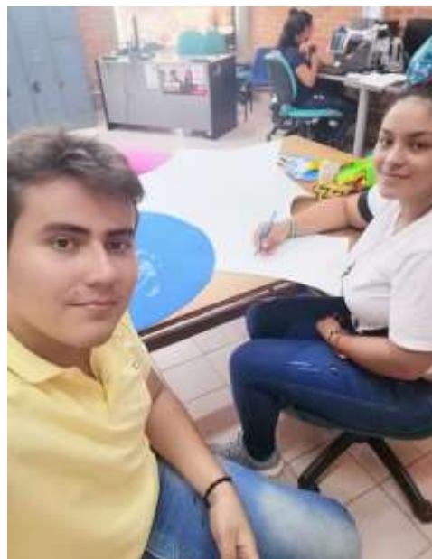
ILUSTRACIÓN 5 CONSTRUCCIÓN DIDÁCTICA AUTOEVALUACIÓN