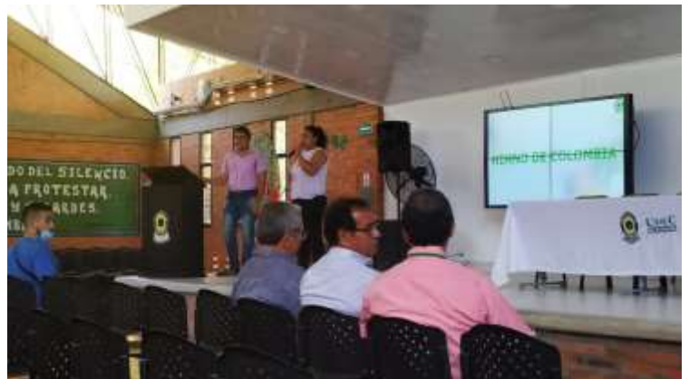
ILUSTRACIÓN 10 EVENTO SENSIBILIZACIÓN Y AUTOEVALUACIÓN