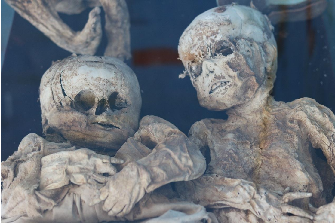
Imagen 31 – Niña y niño del caso 9. – Fuente: Marco Rodríguez.