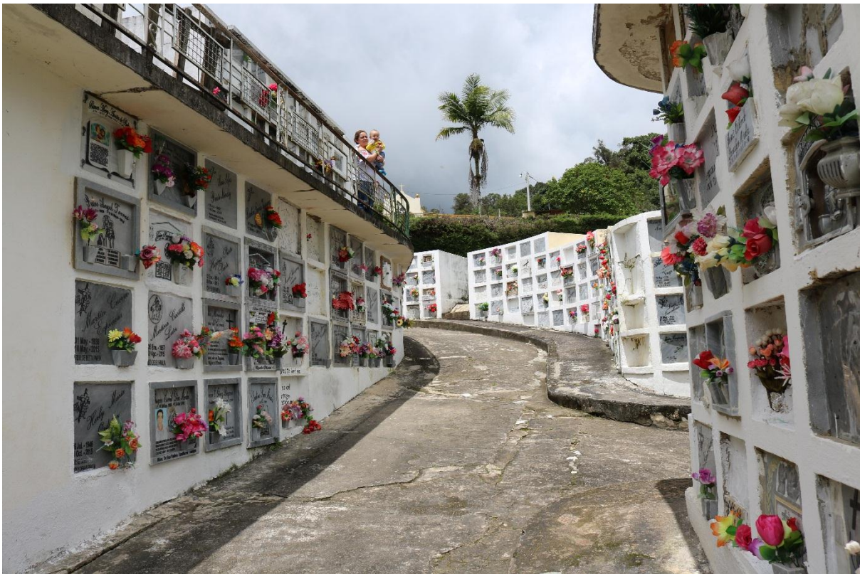
Imagen 5 – Bóvedas del eterno descanso – Fuente: Marco Rodríguez.

En la fotografía número 3, se puede observar las bóvedas en dónde son depositados los cuerpos y que trascurridos un período entre 5 y 8 años, los cuerpos son exhumados para saber si han tenido el proceso de momificación. Según algunos habitantes del municipio, en el momento de la construcción del cementerio los obreros utilizaron mucha cal, lo que podría ayudar a la conservación de los cuerpos, aunque esta teoría no está científicamente comprobada.