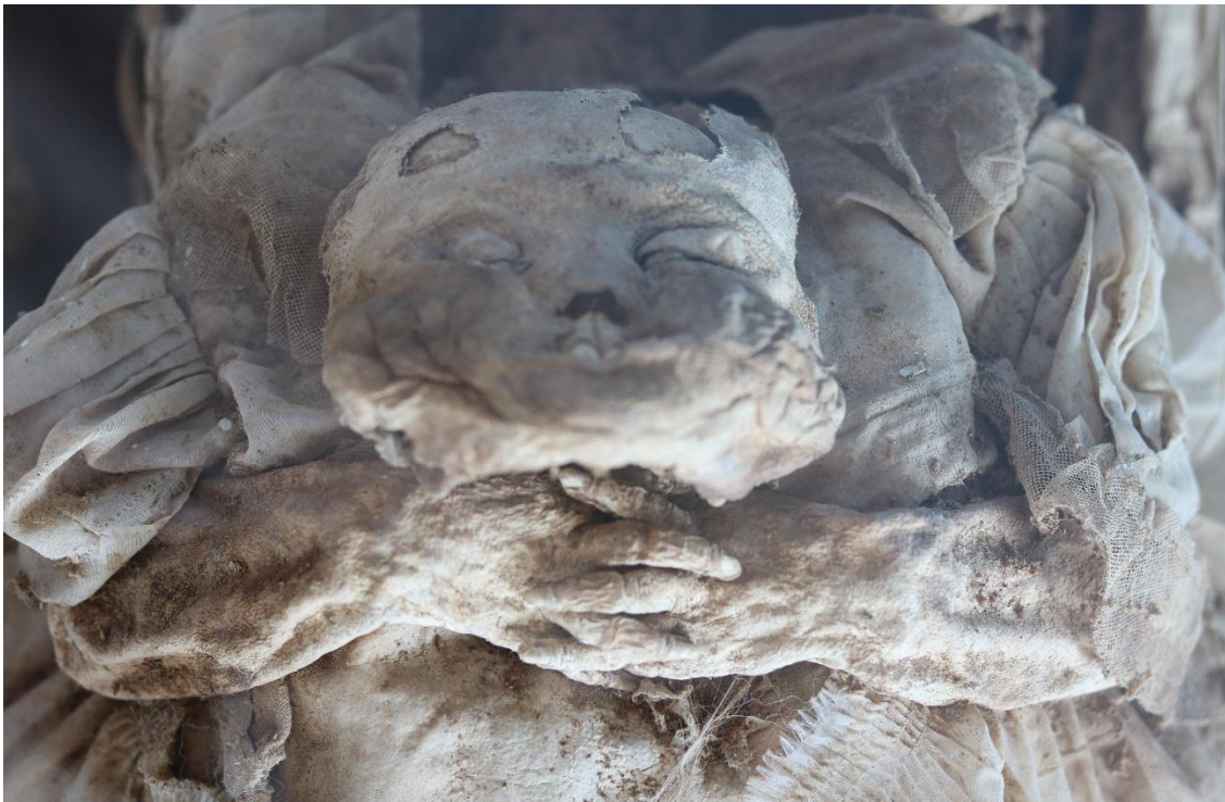
Imagen 29 – Hija de la momia del caso 8.