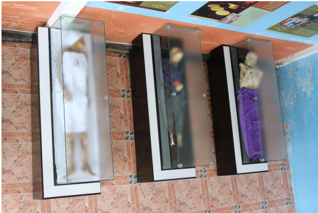
Imagen 7 - Panorámica desde el segundo piso del museo 2