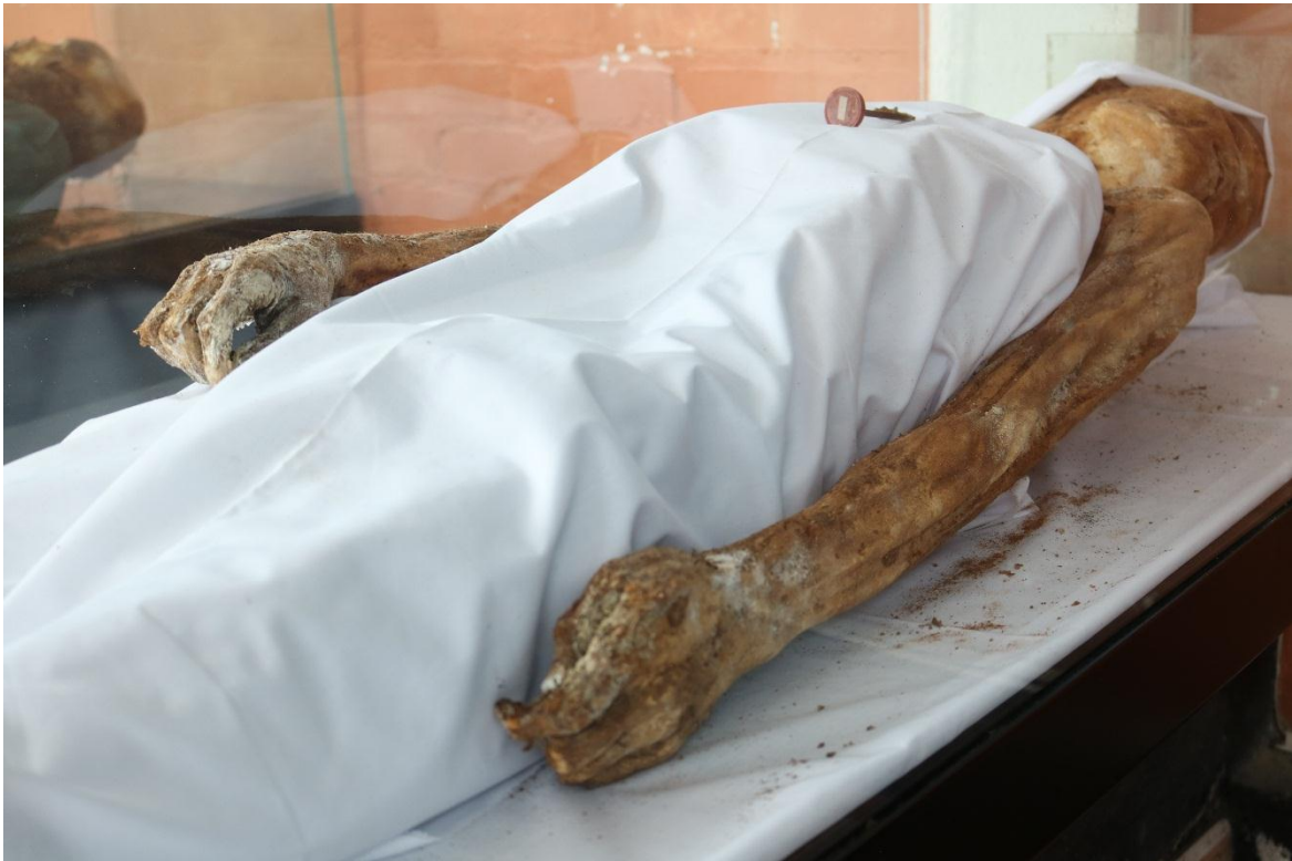
Imagen 19 – Cuerpo del caso 4