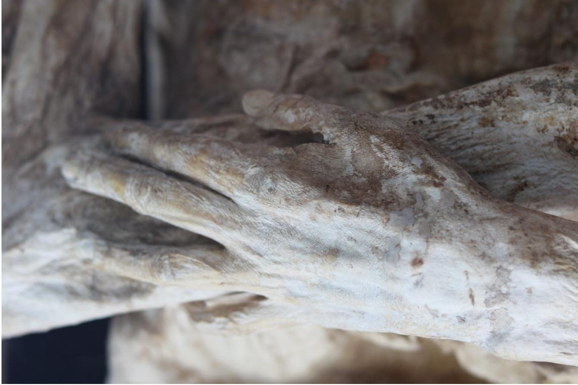
Imagen 9 – Brazos del caso 1 – Fuente: Marco Rodríguez.