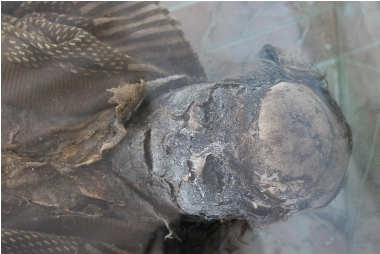
Imagen 26 – Rostro del caso 7 – Fuente: Marco Rodríguez.