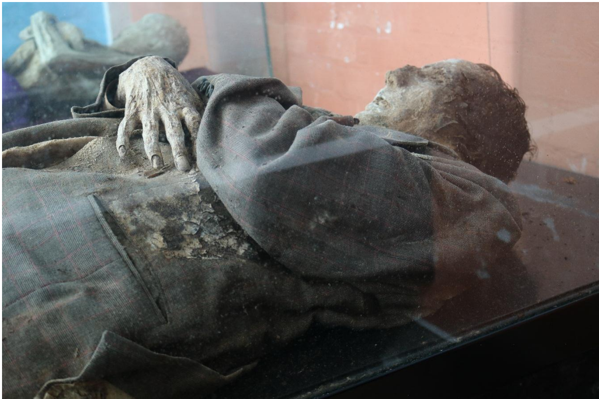
Imagen 13 – Cuerpo del caso 2