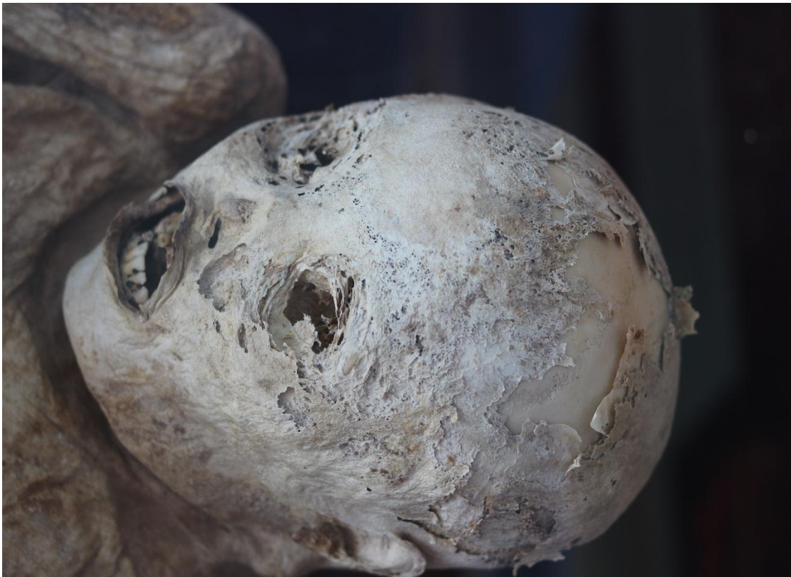
Imagen 8 - Rostro del caso 1