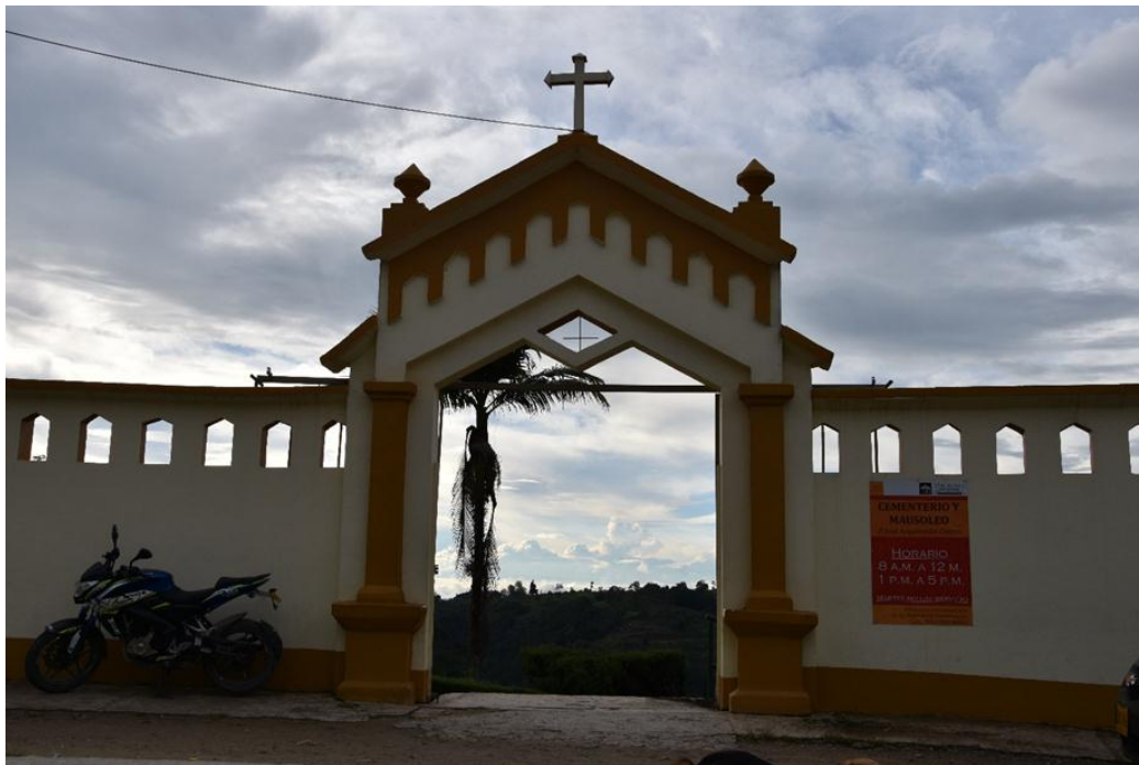
Imagen 2 – Entrada al Cementerio Municipal

Actualmente el Mausoleo José Arquímedes Castro cuenta con un total de 13 momias, de las cuales 5 pertenecen a niños y bebés y 2 más que están en su etapa final de momificación, las cuales al ser exhumados de las bóvedas todavía no habían culminado su proceso y que una vez se produjera, los familiares manifestaron su intención de donarlas al museo.