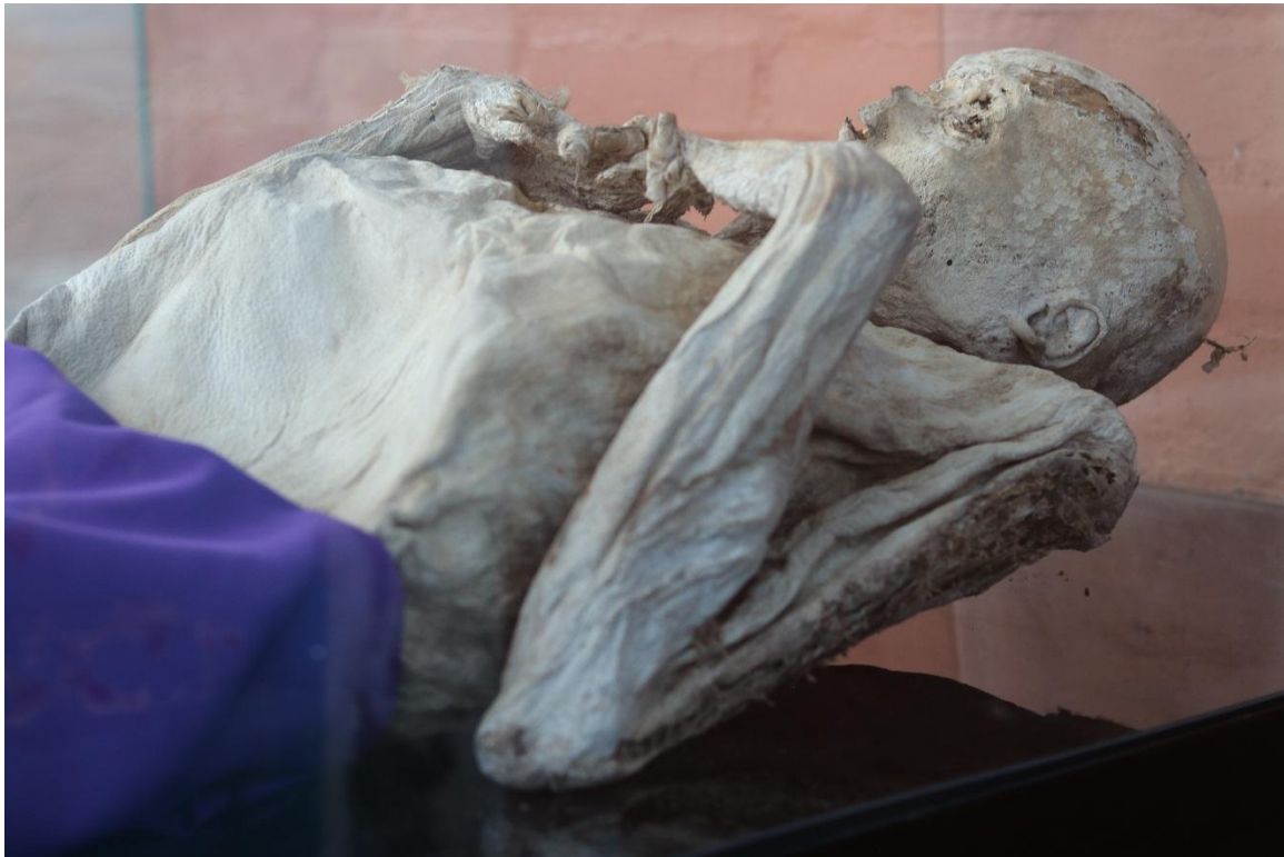
Imagen 25 – Cuerpo del caso 6.