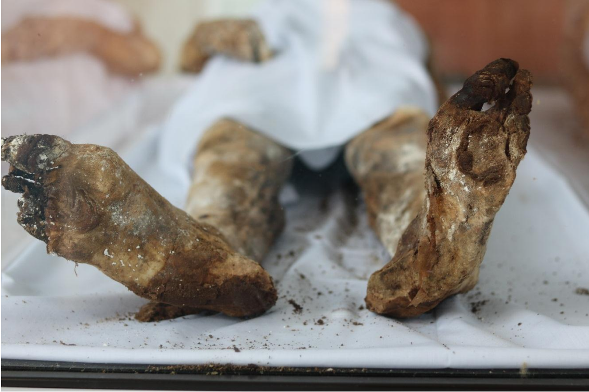
Imagen 18 – Pies del caso 4 – Fuente: Marco Rodríguez.