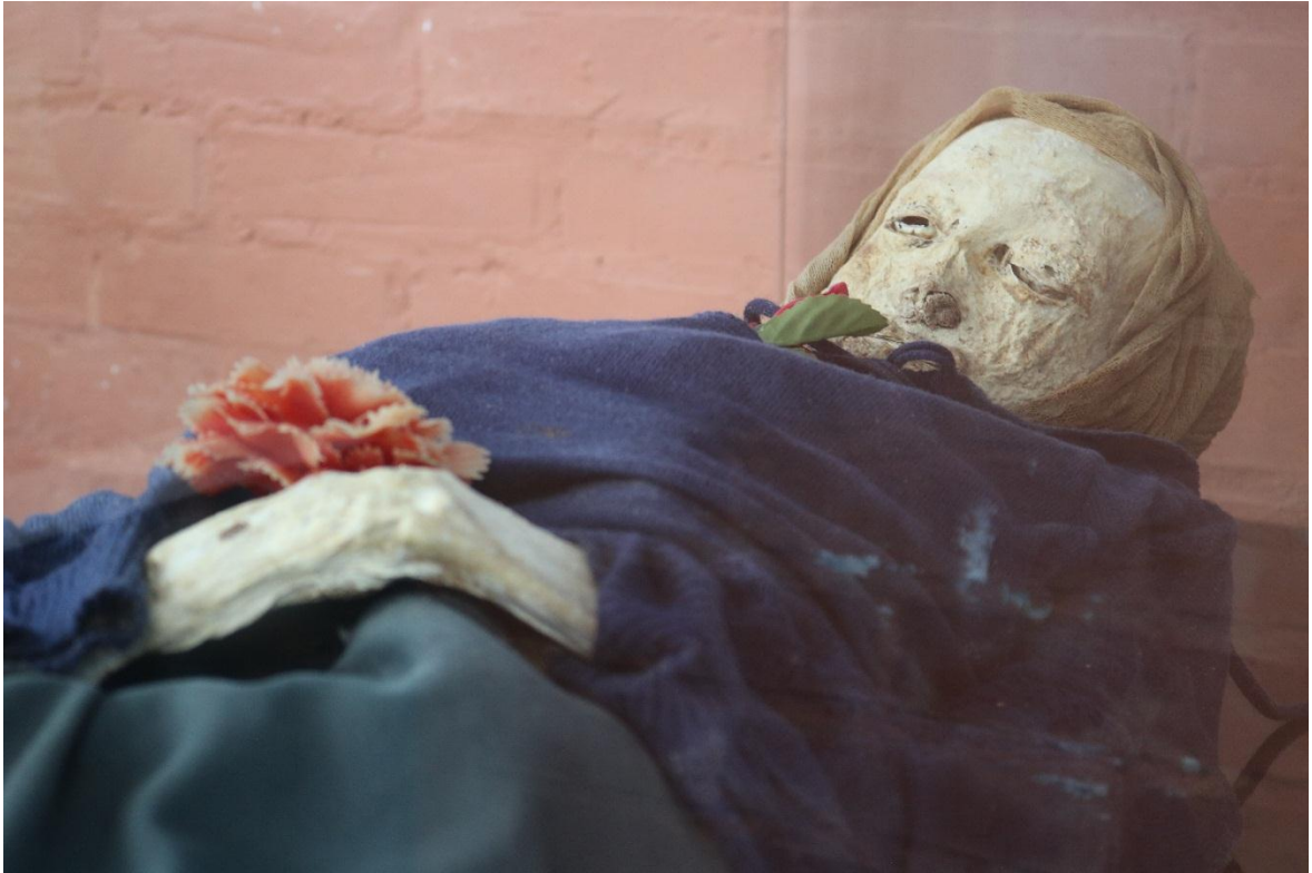
Imagen 21 – Cuerpo del caso 5 – Fuente: Marco Rodríguez