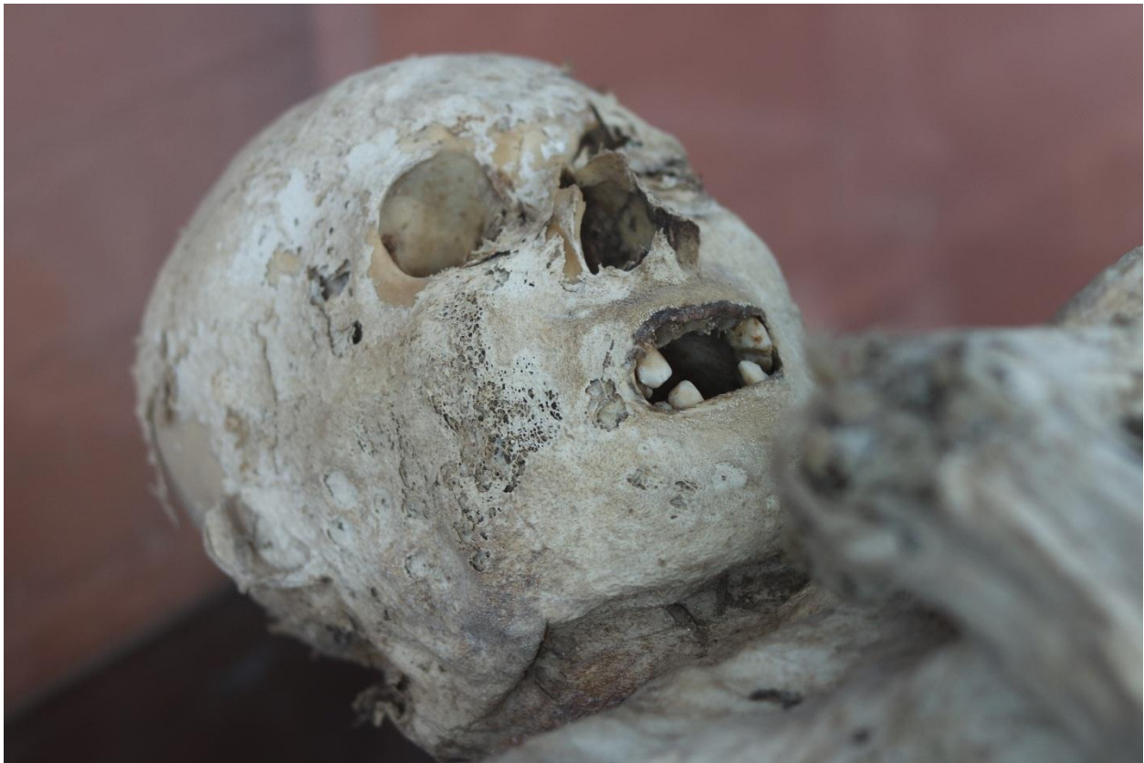
Imagen 23 – Rostro del caso 6.