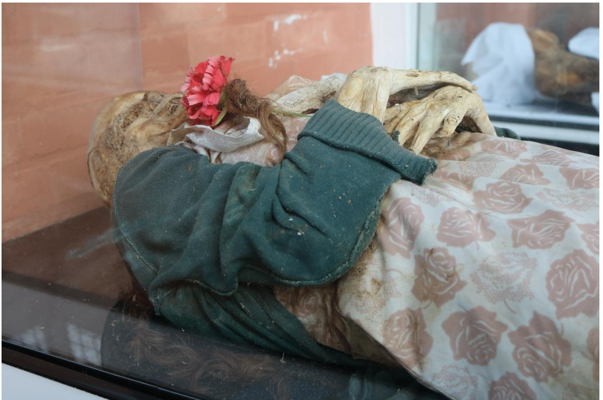
Imagen 16 – Cuerpo del caso 3 – Fuente: Marco Rodríguez.