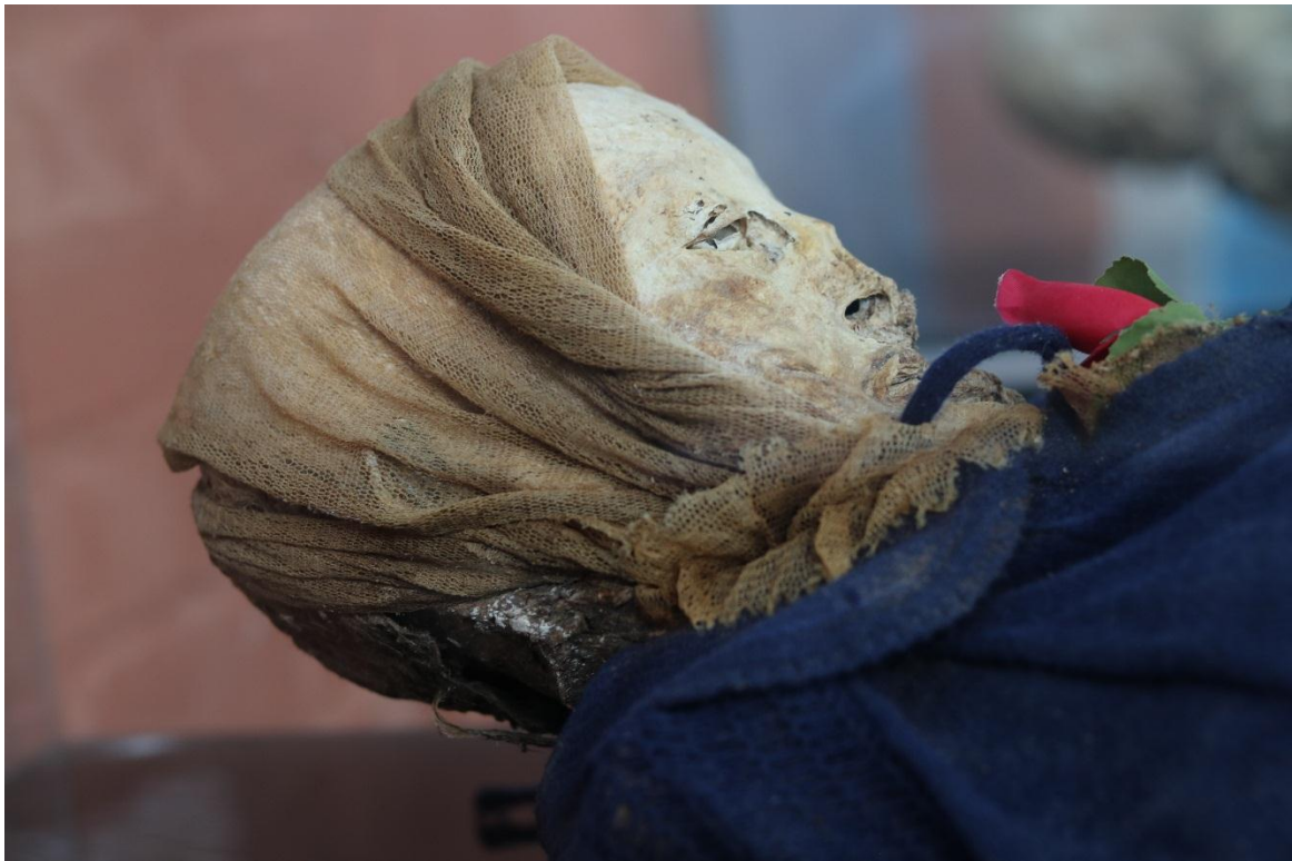
Imagen 22 - Perfil de derecho del caso 5.