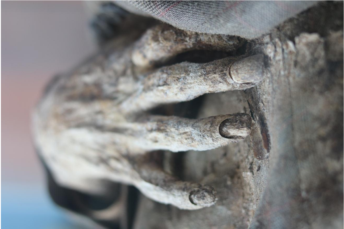
Imagen 12 – Mano del caso 2