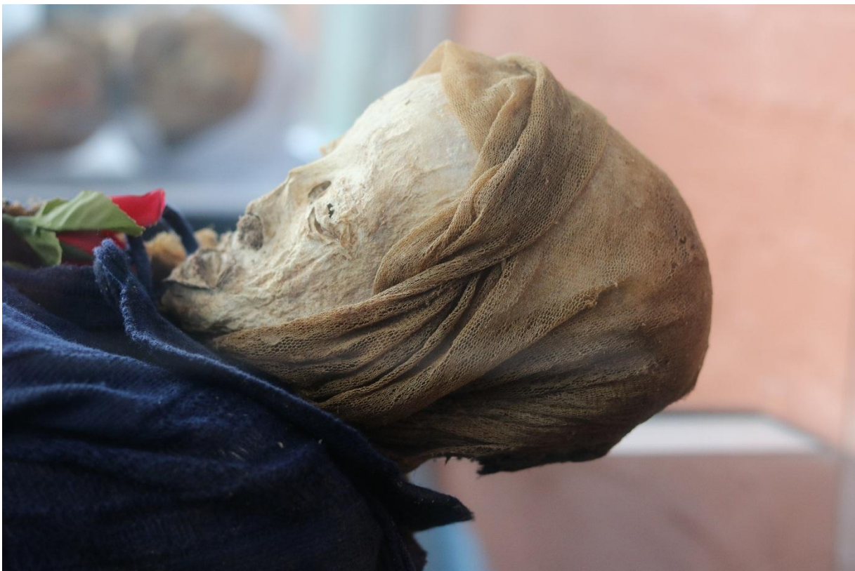
Imagen 20 – Perfil izquierdo del caso 5