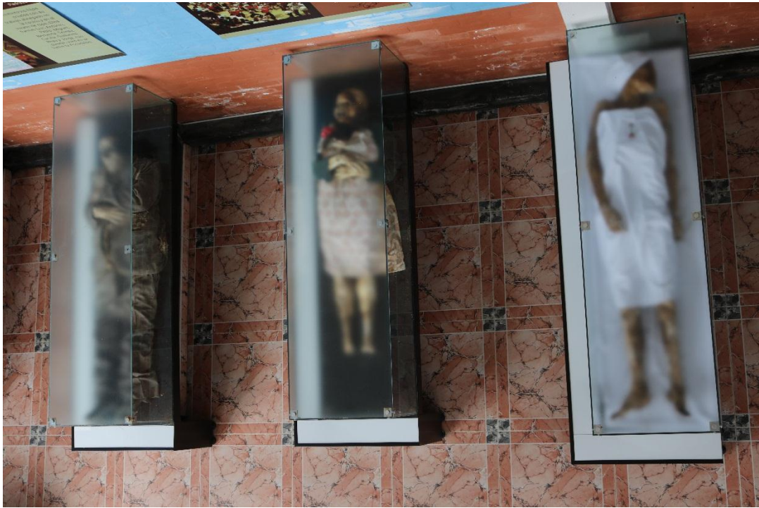
Imagen 6 - Panorámica desde el segundo piso del museo 1