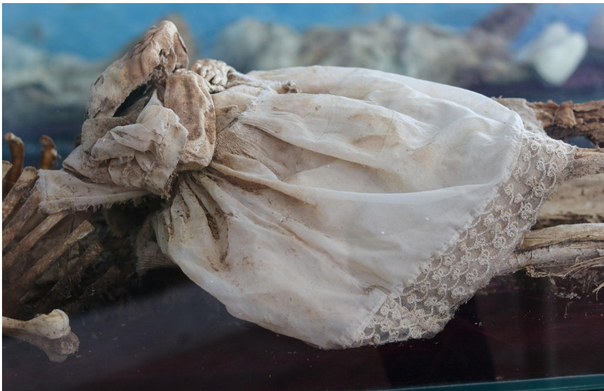
Imagen 30 – Madre e hija del caso 8.

En el caso 7 las momias no cuentan con registros de identificación. Son las momias más antiguas del museo, pues tienen alrededor de 50 años de exhibidas y 10 años de estar sepultadas en bóveda. Las dos son de sexo femenino y es uno de los casos que más despierta el interés entre los habitantes y turistas, pues las momias corresponden a una madre de aproximadamente 24 años de edad y su hija de 3 meses de edad a la hora del fallecimiento. Según algunos pobladores, ellas habrían sufrido un accidente, de allí que las hayan enterrado juntas. Por el tiempo que llevan en exhibición, la momia adulta es la que presenta el mayor grado de descomposición, evidenciándose en que la única parte en dónde se conservan los tejidos de la piel es en las piernas y los pies. En la cara se pueden identificar pocos procesos de conservación, más exactamente de algunas partes del cabello. En el caso de la niña, todavía conserva la vestimenta del momento en el que fue sepultada y se logran conservar partes como los pies, los brazos y algo de su cara.