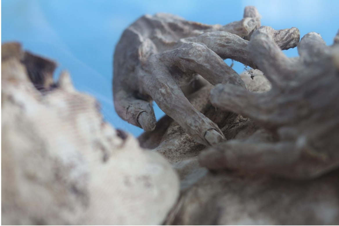
Imagen 24 – Manos del caso 6.