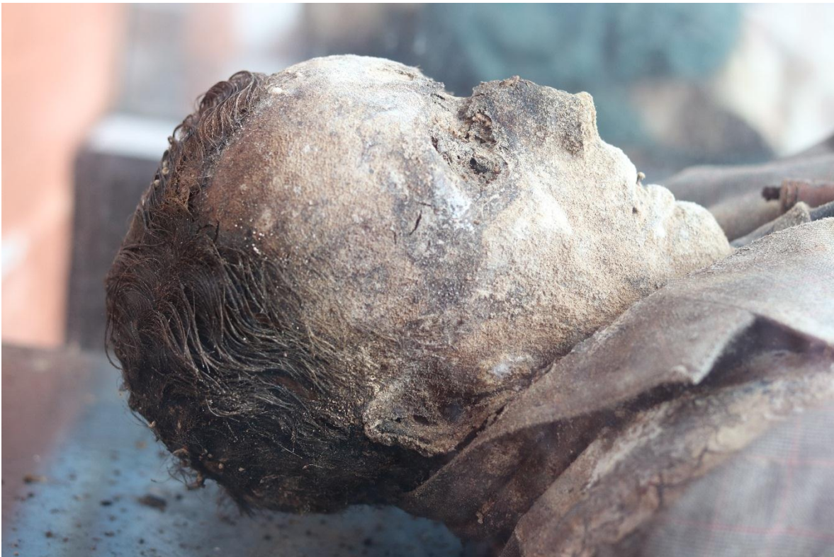
Imagen 11 – Perfil derecho del caso 2 – Fuente: Marco Rodríguez.