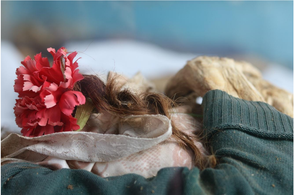
Imagen 15 – Ropa y brazos del caso 3 – Fuente: Marco Rodríguez.