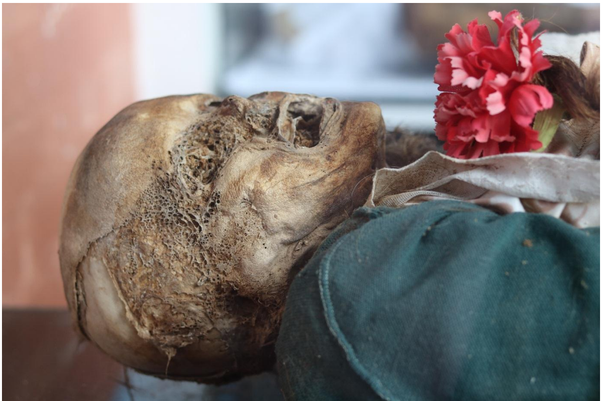
Imagen 14 – Rostro del caso 3