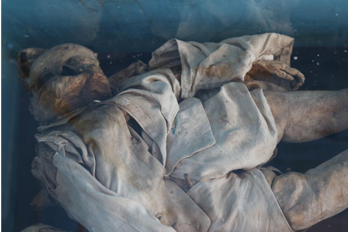
Imagen 33 – Niño 2 del caso 9

Los niños del caso 8 no presentan algún tipo de identificación. Son un grupo de 5 niños (3 niños y 2 niñas), los cuales tuvieron 8 años de estar sepultados en bóveda y 40 años de estar exhibidos en el museo. Se desconoce si ellos pertenecen a la misma familia, pues nunca fueron reclamados por sus familiares. Al igual que en el caso anterior, se desconoce si actualmente existen parientes de vivos de ellos. Las edades de los niños oscilan entre los 3 meses y los 2 años. Éstas momias se caracterizan porque todos ellos han logrado conservar sus prendas de vestir, también es posible observar en la altura del rostro partes como los ojos, dientes y las mejillas, característicos de esa edad; en las momias más jóvenes es posible observar la fontanela sobre su cabeza (hoyo con el que nacen los bebés). Con relación a los brazos y las piernas, algunos conservar los zapatos con los que fueron enterrados y los que no tienen, los pies han seguido conservados. A pesar del tiempo que llevan expuestos, son las momias que han tenido