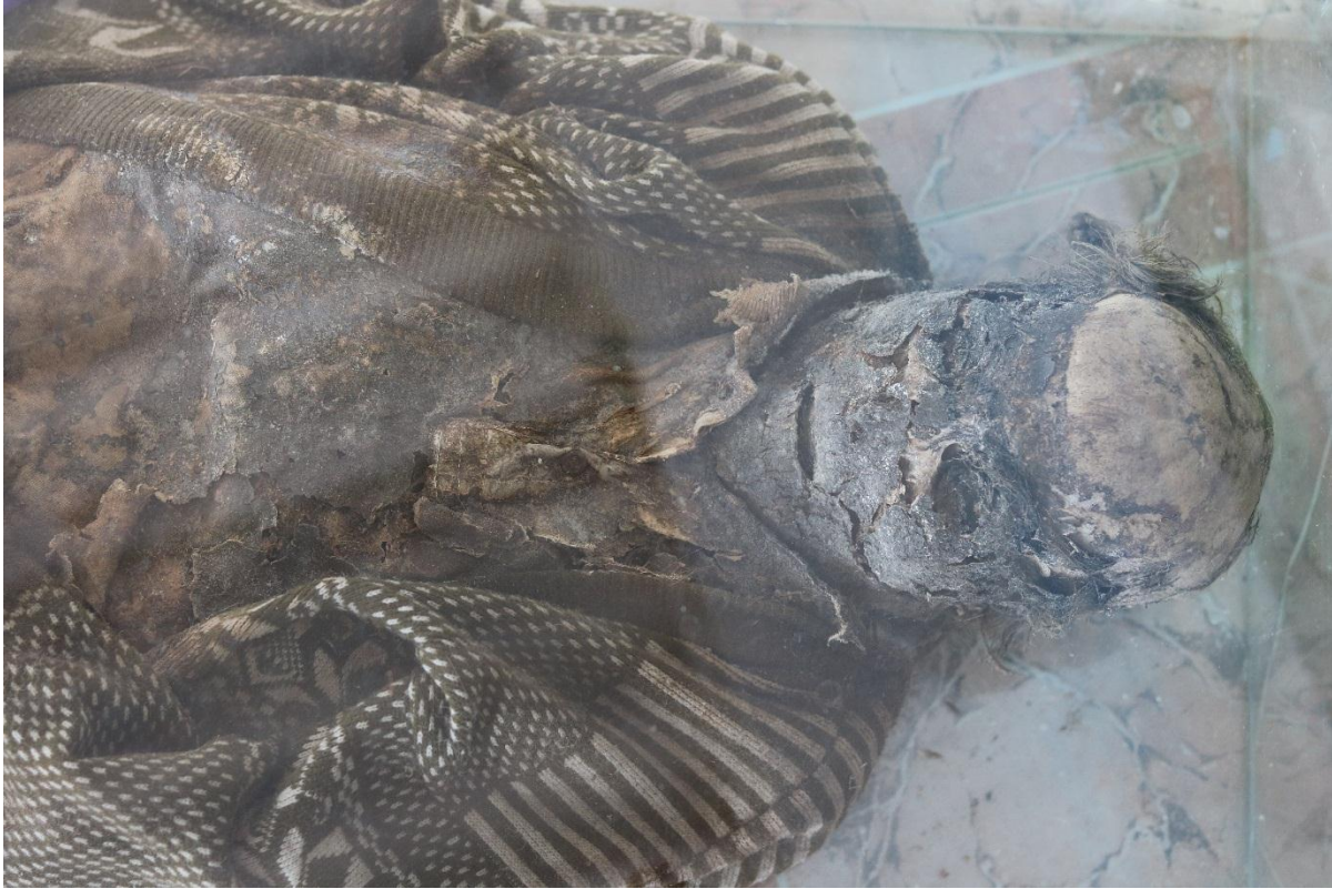
Imagen 27 – Parte del cuerpo y rostro del caso 7.

El caso 6 actualmente no cuenta con registros de identificación, de sexo masculino, está ubicado en el segundo piso del museo. Estuvo aproximadamente 8 años sepultado en bóveda y 25 años de estar exhibido en el museo. Esta momia se caracteriza por conservar los atuendos al momento de ser sepultado; en torno a la conservación, el cabello siguió con su proceso natural de crecimiento en algunas partes de la cabeza, en el caso del rostro, se observa un deterioro a la altura de los ojos, así como algunos orificios y agrietamientos, en el caso de las manos, algunos dedos se han descompuesto, otros todavía permanecen en la mano. Ésta momia, a diferencia de las demás, se caracteriza por tener un tono oscuro en todo su cuerpo, que no corresponde al color de piel que tuvo cuando estaba vivo. Actualmente se está tratando de contactar a los posibles familiares para lograr su plena identificación.