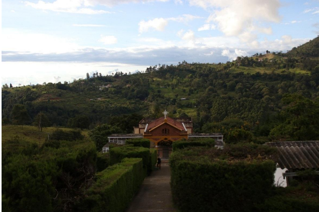
Imagen 3 – Panorámica del Mausoleo José Arquímedes Castro – Fuente: Alejandra Castañeda.

Al fondo de la imagen, se puede detallar la capilla que conforma el circuito del Mausoleo y que en la parte museo en dónde están expuestas las momias. Estos lugares se encuentran ubicados dentro del Cementerio.