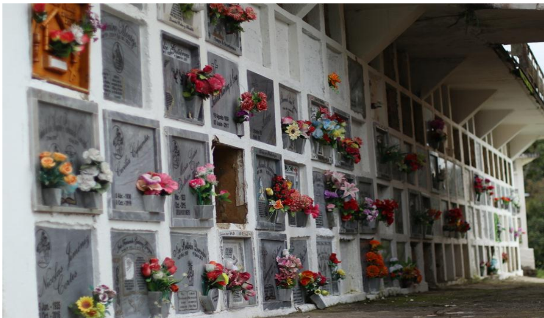
Imagen 4 – Bóvedas del Cementerio – Fuente: Alejandra Castañeda.

Al fondo de la imagen, se puede detallar la capilla que conforma el circuito del Mausoleo y que en la parte museo en dónde están expuestas las momias. Estos lugares se encuentran ubicados dentro del Cementerio.