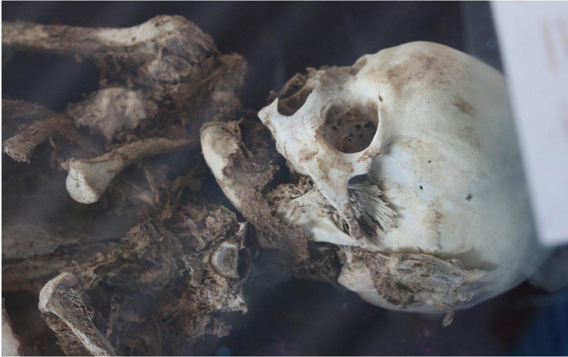
Imagen 28 – Mamá momia, del caso 8.