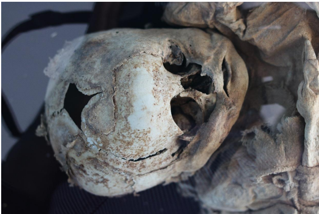
Imagen 32 – Niño del caso 9.