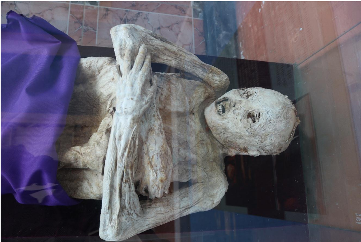
Imagen 10 – Cuerpo del caso 1 – Fuente: Marco Rodríguez.